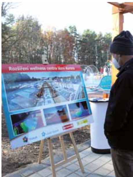
↑ U vchodu do areálu byly tři panely s fotografiemi, které dokumentovaly průběh stavby Třeboňského vodního světa