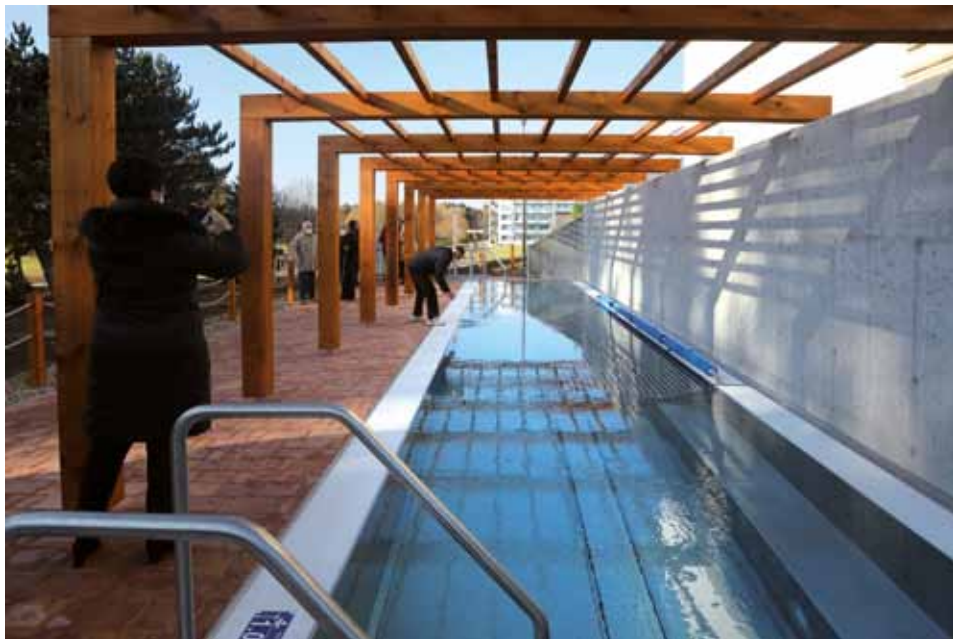
↑ Venkovní whirlpool s masážními lehátky a vodou o teplotě max. 35 °C je umístěn pod krytým relaxačním bazénem s toboganem, divokou řekou a vířivkami

v jednotlivých místech Jihočeského kraje rozvoji, bylo uvolněno 10 milionů. Zbytek platilo město ze svého rozpočtu. „Již v roce 2019 jsme na tuto investici odložili 30 milionů, následující rok dalších 30 milionů a v letošním roce jsme zbytek doplatili,“ dodal Jan Váňa.