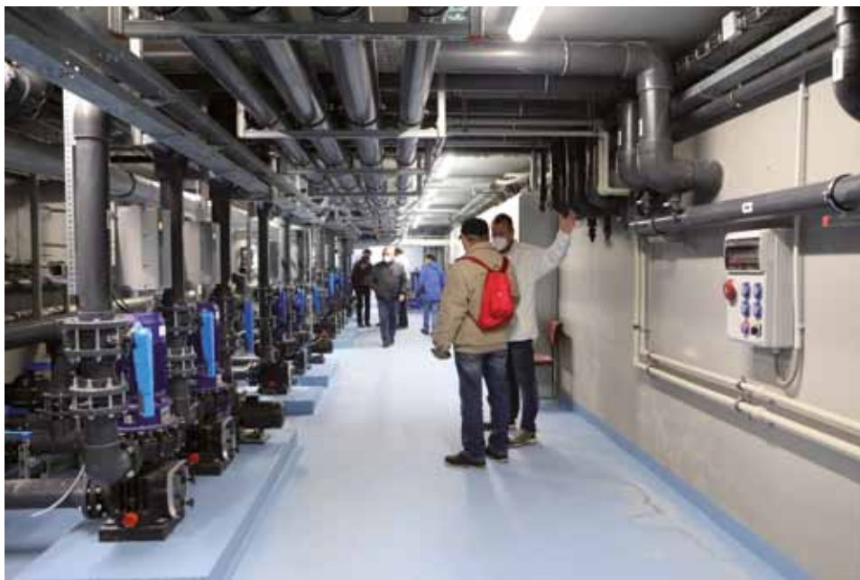
↑ Až nečekaný zájem byl o samotné srdce vodního světa, které je ukryto v podzemí

mnoho rybníků“ starosta rovněž s nadsázkou odpověděl, že je budou pronajímat rybářům jako sádky, což ovšem vzápětí pro méně chápatvé vyvrátil a uvedl vše na pravou míru: „Koupání v Třeboni v čisté vodě dlouhodobě chybělo. Rybníky, které jsou v okolí, jsou především rybníky hospodářské, a tak jsem rád, že toto zařízení vzniklo, a věřím, že Třeboňský vodní svět bude velkou přidanou hodnotou jak pro město samotné, tak pro treboňské lázně, protože konkurenční výhoda takového areálu určitě bude znát i při návštěvnosti. Nepochybně bude přínosem rovněž pro majitele hotelů a penzionů, ale především pro Třeboňáky, a jsem rád, že se nám podařilo splnit stěžejní úkol, který jsme slíbili.“ K financování celé akce starosta sdělil, že na investici ve výši 140 milionů korun včetně DPH se podílely tři subjekty. Slatinné lázně Třeboň, které areál budou provozovat, investovaly do úpravy vody a veškerých technologií přibližně 23 milionů. Z účtu Krajského investičního fondu, který má za úkol pomáhat