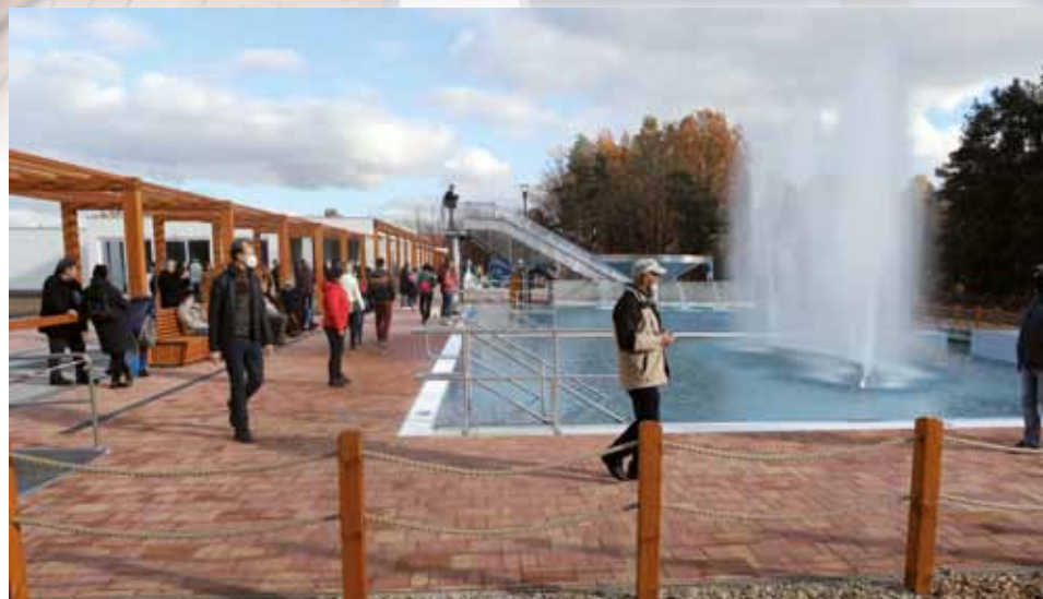
↑ Během Dne otevřených dveří se do Třeboňského vodního světa přišlo podívat přibližně 1600 návštěvníků. Většinu tvořili klienti lázeňských domů Aurora a Berta a Třeboňáci, ale nový areál si přijeli prohlédnout i lidé z Č. Budějovic, Prachatic, Tábora, J. Hradce či Vimperku