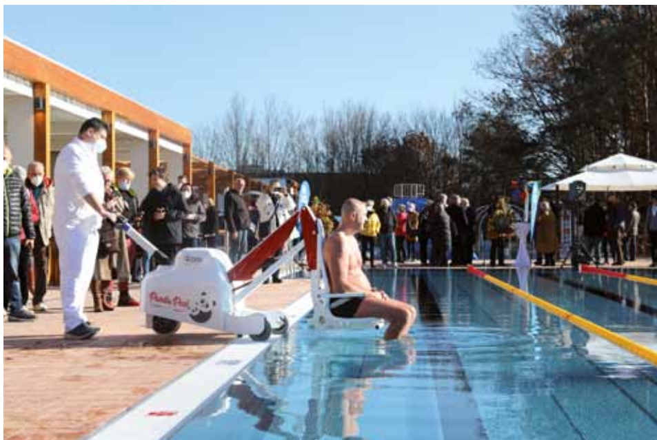
↑ Součástí Dne otevřených dveří byla i malá ukázka nového mobilního zdviháku PandaPool s automatickým pohonem.