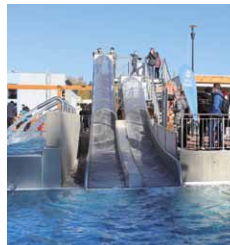
↑ Areál se chlubí i dvěma skluzavkami. Delší má převýšení 3,52 metru a je dlouhá 13,1 metru. Kratší dosahuje délky 10,2 metru s převýšením 2,35 metru