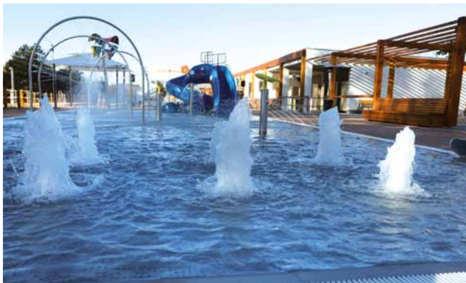
↑ Dětský bazén s řadou vodních prvků a klouzačkami