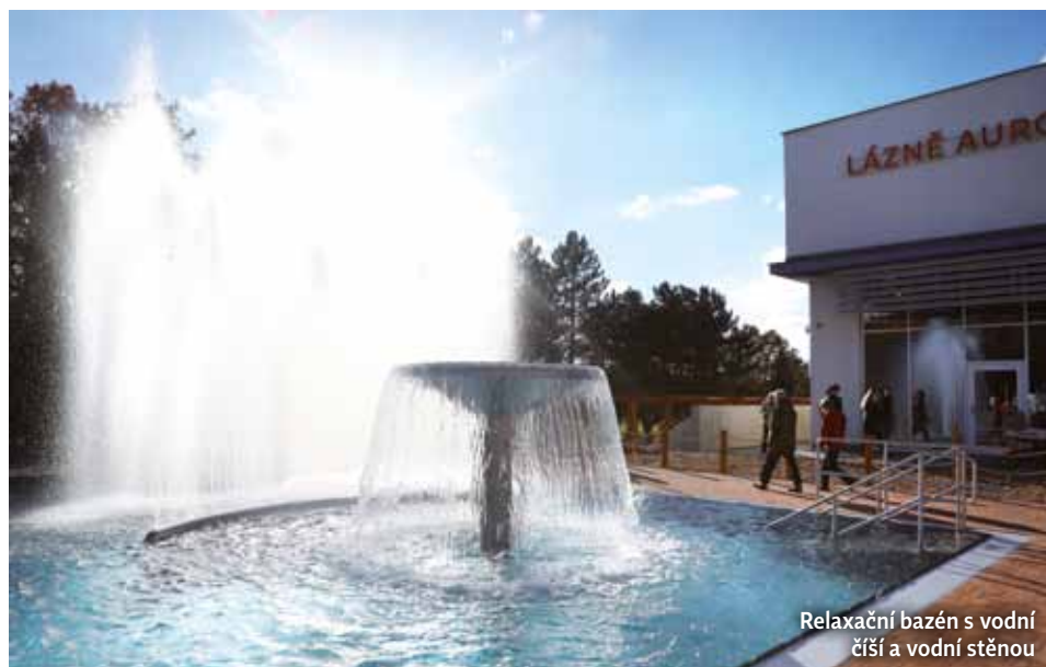
Relaxační bazén s vodní číší a vodní stěnou