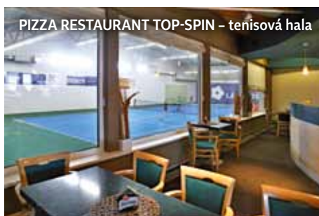
PIZZA RESTAURANT TOP-SPIN - tenisová hala