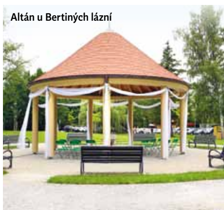
Altán u Bertiných lázní