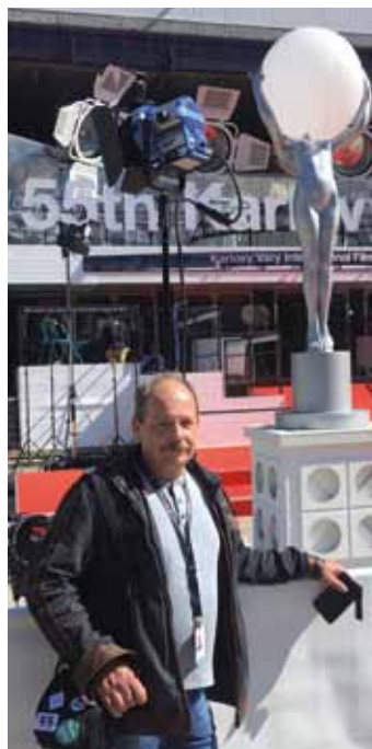
Před hotelem Thermal na Mezinárodním filmovém festivalu v Karlových Varech.

Koncem srpna se v Karlových Varech konal 55. ročník Mezinárodního filmového festivalu, kterého jste se podvanácté za sebou účastnil jako promítač, když nepočítáme loňský rok, kdy se festival nekonal. Jak jste se do Varů dostal, mimochodem jako jediný promítač z jižních Čech? Co vás na festival stále láká, kromě toho, že ve Varech pravidelně slavíte své narozeniny?