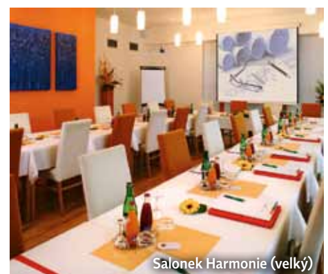
Salonek Harmonie (velký)