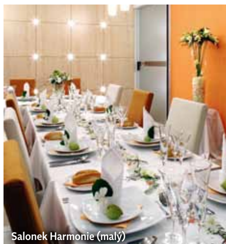
Salonek Harmonie (malý)