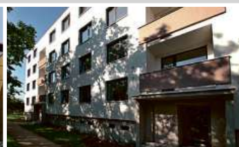
Bytový dům, Brno-Čhrlice