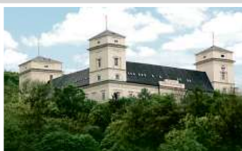
Zámek Račice, přestavba