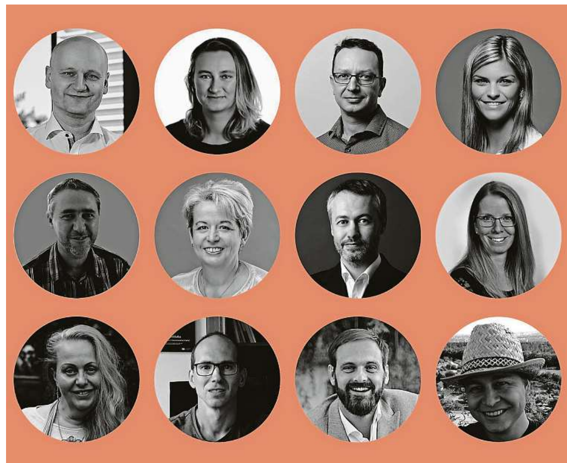
Na online konferenci vystoupí celá řada špičkových odborníků věnujících se oblasti nakládání s odpady.

Program konference je velmi pestrý a jeho součástí je více než desíka odborných přednášek za účasti zástupců státní a obecní sféry, firem i neziskových organizací. Mezi probíranými tématy nebude chybět například téma odpovědné spotřeby a šetrného přístupu ke stávajícím zdrojům, příklady dobré praxe, environmentální vzdělávání, oblast ekologického nakládání s elektroodpadem, problematika recyklace plastů, efektivita zpracování gastroodpadů nebo přiblí-