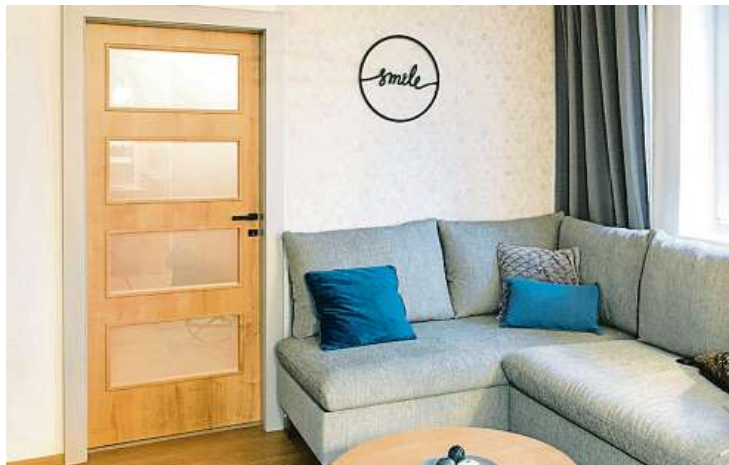
Netradiční použití OKZ v dekoru kontrastujícím se dveřmi, ale ladícím se zbytkem interiéru, foto: SEPOS, spol. s r.o., www.sepos.cz .

Nejen představa nepořádku, ale i problém se sehnáním zručného zedníka, dnes odrazuje od modernizace bydlení mnohé z nás. Nový nábytek dovede místnosti jednoznačně rozzářit, bez renovace takové dominanty, jakou jsou interiérové dveře, se ale ideálního výsledku dosahuje obtížně. Pokud vašim místnostem vévodí nevzhledné ocelové zárubně, může vám pomoci OKZ.