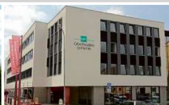
Obchodní galerie, Jihlava