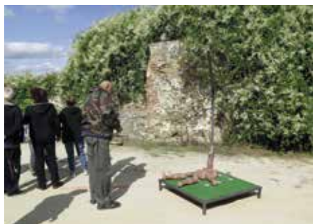
Hry nabízejí příjemné vyžití

Zveme vás na sportovní hry seniorů, které se budou konat 16. září v Panské zahradě vedle letního kina. Zahájení soutěží bude probíhat od 13.00 hod. a registrace