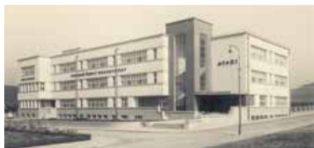
Čelní pohled na školu

21. června roku 1931 v devět hodin ráno byla v ulici Chelčického slavnostně otevřena nová budova obecné školy chlapecké a dívčí, která nesla název Obecné školy Masarykovy. Do školy bylo tehdy zapsáno 530 dětí. Slavnostního otevření nové školní budovy se účastnilo kolem čtyř a půl tisíce lidí.