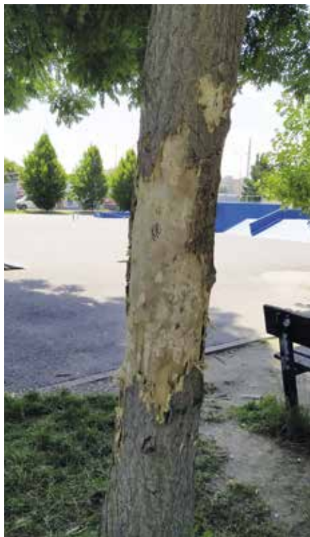
Strom pláče a ochránci přírody také

Na snímku je vidět, jak mladík tříská u skateparku Na Křemelce nějakou věcí do stromu, až z něj odlétala kůra a obnažil se kmen. Protože u autorství videa bylo jméno, nebylo pro „stálistu“ složité zjistit z evidence obyvatel města, kde kameraman bydlí. Sehnal telefonní číslo na otce a ten při šetření této události vyšel strážníkům maximálně vstříc, za což mu patří poděkování, protože obvykle