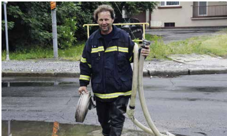
Dobrovolní hasiči v plné práci