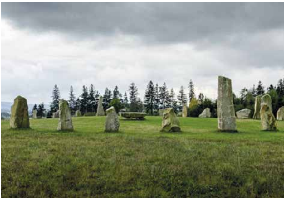
Kamenný kruh druidů u resortu Svatá Kateřina v Počátkách

Každý z kamenů má hmotnost několika tun a jejich nemalá část je ještě zakopaná