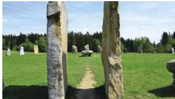
Vstupní brána do českého Stonehenge

Naučná stezka s názvem K pramenům počátek a okolí začíná u sokolovny v Počátkách. Stezka vás zavede k prameni sv. Kateřiny a na dohled od něj stojí také kostel sv. Kateřiny . Od pramene se vydáte krás-