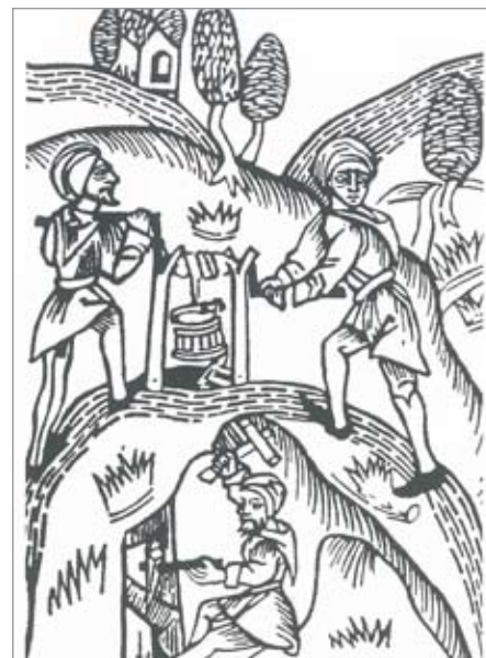
Šachta s horníky