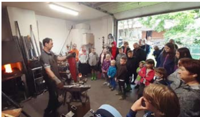
Den s kovářem