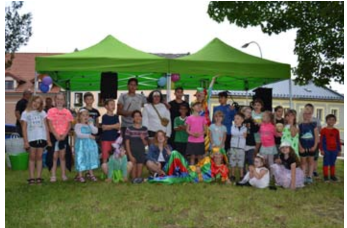
Sousedská slavnost

Jelikož této akci předcházely nešťastné události, kde se obcemi na jižní Moravě prohnalo tornádo, byl výtěžek z dobrovolného vstupného vybrán na pomoc lidem žijícím v této oblasti. Během celého dne se vybralo 4 864 Kč, které byly vloženy na speciální účet Jihomoravského kraje, který byl zřízen