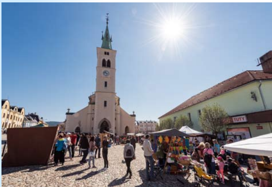
V okolí kostela sv. Markěty proběhne tradiční řemeslný jarmark

„Zvony pro Šumavu“ budou posvěceny během pouti