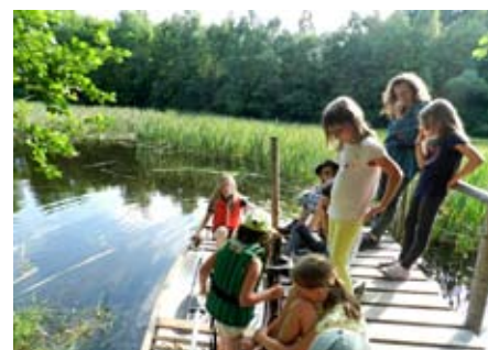
Táborová hra

lených postav žádající děti o zneškodnění místní příšery, která terorizuje vesničany. Na konci listiny je zpráva v morseovce. Ta je odkazuje na nedalekou křižovatku, kde je stopovačka podle pochodových značek z přírodnin. Trasa je dovede do oblasti potoka vytékajícího z rybníku, kde podle azimutu na buzole musí zjistit požadovaný směr. Tam potkávají postavu, která je učí jak společným rituálem zahnat nebezpečné říční humanoidy zvané topivce. Družiny se postupně kradou po hrázi a z rybníka vylézají ošklivé postavy pomazané bahnem a poseté rákosem. Naučený rituál o zahnání postav vychází, topivci opouští rybník a běží do lesa.