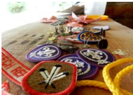
Skautské nášivky na kraj

První dva týdny v červenci jsou pro nás vždy ve znamení letního tábora. Po dlouhém období tvrdých omezení se tak jednalo o shledání všech skautů po dlouhém roce. Náš tábor je schválně bez elektřiny, spíme ve stanech zvaných tee-pee a okolní mohutné stromy nás na dva týdny příjemně odříznou od uspěchané a konzumní společnosti. Nebudu popisovat jednotlivé aspekty táboření a jejich výchovný charakter. Popíšu vám jeden zcela běžný táborový den.