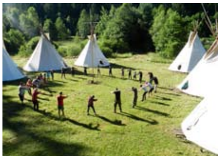
Ranní rozcvička

8:05 Táborníci tvoří na náměstíčku kolem stožáru velký kruh a rádce dne vede rozcvičku. Jedná se spíše o protažení a rozveselení.