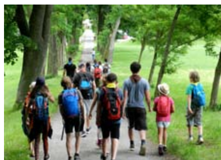
Pochodová skupina

9:15 Polovina vedoucích odchází s dětmi na výlet. Přibalujeme s sebou vodu, KPZ a brožuru skautská praxe. Přicházíme do nedalekého údolí, kde si opakujeme informace z brožury skautské praxe. Ta zpracovává témata od přírody až po zdravotvědu.