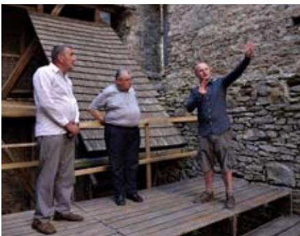
Kardinál si prohlédl hrad

V rámci své dovolené se letos v červenci na třídenní soukromou pouti do Pošumaví vy- dal kardinál Dominik Duka, arcibiskup praž- ský, metropolita a primas český. Hlavním