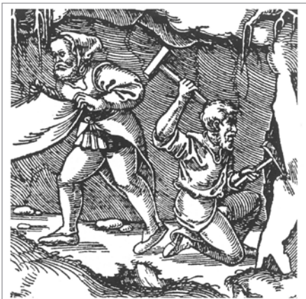
Horník při práci

šachtu (Böhmschacht). Na levém břehu Zlatého potoka jižně od Friedholzu pracoval ještě v 19. století železářský hamr, který tu byl původně zřízen pro potřebu zlatorudných dolů.