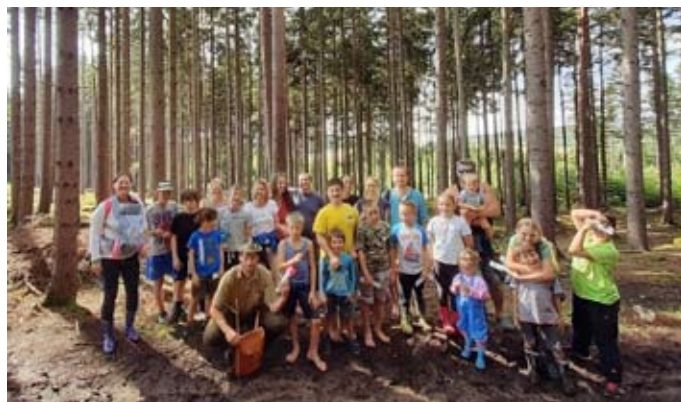
Den s lesníkem