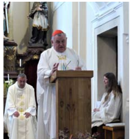
Mše svatá ve Strašíně

Vladimír Horpeniak historik Muzea Šumavy