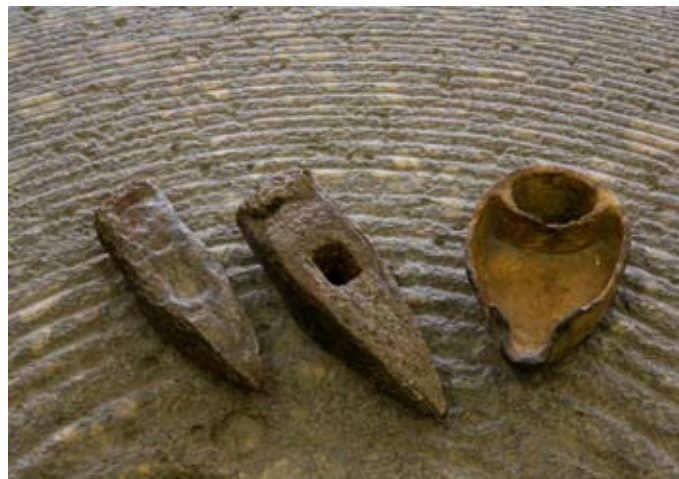
Hornická želízka a kahan, nálezy ze zlatodolů

Vladimír Horpeniak historik Muzea Šumavy