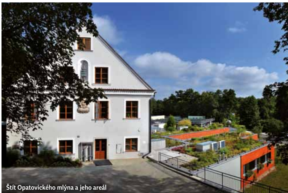
Štít Opatovického mlýna a jeho areál

Jedno z mnoha míst, které byste rozhodně měli v Třeboni navštívit, je Opatovický mlýn. Od roku 1962 v něm má své sídlo Mikrobiologický ústav Akademie věd České republiky, v němž se, mimo jiné, téměř půl století zabývají výzkumem a produkcí mikrořas. A právě odtud putuje exkluzivně do Bertiných lázní sušená biomasa Třeboňské Chlorelly, kterou zde používají především k regeneračním koupelím, o jejichž příznivých účincích jsme psali v letošním červnovém vydání Lázeňské pohody.