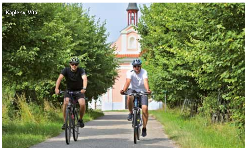
Kaple sv. Víta