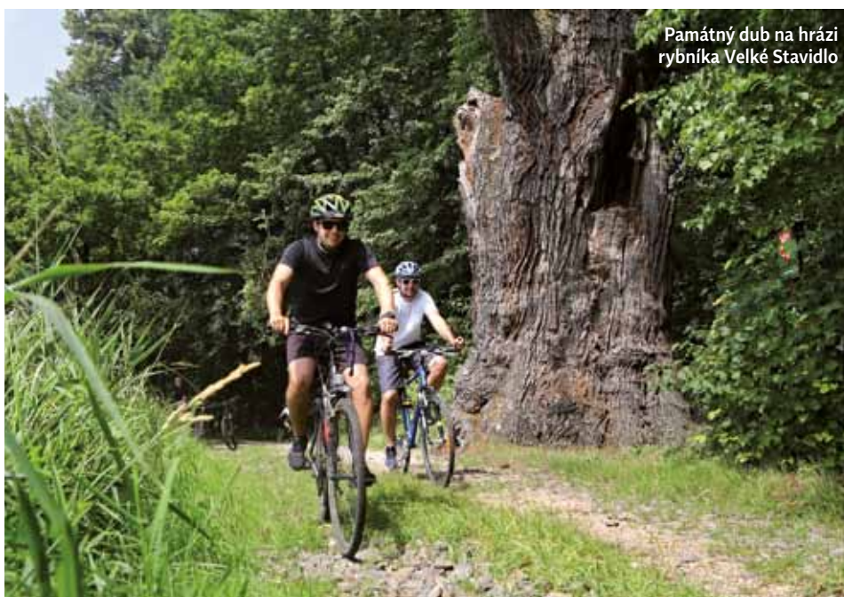
Památný dub na hrázi rybníka Velké Stavidlo

Rovinatá krajina Třeboňska posetá množstvím rybníků, údajně jich je přes 500, je protkaná hustou sítí stezek pro cyklisty, pěší, ba dokonce zde najdeme i dvě trasy pro vozíčkáře (o nich snad někdy příště). Stezky mají různé délky a různé výškové profily, některé jsou určeny jen pro cyklisty, jiné pouze pro pěší (například Okolo Světa) a každá z nich má své zaměření, svůj význam.