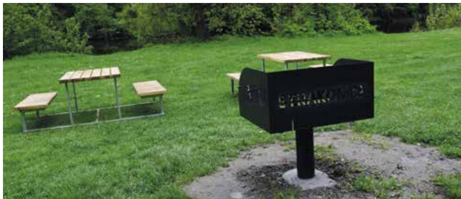
Gril na Podskalí