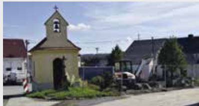
Stávající stav návsi v Hajské

Již nyní je patrné, jaké investiční akce proběhnou v příštím roce. K revitalizaci návsi by mělo dojít v obci Hajská. Jak už to tak bývá, nevyhovující současný stav, ale i nové trendy ve využití veřejného prostoru si vyžádaly změnu v členění plochy návsi na několik lokalit, které budou plnit různé funkce. Důraz bude kladen na odpočinkovou zónu, dětské hřiště, zeleň a zpevněné plochy. Náves byla vždy centrálním prostorem určeným k setkávání lidí, proto padlo rozhodnutí pro celkovou rekonstrukci daného prostoru, která si dává nemalý úkol. A to rozvíjet společenský život v obci Hajská pro padesátku místních obyvatel.