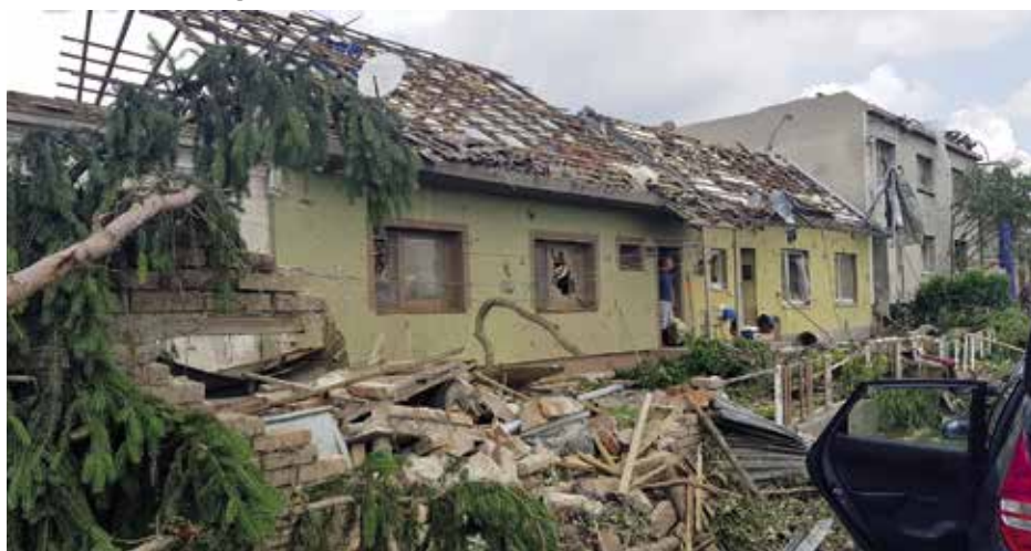
Zkáza, kterou za sebou zanechalo tornádo

Tuto sumu má v kompetenci schválit a poskytnout rada města. Vyšší částka by byla nutná projednat v zastupitelstvu města, což by protáhlo samotné odeslání finančních prostředků o několik týdnů. Proto se vedení města rozhodlo k ob-