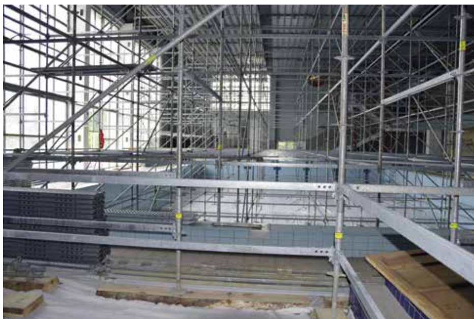
Spleť lešení v bazénu