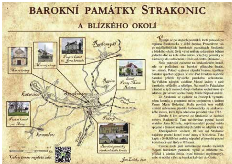
Průvodce barokními památkami