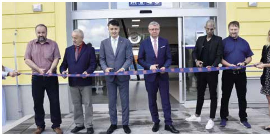
Slavnostní přestřižení pásy