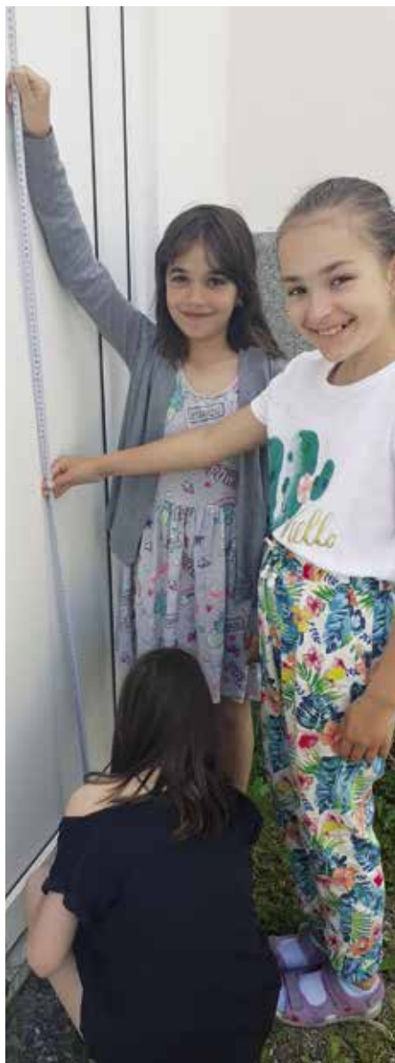
Výuka v době covidu