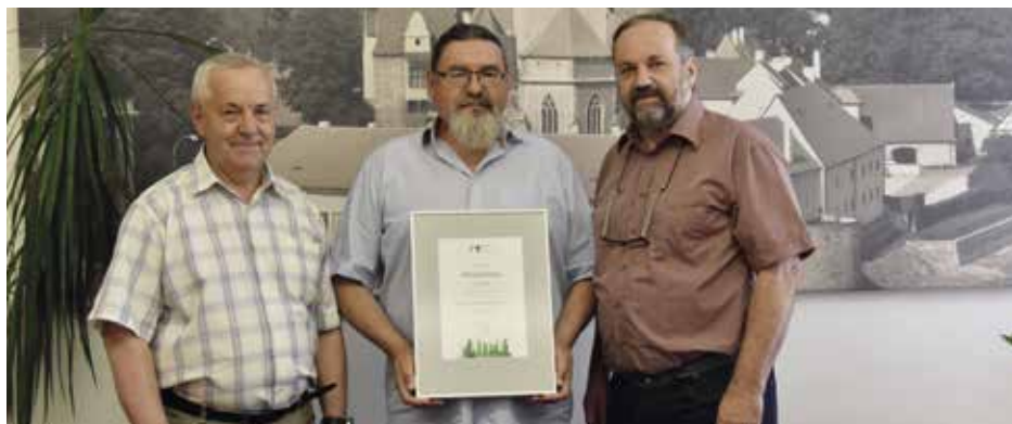
Ocenění v rukou vedení města