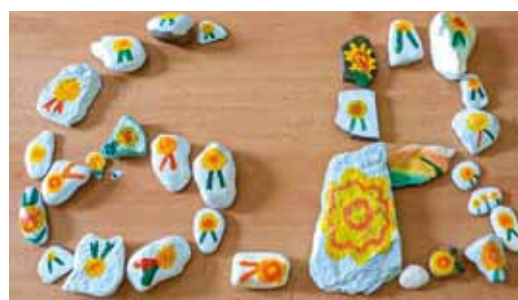
ZŠ a MŠ Ořechov u Brna, 6. B