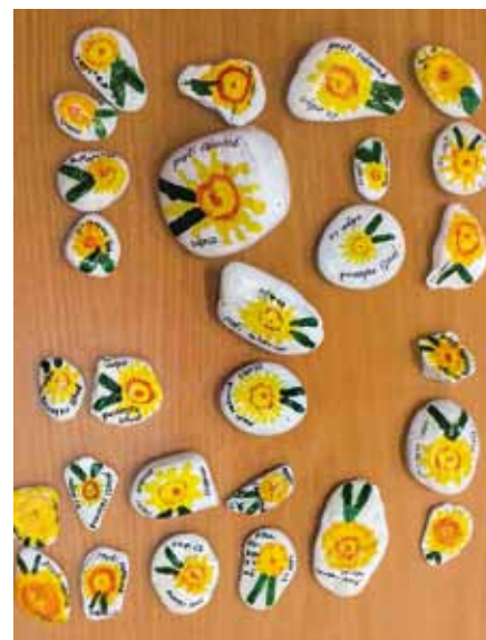
ZŠ a MŠ Ořechov u Brna, 4. B