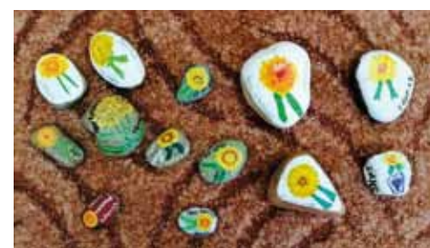
ZŠ Nad Přehradou, Praha 15, tř. 3. A, 4. B, 5. B, 6. B a 7. B