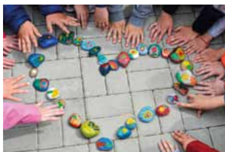
ZŠ Norská Kladno, 2. třída