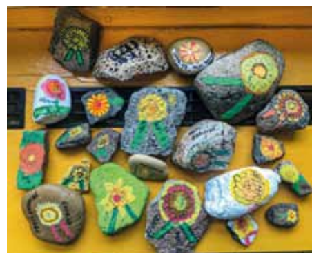
ZŠ J. Pešaty Duchcov, žáci 7. ročníku