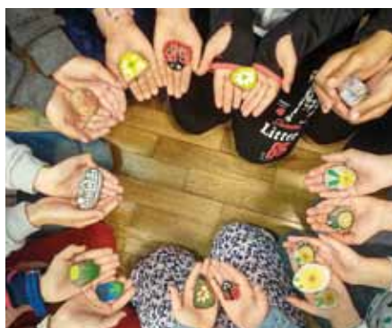
ZŠ Rožďalovice, 2. třída