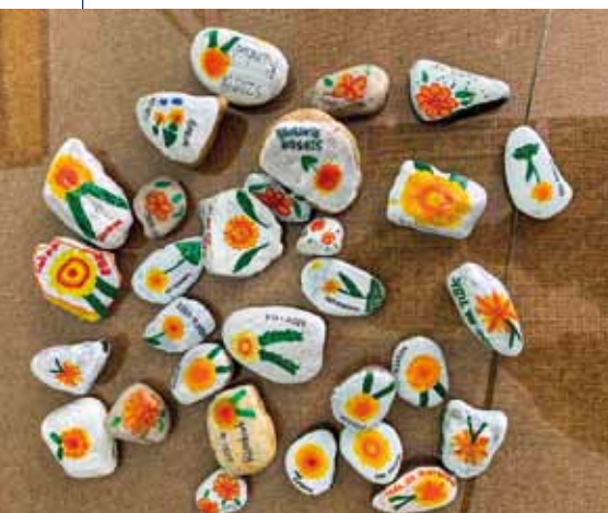
SZŠ a OA Rumburk