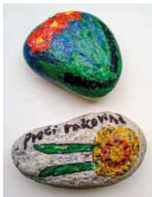
ZŠ Nad Přehradou, Praha 15, tř. 7. A