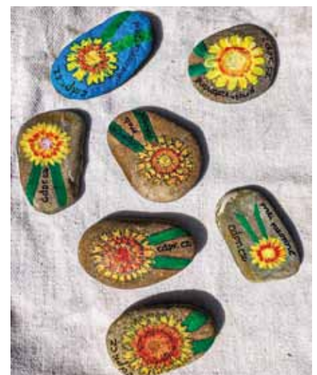
Oddíl KRAKENI, Praha 10