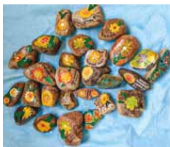
ZŠ a MŠ Ořechov u Brna