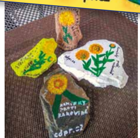
Onko klub Rokycany