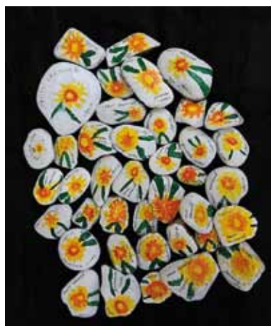
ZŠ a MŠ Ořechov u Brna