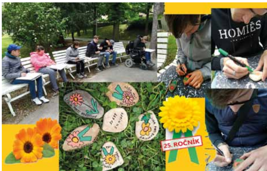
Praktická škola Znojmo, žáci I. A-2