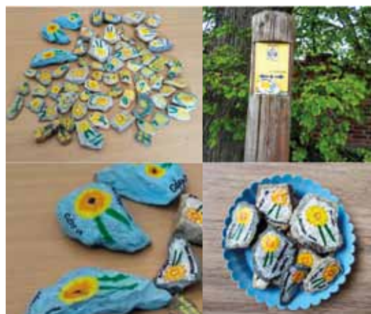
Hasičky z SDH Bezděčín