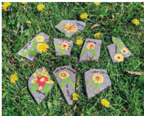
školní družina z Dolní Lomné