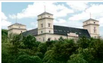
Zámek Račice, přestavba