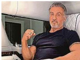
Sylvester Stallone je ve formě i ve svých 75 letech.

O dva roky později pak přišel do kin film Expendables: Postradatelní, který mnozí považují za esenci akčního žánru 80. let, přenesenou do nového tisíciletí. Sylvester Stallone byl scenáristou i režisérem snímku, ve kterém má parta vysloužilých vojáků za úkol zlikvidovat zlého diktátora. A navrch si zahrál hlavního hrdinu, kterému sekundovali Arnold Schwarzenegger, Bruce Willis, Dolph Lundgren, Mickey Rourke nebo