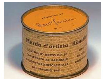
Piero Manzoni na záchodě s plechovkou svých výkalů (vlevo). Dílo podepsané samotným umělcem (vpravo).