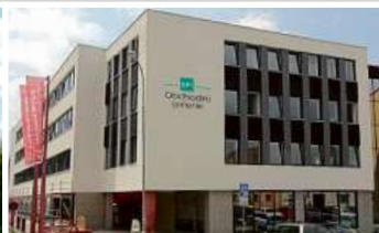
Obchodní galerie, Jihlava