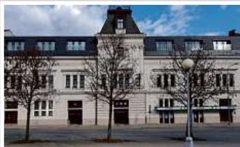
Multifunkční budova, Brno

Koncern e-Finance, a.s. v současnosti spravuje investice do nemovitostí v hodnotě přesahující 1 miliardu korun. Investiční strategií e-Finance je investovat prostředky získané z dluhopisů do nákupu a výstavby rezidenčních a komerčních nemovitostí v atraktivních lokalitách České republiky. Portfolio investic najdete na www.e-finance.eu .