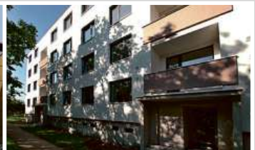
Bytový dům, Brno-Čhrlice