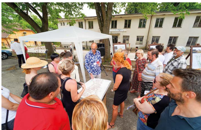
Zájemci se seznámili s plánem výstavby v lokalitě.

výdání řádné povolení k provádění údržbových prací. Stromy vhodné k ponechání byly dendrologicky ošetřeny odbornou firmou, rekultivované plochy byly zatravněny. Opravilo se a zprovoznilo veřejné osvětlení areálu. Areál je nově zabezpečen kamerovým