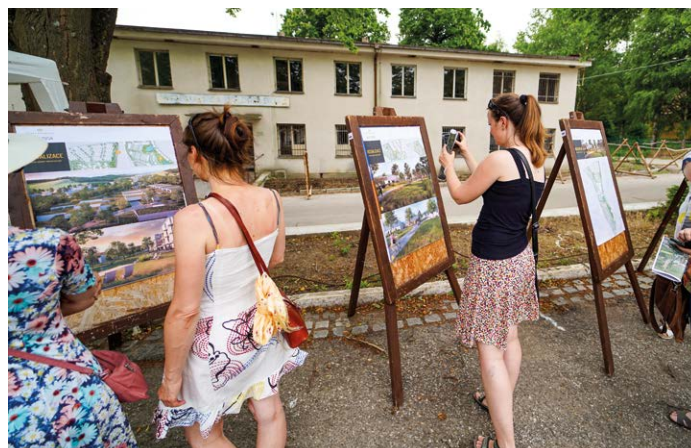
Návštěvnický zájem o vizualizaci nové městské čtvrti.