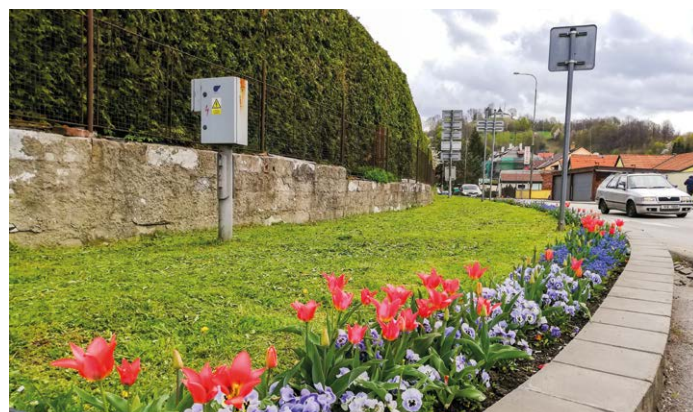
Záhony u silnice.

Veřejnost je vůči zásahům na stromech citlivá, což nevnímáme negativně, ale naopak jsme rádi, že tyto živé organismy a jejich osud není lidem lhostejný. Vitáme, když se občané zajímají, a vysvětlujeme postupy, důvody