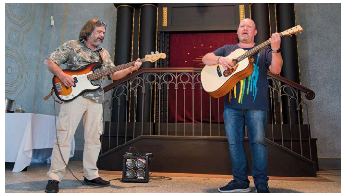
Členové skupiny Papouškovo sirotci zahráli na slavnostním večeru.