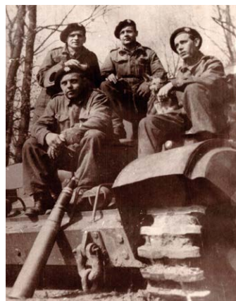
Posádka Cromwella Mk. VI D s maskotem při doplňování ostrého sířeliva.

Československá samostatná obrněná brigáda je připomenuta mnoha tématy, od plně zařízené polní kuchyně nebo dílny, přes ženistu a mo-