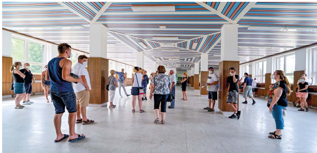
V rámci dne otevřených dveří mohli zájemci nahlédnout i do prostor gastrobloku.

V rámci zpřístupnění části je veřejnosti k dispozici i vnitřní parkoviště, které může být využíváno i jako nástupní parkoviště pro aktivity na území CHKO Blanský les i jako parkoviště pro nájemce prostorů v areálu bývalých kasáren.