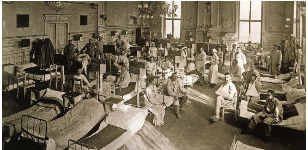
Lazaret v tanečním sále Nové hospody, dnešního městského divadla, 1915.

TRADICE Už roku 1750 vznikl výčep známý jako „Nová hospoda“ v budově, ve které dnes sídlí městské divadlo. Jádro tohoto domu je už ze 16. století a výrazně jej proměnila přestavba datovaná rokem 1877. Tehdy bylo přistavěno novorenesanční křídlo (směrem k dnešní Objížďkové), do něhož byl umístěn nový velkolepý taneční sál, který stávající hospodu rozšířil. Od počátku 20. století tu pak bylo provozováno kino a za první světové války se ve velkém sálu nacházel dočasný lazaret. V roce 1993 byla bývalá