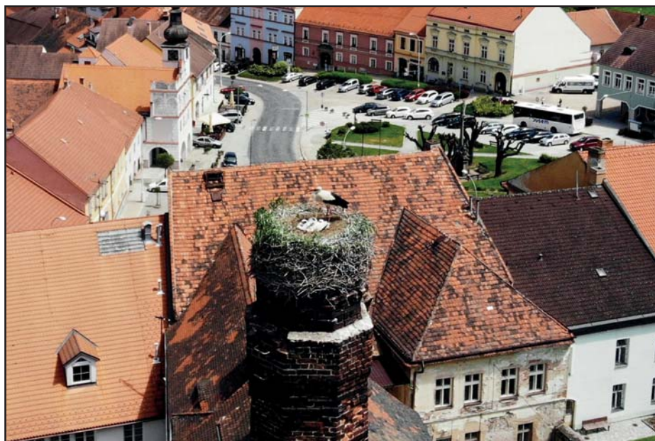
V sobotu 19.6.2021 proběhlo kroužkování čápů - letos mají dva mladé.

Poté bude zahájen sobotní večerní program v 19 hodin koncertem skupiny WDOVA A KUMPÁNI, na který bude navazovat vystoupení skupiny READY KIRKEN. Po skončení koncertů proběhne tradiční