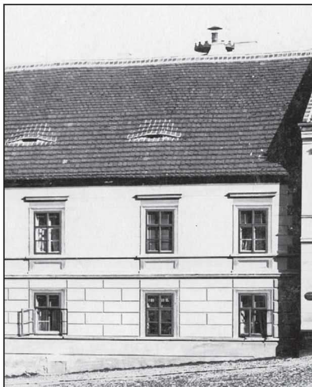
Pivovarský komín přecházející střechem panského domu, fotografie, kolem 1900.