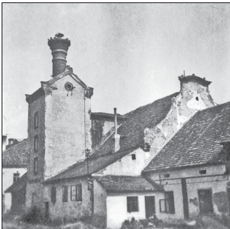
Pohled na někdejší pivovar ze dvora panského domu, fotografie, kolem 1955.