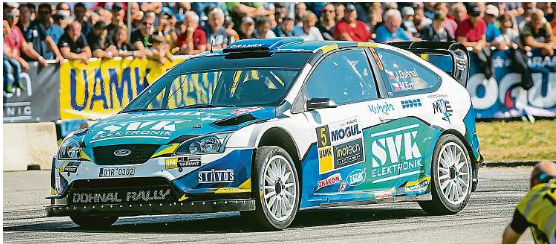
Divácká erzeta mezi pavilony budějovického výstaviště, to byla pro piloty i fanoušky velká atrakce. Pro podzimní odloženou soutěž by se do programu rallye mohla vrátit.