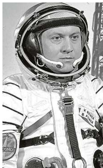
Vladimír Remek, jediný československý kosmonaut ve vesmíru.