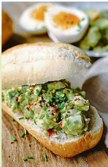
Vaječná pomazánka bez majonézy, zato s avokádem.

Postup: Uvařená vejce rozkrojíme napůl, vyjmežme žloutek a dáme ho do mixéru nebo kutru. Ke žloutkům přidáme oloupaná avokáda, citronovou šťávu, trochu soli a pepře. Vše rozmixujeme dohladka. Vaječné bílky nakrájíme na drobné kostičky, stejně tak papriku. Nakrájené bílky smícháme avokádovou směsí a přidáme nasekanou pažitku. Podle chuti pomazánku osolíme a opepříme. Servírujeme s pečivem, případně posypané chilli vločkami. Zdroj: coolinarka.cz