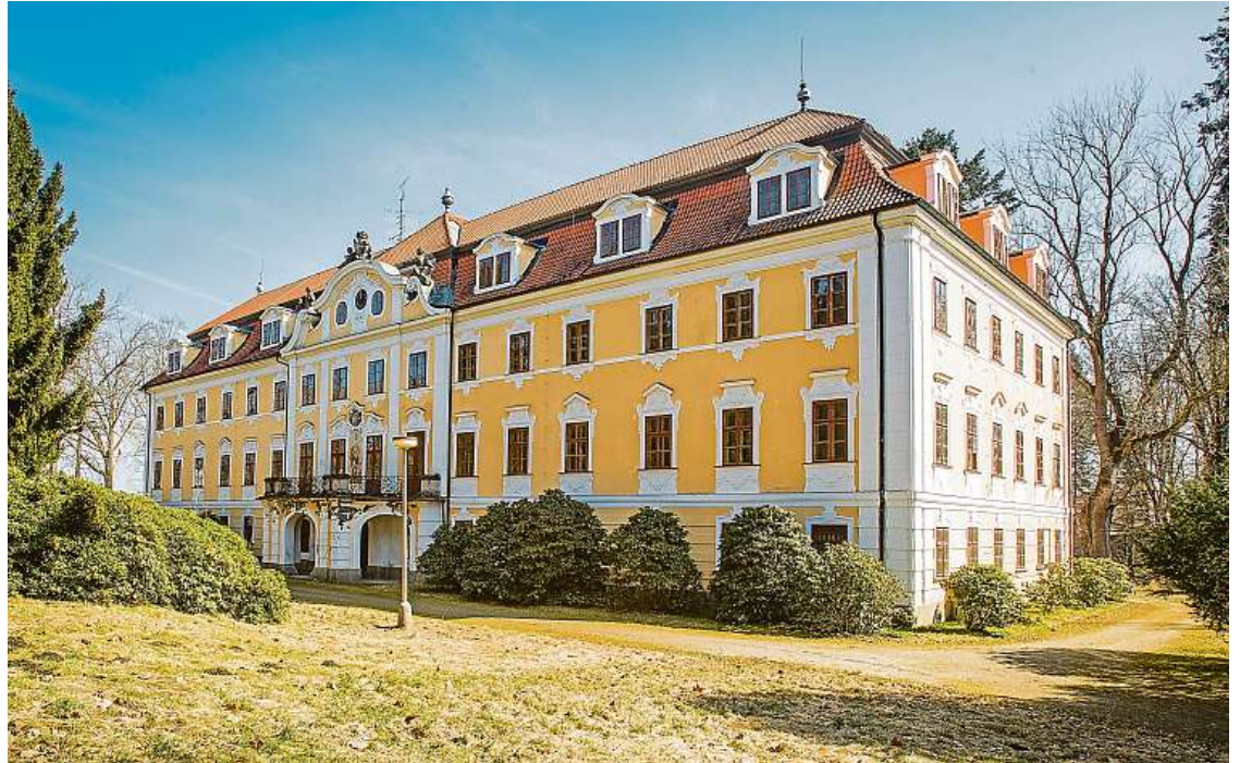
Zámek v Chlumu u Třeboně stojí v parku poblíž známého rybníka Hejtman.

Ještě před jeho příjezdem vznikla u přílehlého rybníka Hejtman zámecká plovárna. Právě ta se málem stala Benešovi osudnou. „V minulých dnech koupal se p. ministr na plovárně v jednom z tamějších rybníků, při čemž pojednou