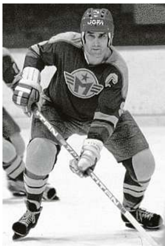
Legendární obránce Miroslav Dvořák zemřel v roce 2008.