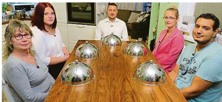
Soutěžící v pořadu Prostřeno! z Moravskoslezského kraje.

roláda: 5 velkých plátků h o v ě z í h o masa, 3 PL plnotučné hořčice, 2 klobásky, kousek bůčku, 2 sterilované okurky, 1 větší cibule, sůl, pepř, špetka mleté sladké papriky, 4 kuličky nového koření, bobkový list, sůl, pepř. Červené zelí: 1 hlávka červeného zelí, 2 větší cibule, 1 PL hladké mouky, olej, ocet, cukr, sůl, pepř. Kluski: 1 kg uvařených brambor, bramborový škrob, 1 žloutek. Postup: Hovězí maso rozklepeme na tenké plátky. Posypeme solí a pepřem, namažeme plnotučnou hořčicí. Na kraj plátku položíme nakrájené na proužky okurky, bůček a klobásu. Posypeme nejmenno nakrájenou cibulkou.