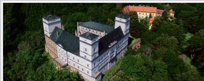
Zastavovaný areál zámku Račice v rámci dluhopisového programu e-Finance CZ v celkové hodnotě uveřejněné na adrese www.e-finance.eu/zajistene-dluhopisy .

Dluhopisy jsou zajištěné zástavním právem na celém exkluzivním areálu zámku Račice čítající pozemky o výměře přes 50 000 m 2 , nemovitosti a samotný zámek Račice.