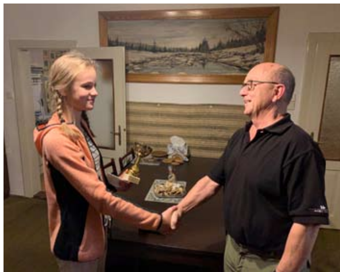
Předání poháru letos proběhlo v rámci oddílu