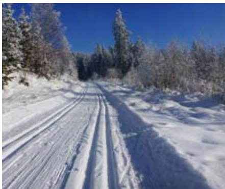
Upravená bílá stopa

Už je to opravdu pár zimních období, kdy jsme čekali na přísun sněhu umožňujícího i najetí běžeckých stop hned u města- na Vodárně, případně i poblíž okruhu kolem Ždánova. A tuto zimu jsme se přeci jenom dočkali. Snad nám to i přes, v době psaní příspěvku blížící se teplou frontu, ještě dost dlouho vydrží. Jak je milé i pro lidi jako já, když se na oblíbené běžky dostanou bez cestování na centrální oblast Šumavy (Modravu a Kvildu) na profesionálně najetou dvoustupu s přívětivým terénním profilem. A najdou tu vyžití i náročnější „bruslaři“ s okruhem kolem Hadí skalky. Rozhodně tento počín