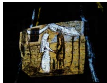
Popelka nazaretská

až do samého konce, přičemž představení samotné trvalo 45 min. Hradní občerstvení skýtalo možnost dát si leccos teplého na zahřátí. Lesní úsek z parkoviště byl osvětlen a díky Technickým službám povrch řádně posypán, protože sníh tou dobou ležel výhradně v našich horních polohách. Skvělou atmosféru