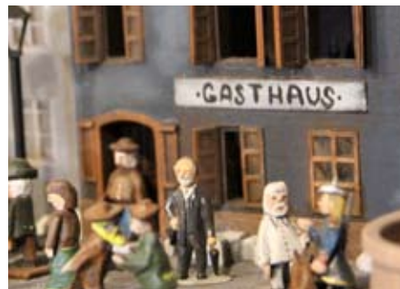
Karel Klostermann