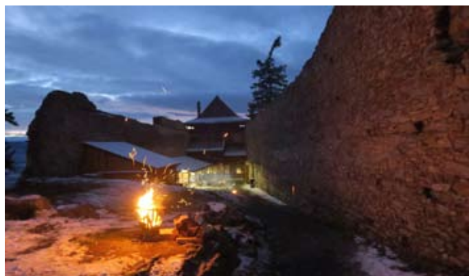
Jedinečná atmosféra na hradním nádvoří