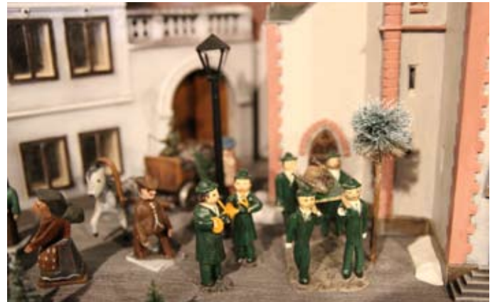
Hubertská mše