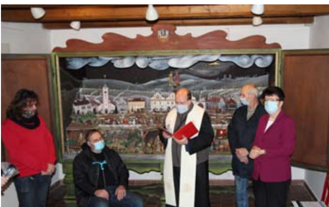
Hosté slavnostního rozšíření betléma