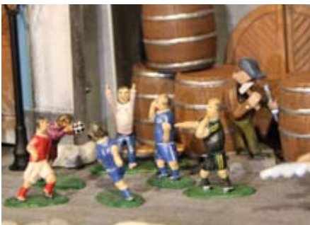
Skupina fotbalistů