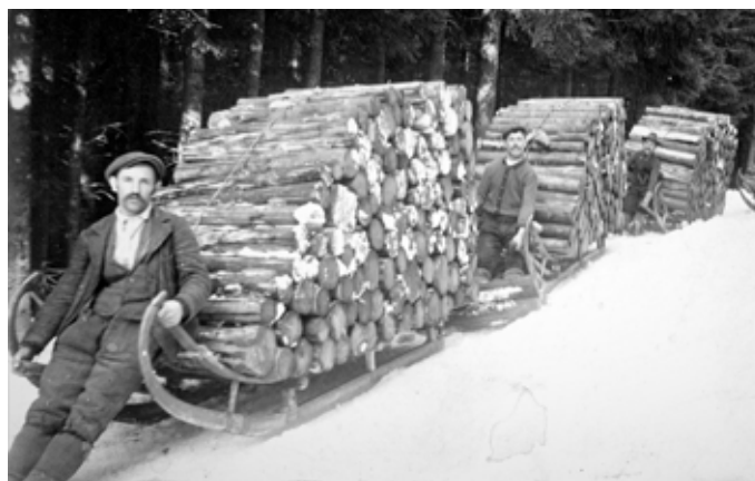
Sáňkování dřeva na Šumavě