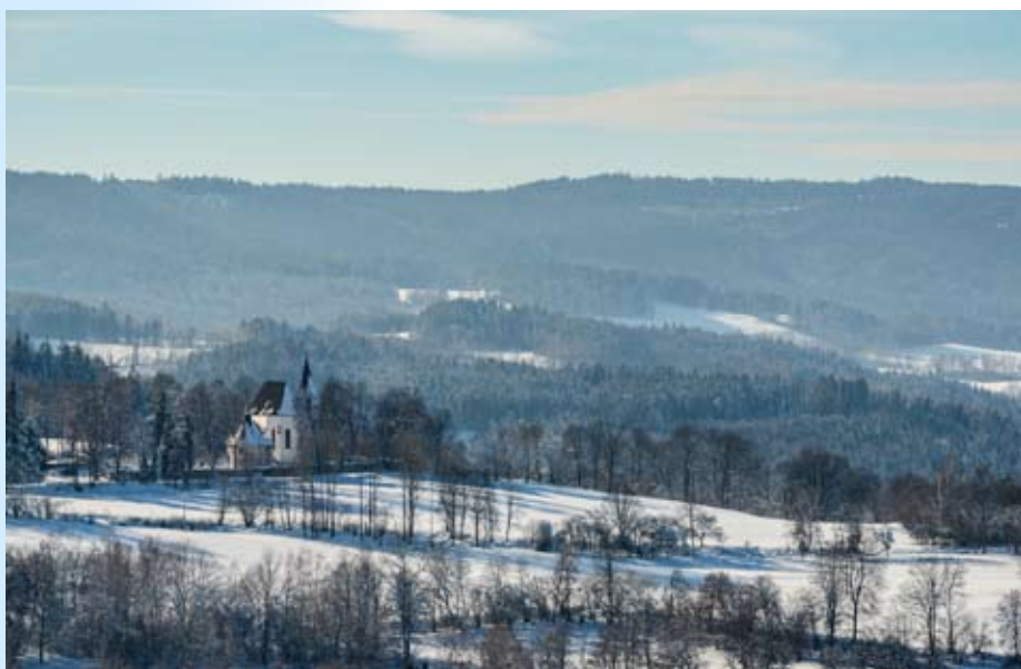
Kašperské Hory mají třetí největší obecní lesy v republice

Kašperské Hory nedostaly miliony za kůrovce, lesy leží v národním parku.