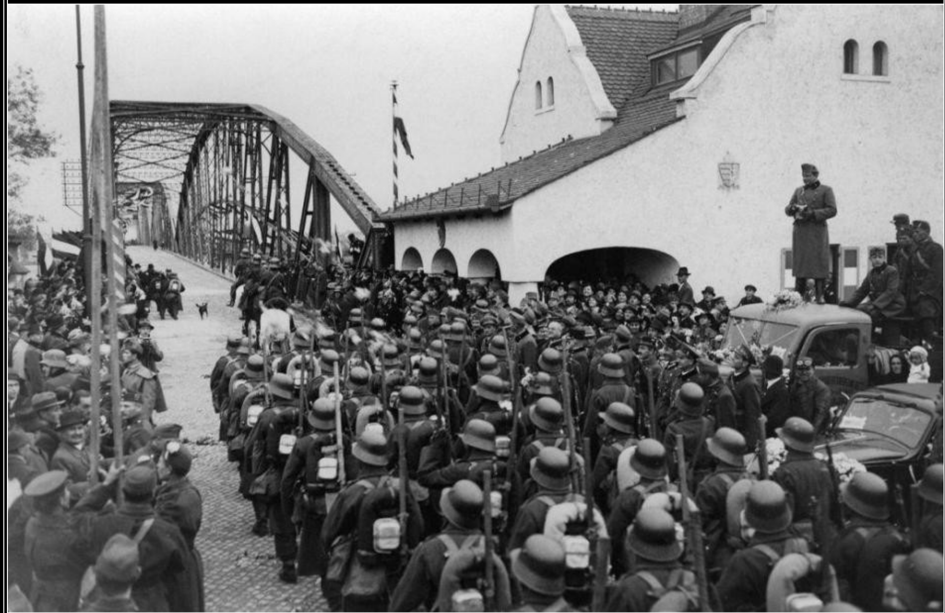
Jednotky maďarské armády obsazují Komárno na Slovensku - říjen 1938.