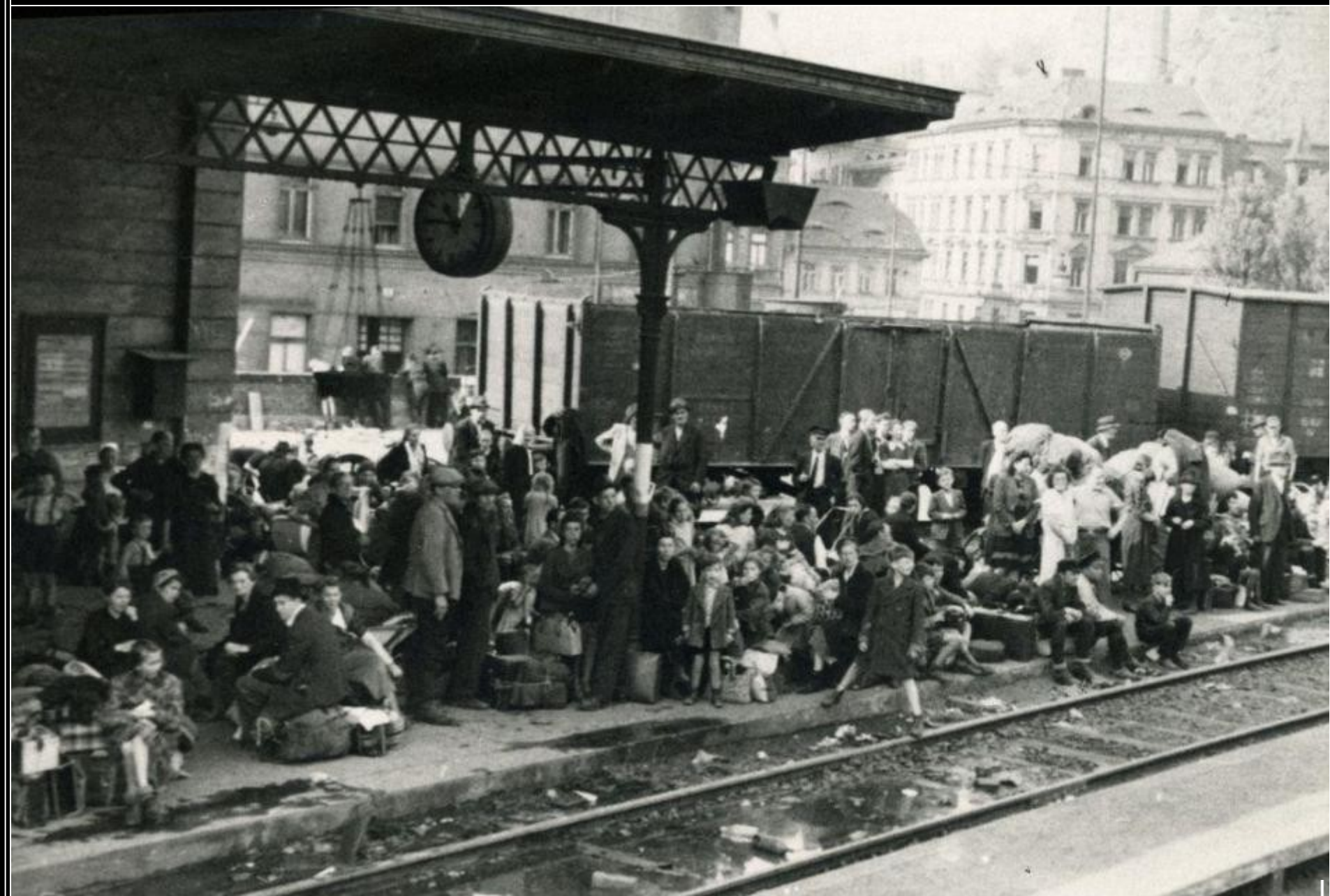
Čeští uprchlíci z hitlerovci obsazeného pohraničí. Praha - říjen 1938.