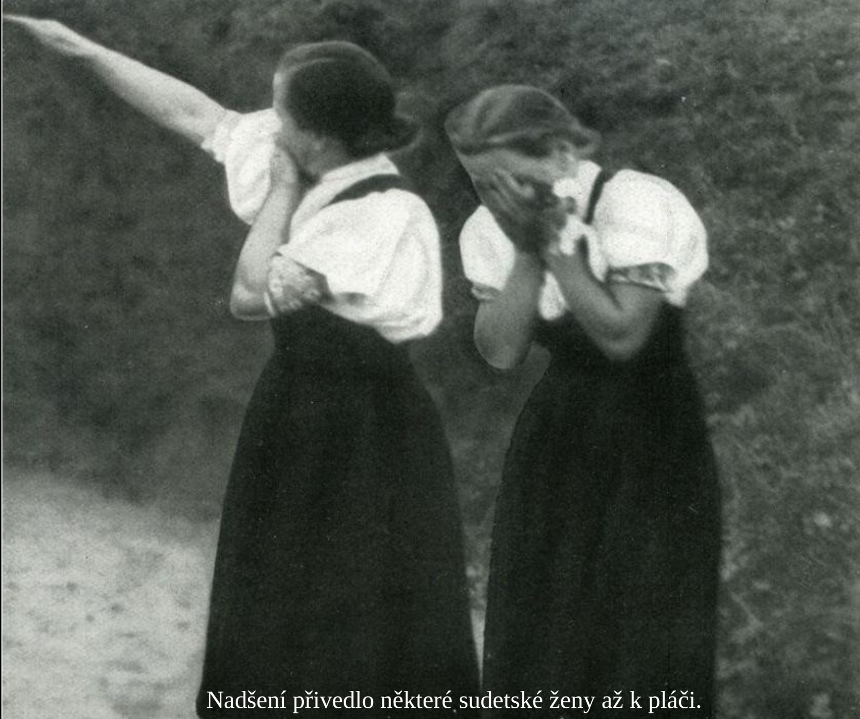
Nadšení přivedlo některé sudetské ženy až k pláči.