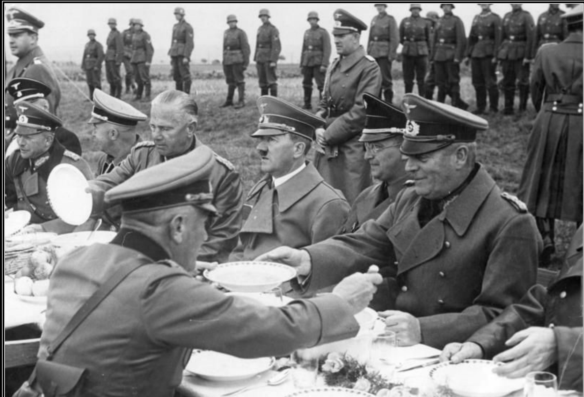
Adolf Hitler ve společnosti německých generálů a Konrada Henleina obědvá nedaleko Františkových Lázní - 3. října 1938.