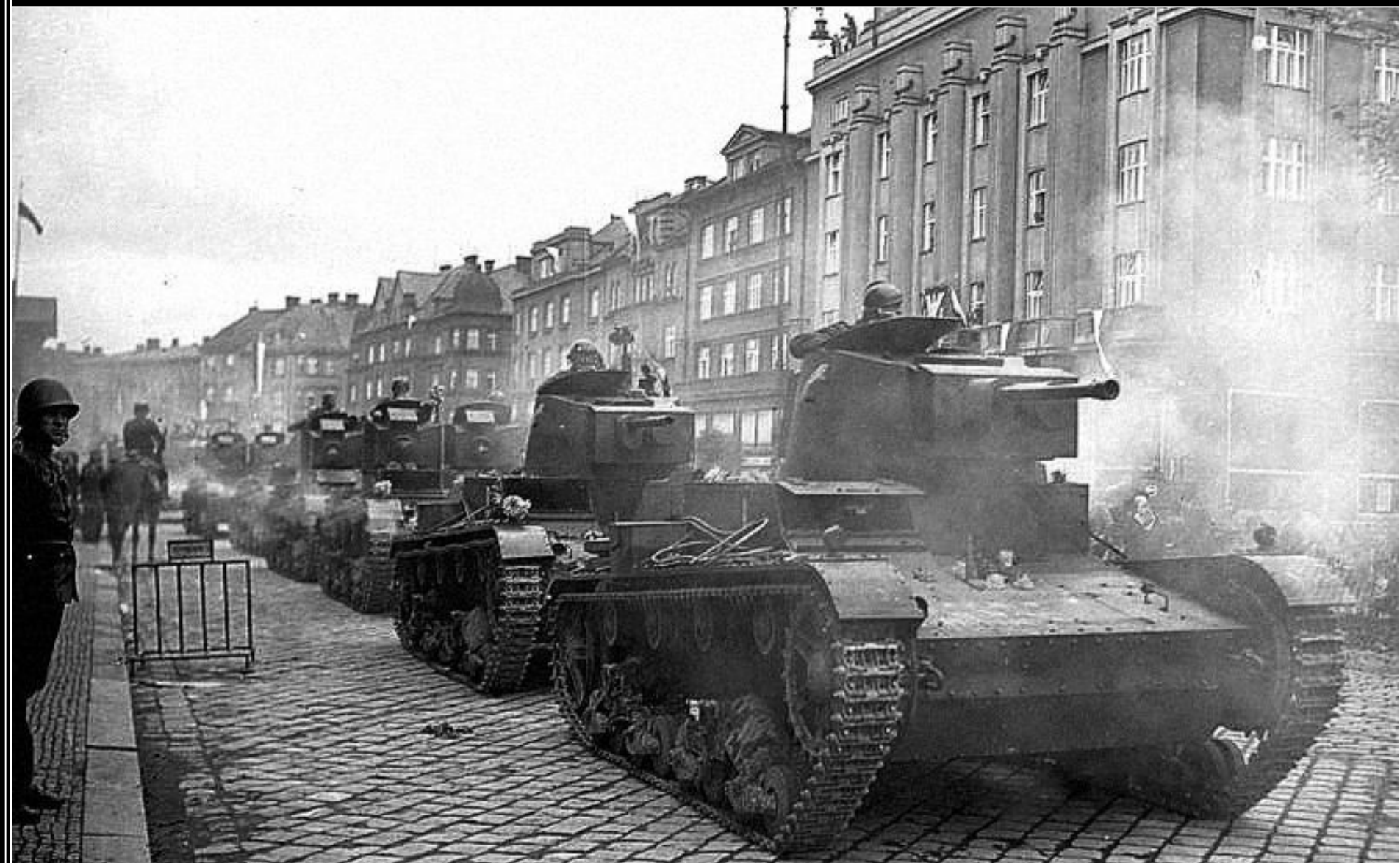
Polská armáda obsazuje po Mnichovu Zaolzie (česky Zálží či Zálší), východní díl české části Těšínska, kde převažovalo obyvatelstvo hlásící se k polské národnosti.