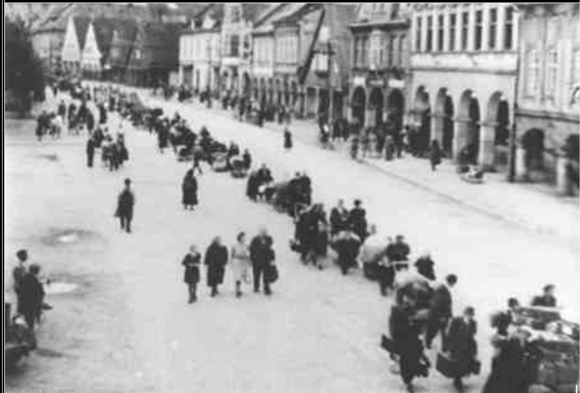
1945 odsun Sudetských Němců z Vrchlaví.