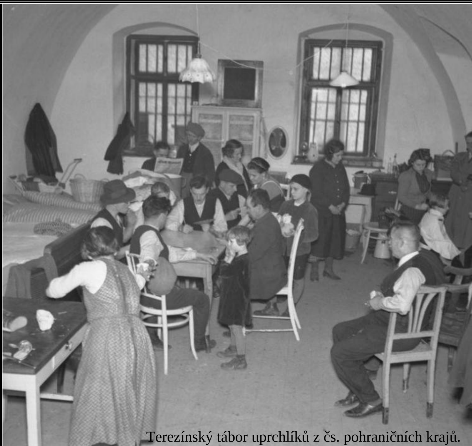
Terezínský tábor uprchlíků z čs. pohraničních krajů.