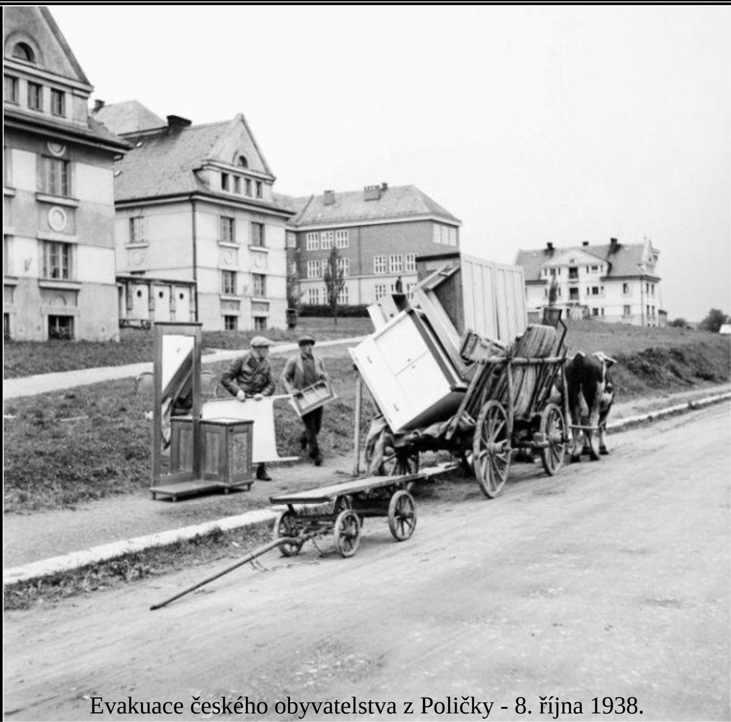
Evakuace českého obyvatelstva z Poličky - 8. října 1938.