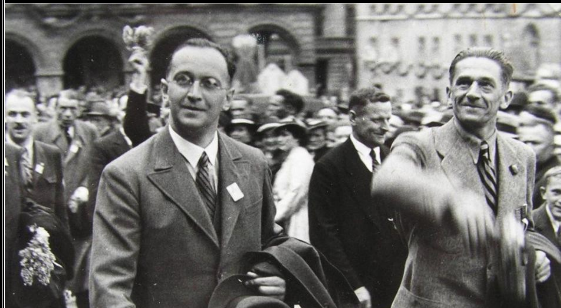
Konrad Henlein (vlevo) a sudetoněmecký radikál Karl Hermann Frank (1898-1946) patřili mezi hlavní nositele "pochodně nacismu" v příhraničních oblastech Československa sousedících s nacistickým Německem.