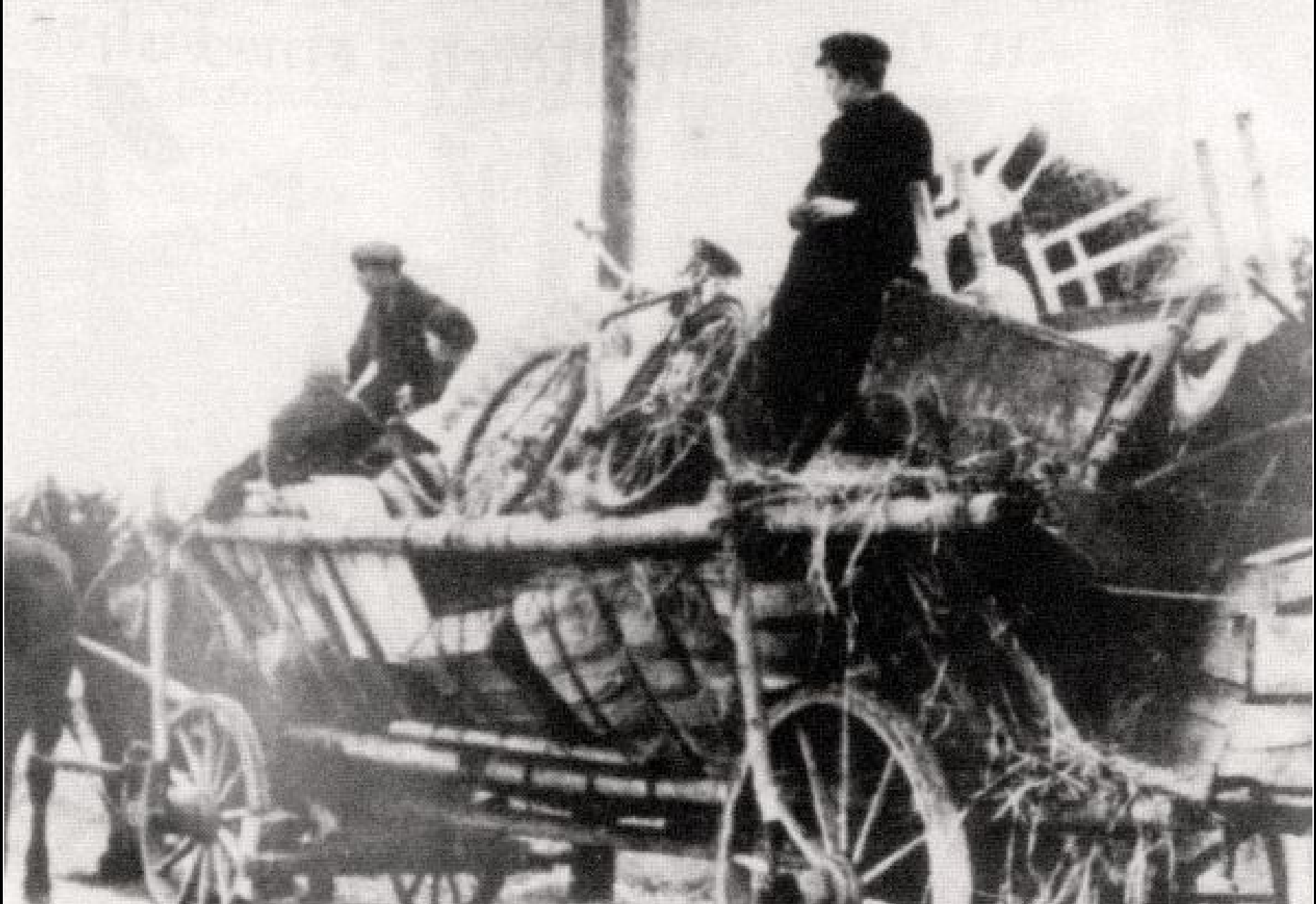
Čeští uprchlíci ze zabraného pohraničí na Břeclavsku si odvázejí majetek na žebřiňácích, rovněž říjen 1938.