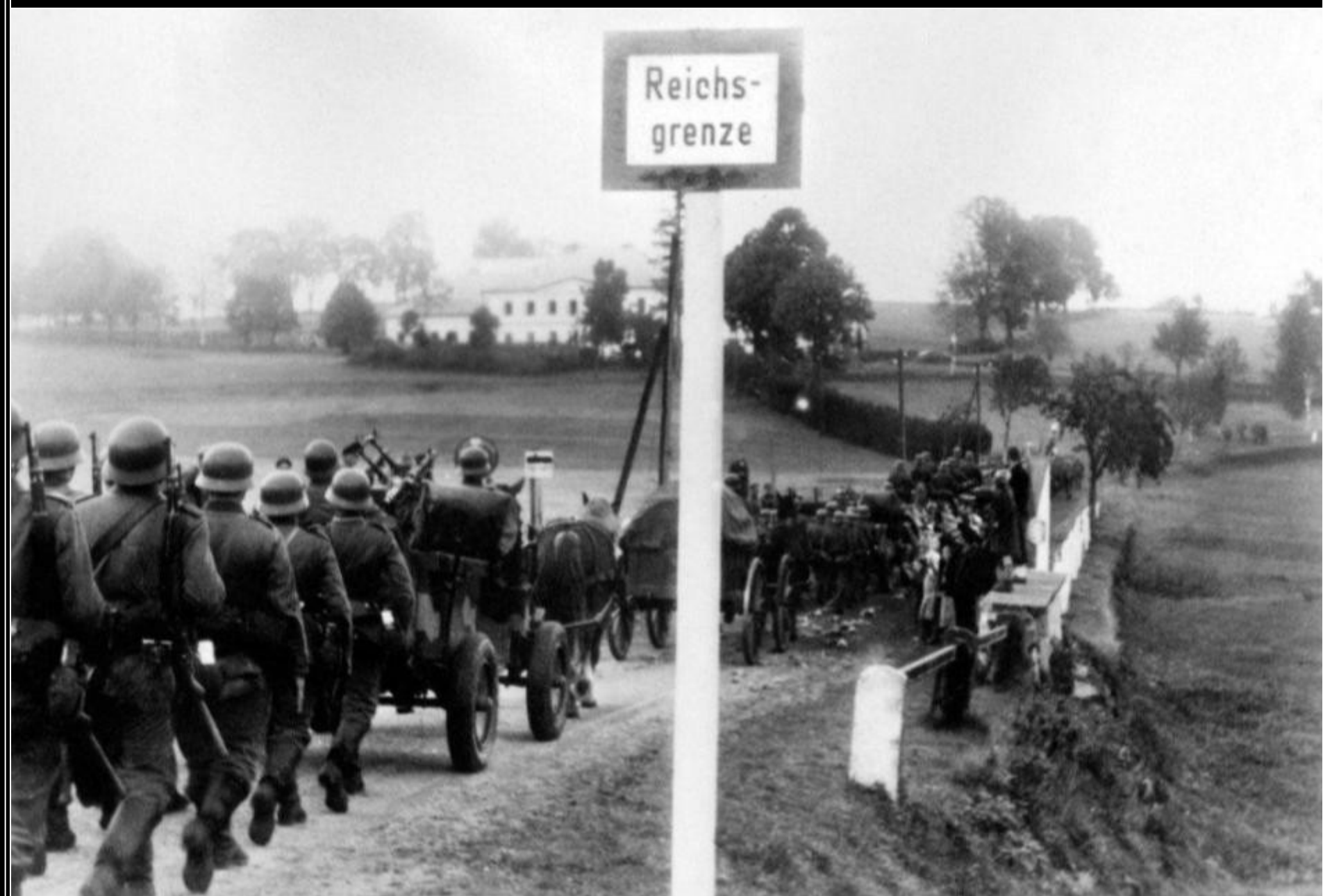
1. října 1938: nacistický wehrmacht obsazuje po mnichovské smlouvě československé pohraničí.