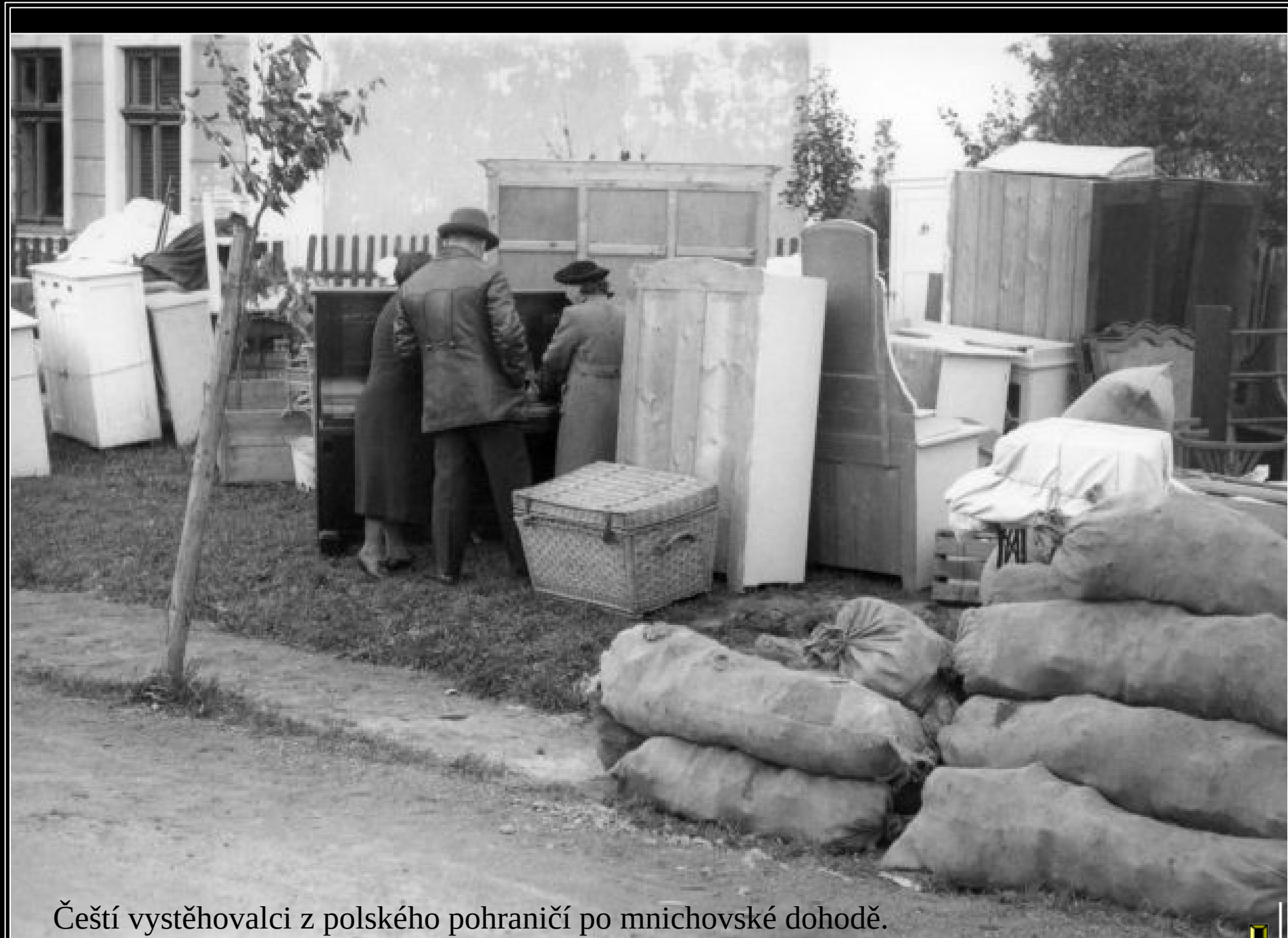
Čeští vystěhovalci z polského pohraničí po mnichovské dohodě.