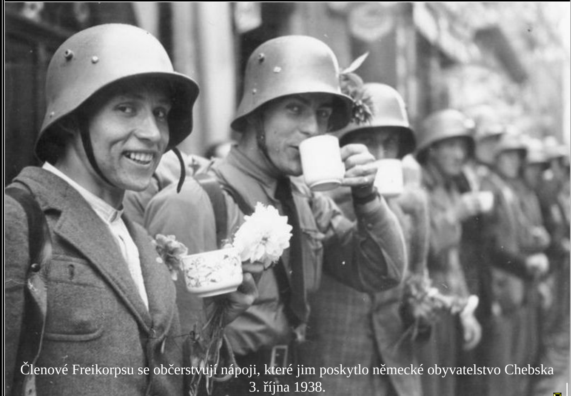
Členové Freikorpsu se občerstvují nápoji, které jim poskytlo německé obyvatelstvo Chebska 3. října 1938.