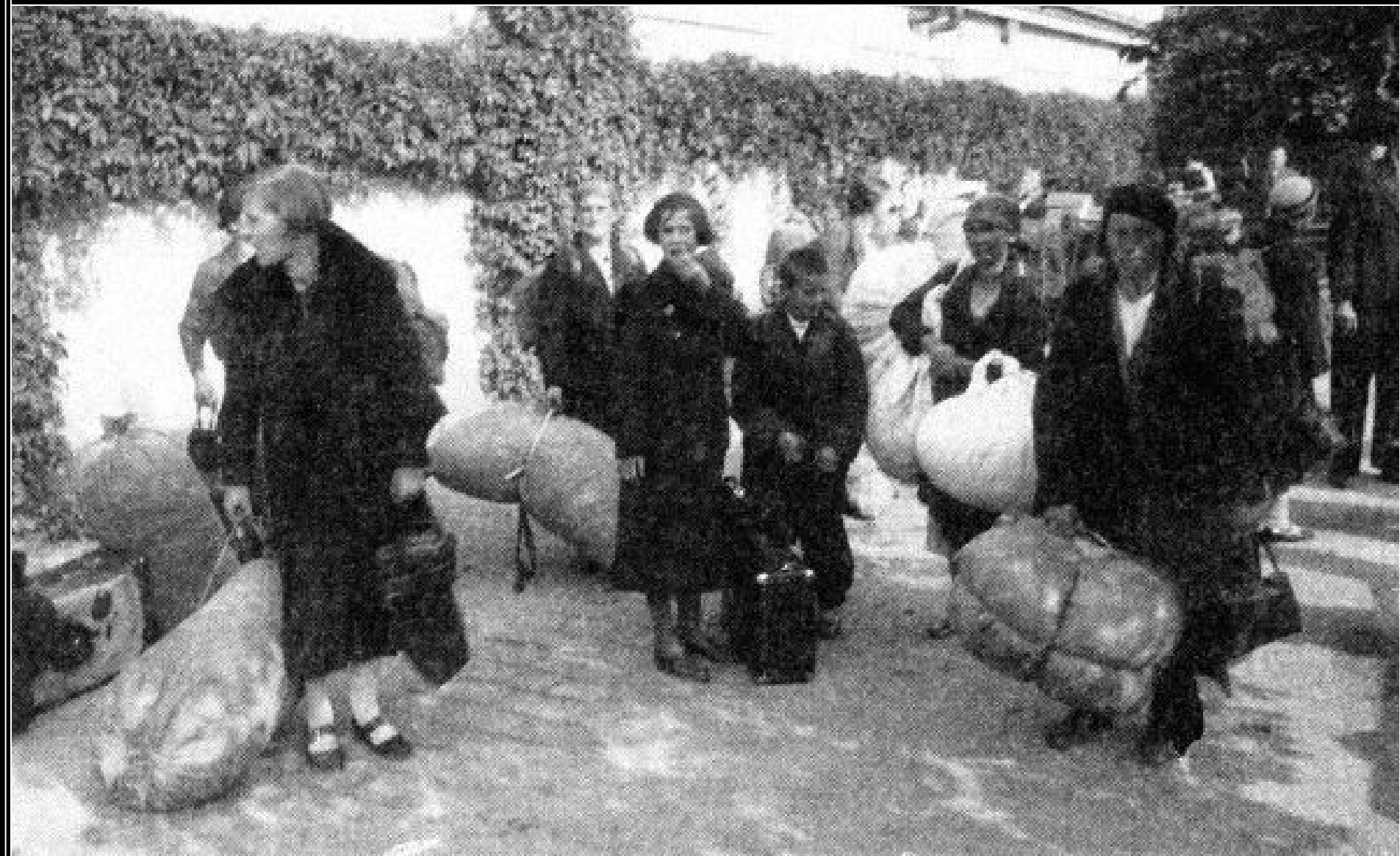
Češi vyhnaní z pohraničí hledají nový domov - říjen 1938.