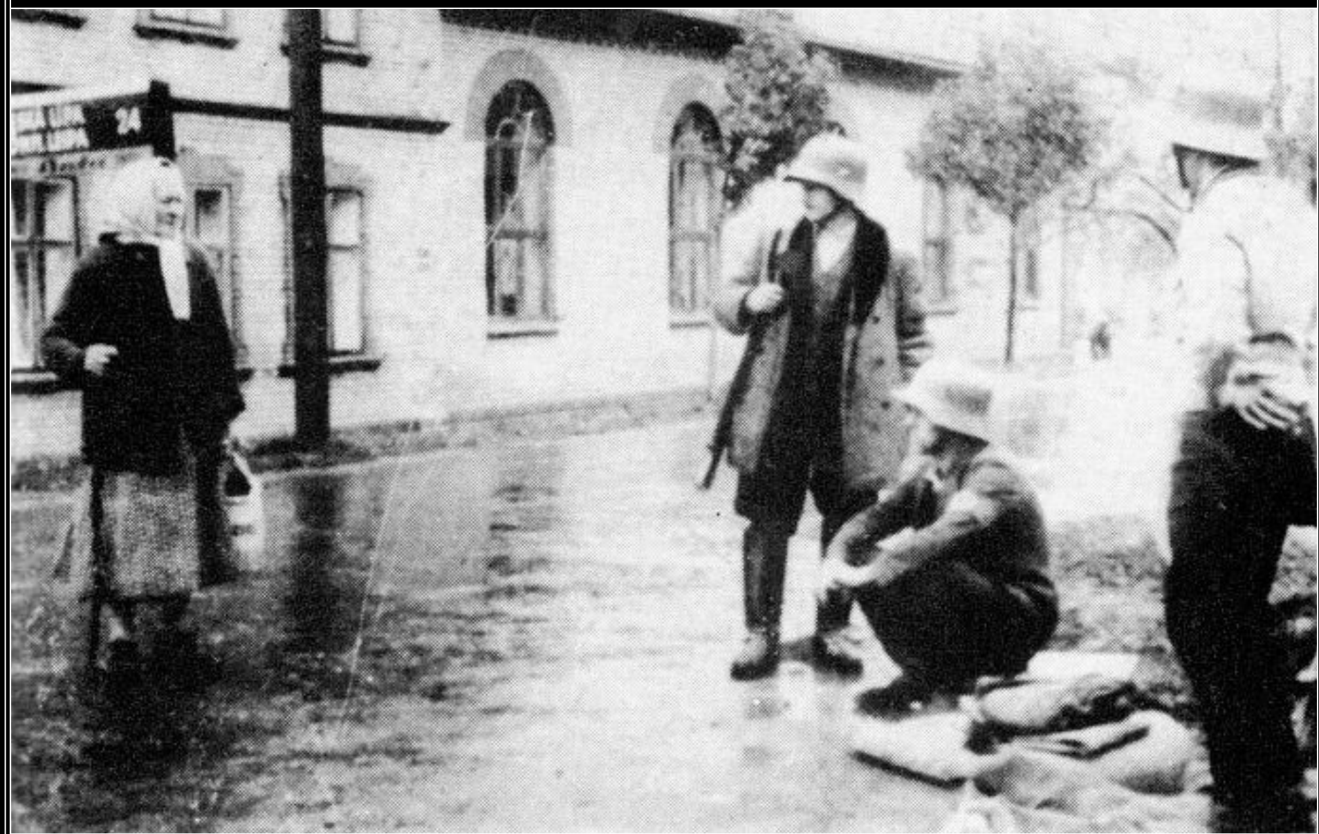
Sudetoněmecký Freikorps nedaleko České Lípy, rok 1938.