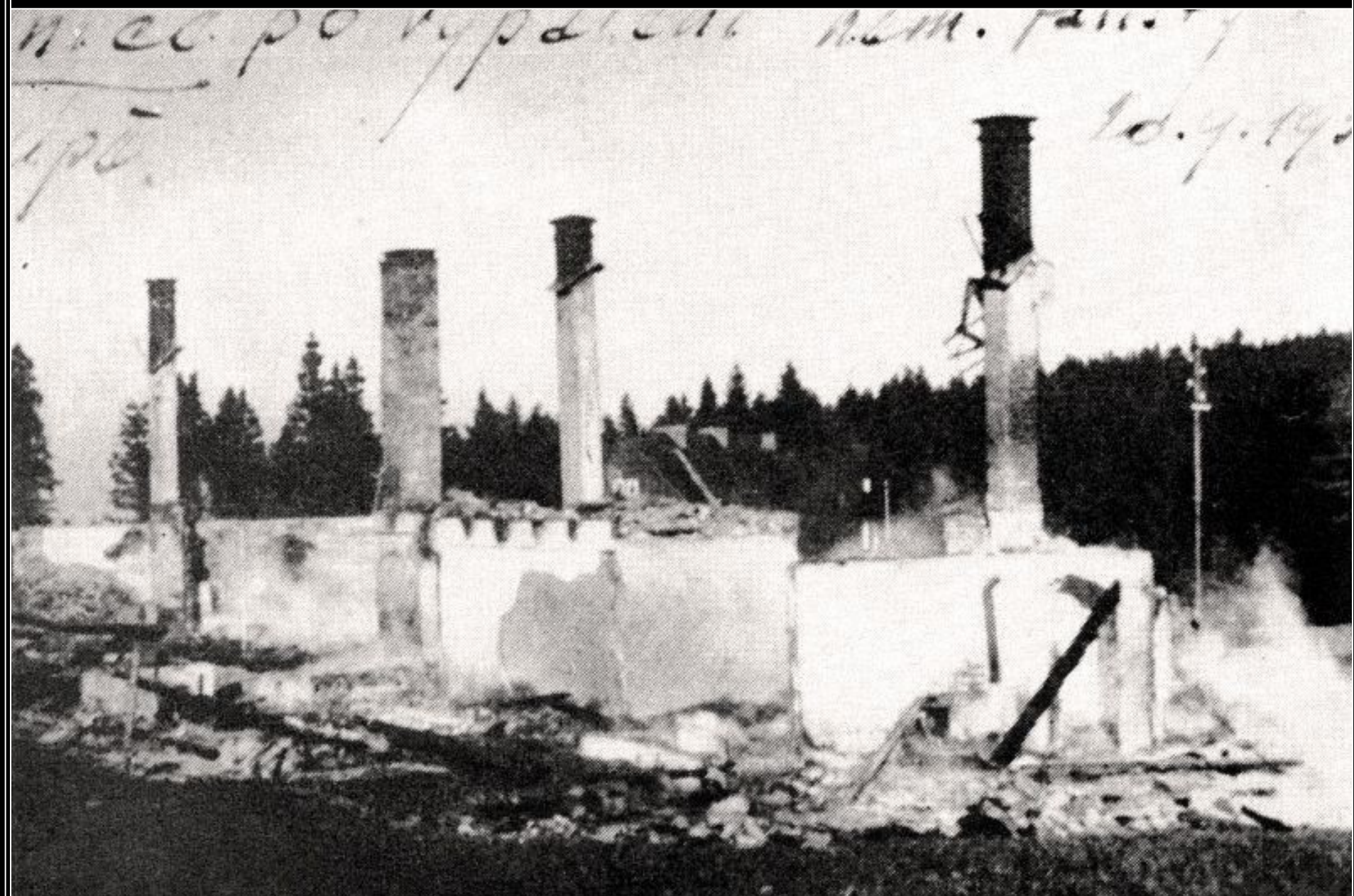
Trosky zničené celnice v Horní Malé Úpě po útoku sudetoněmeckého Freikorpsu v roce 1938.