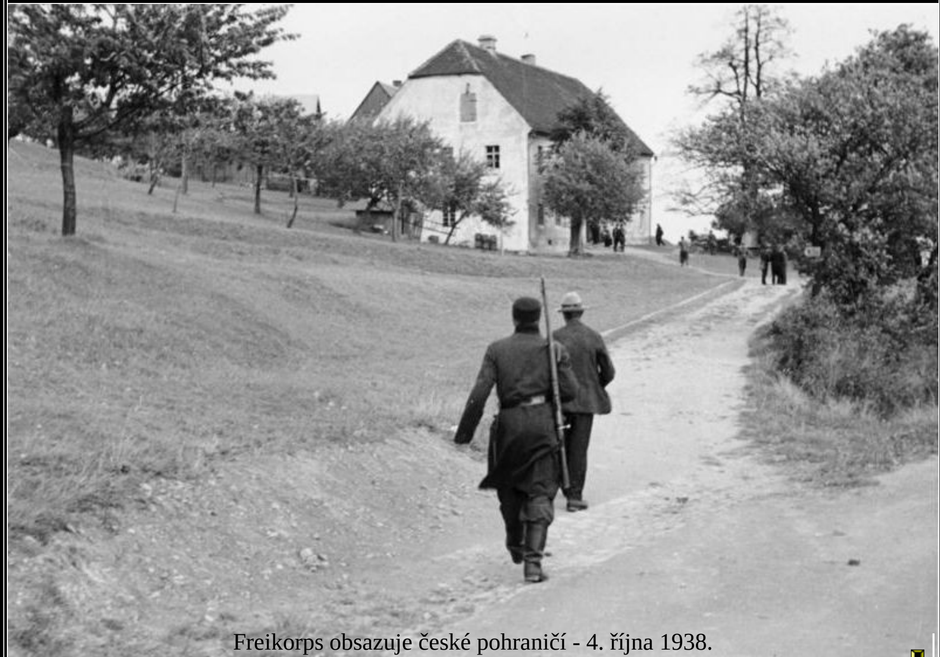
Freikorps obsazuje české pohraničí - 4. října 1938.