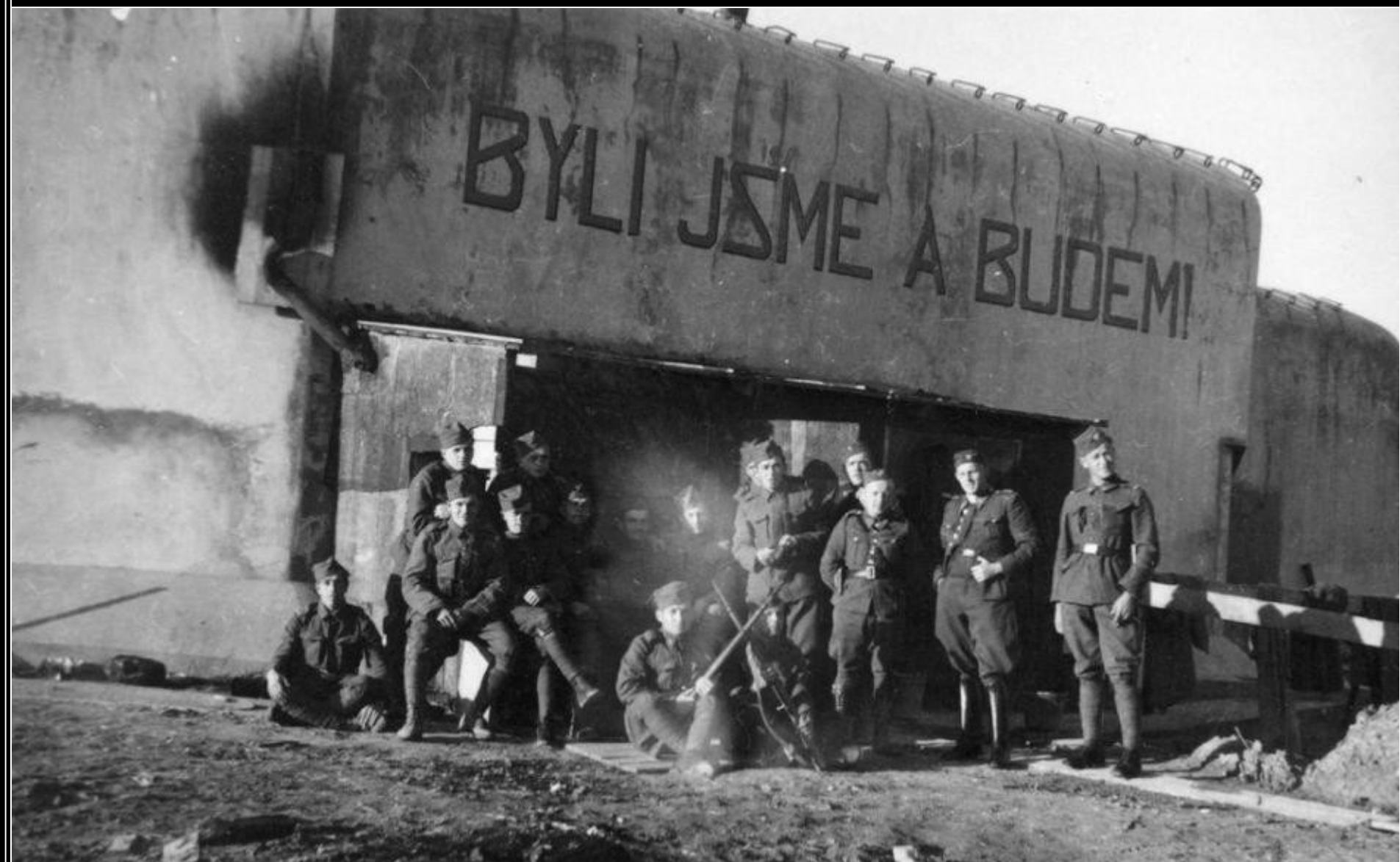
Posádka při mobilizaci čs. bunkru K-S 14 "Cihelna" v Králíkách. Na oboustranném pěchotním srubu byl nápis "Byli jsme a budem!".