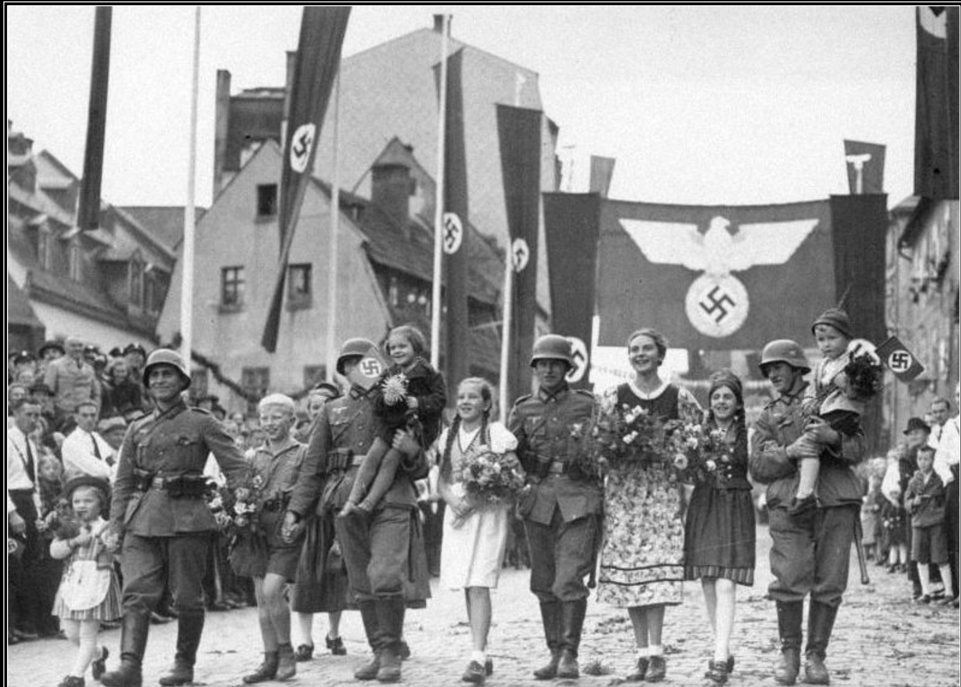
Propagandisticky pojatý snímek průvodu jednotek wehrmachtu, který vstoupil do Aše - 3. října 1938.