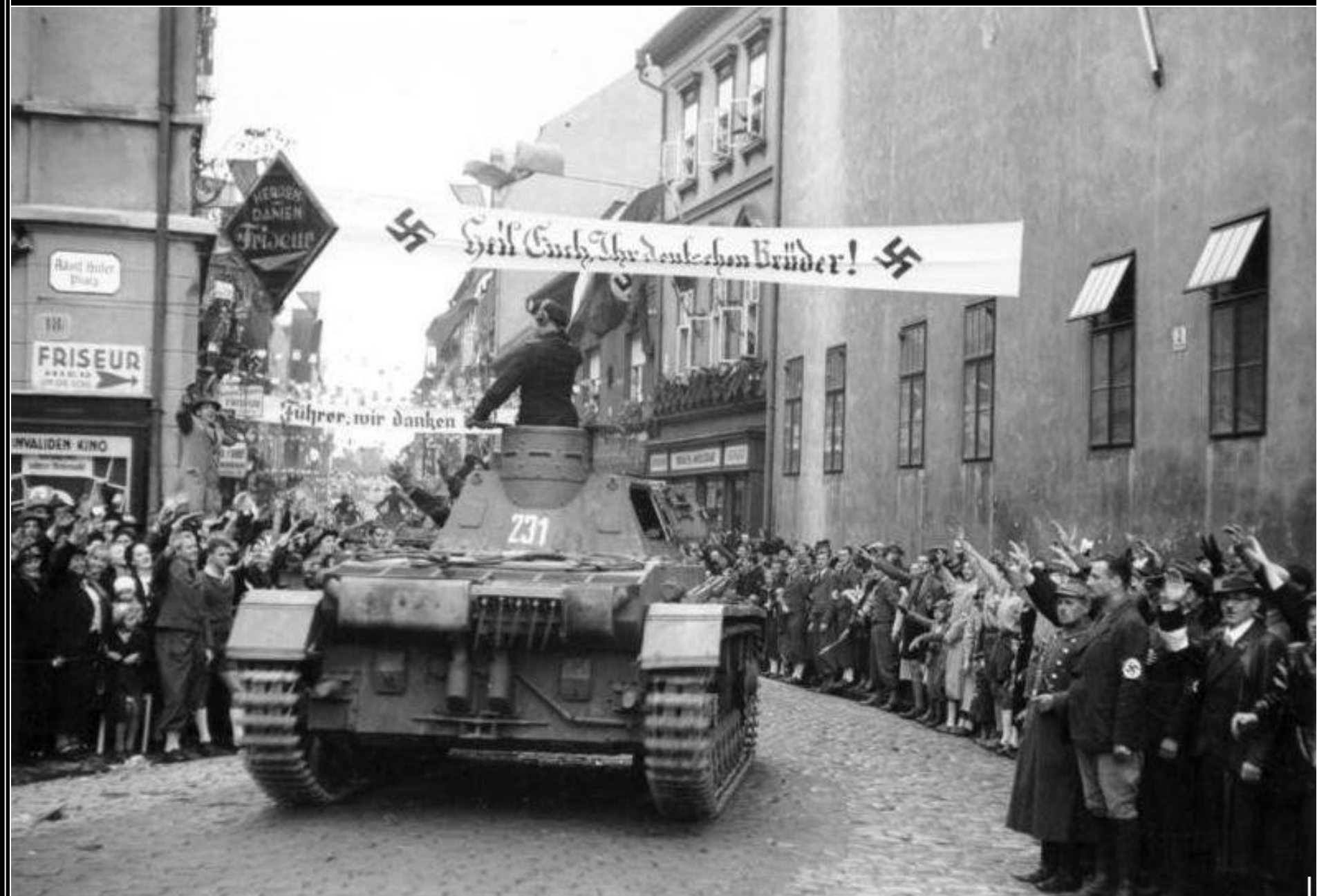
Oslavný průjezd těžkých tanků wehrmachtu v Chomutově - 9. říjen 1938.