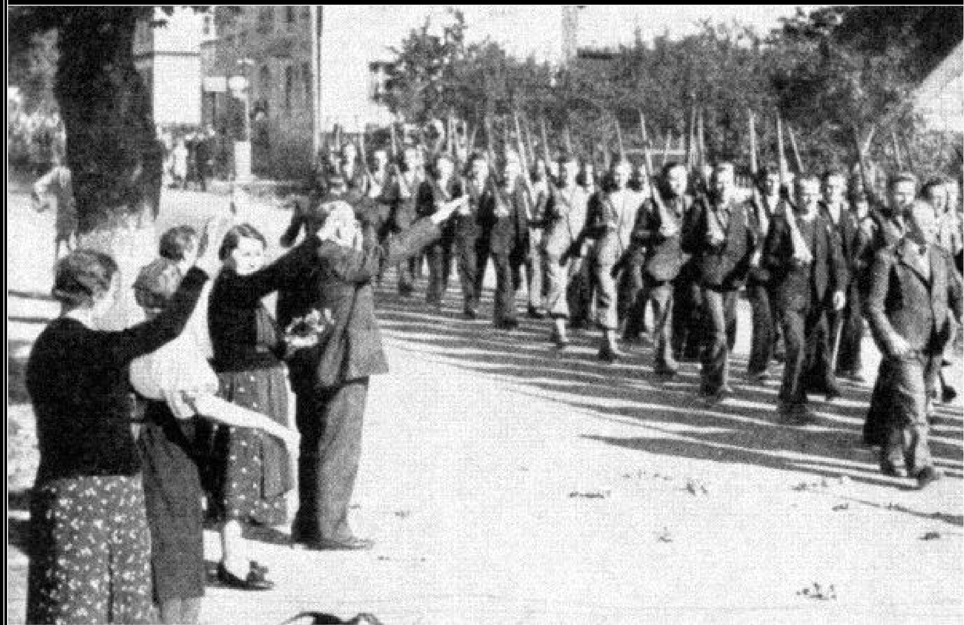
Defilující jednotky sudetoněmeckého Freikorpsu v roce 1938.