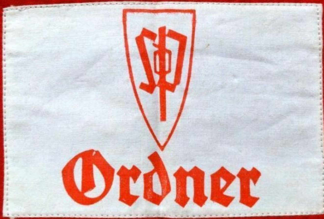
Německá rukávová páska pro úderné oddíly SdP s nápisem Ordner.