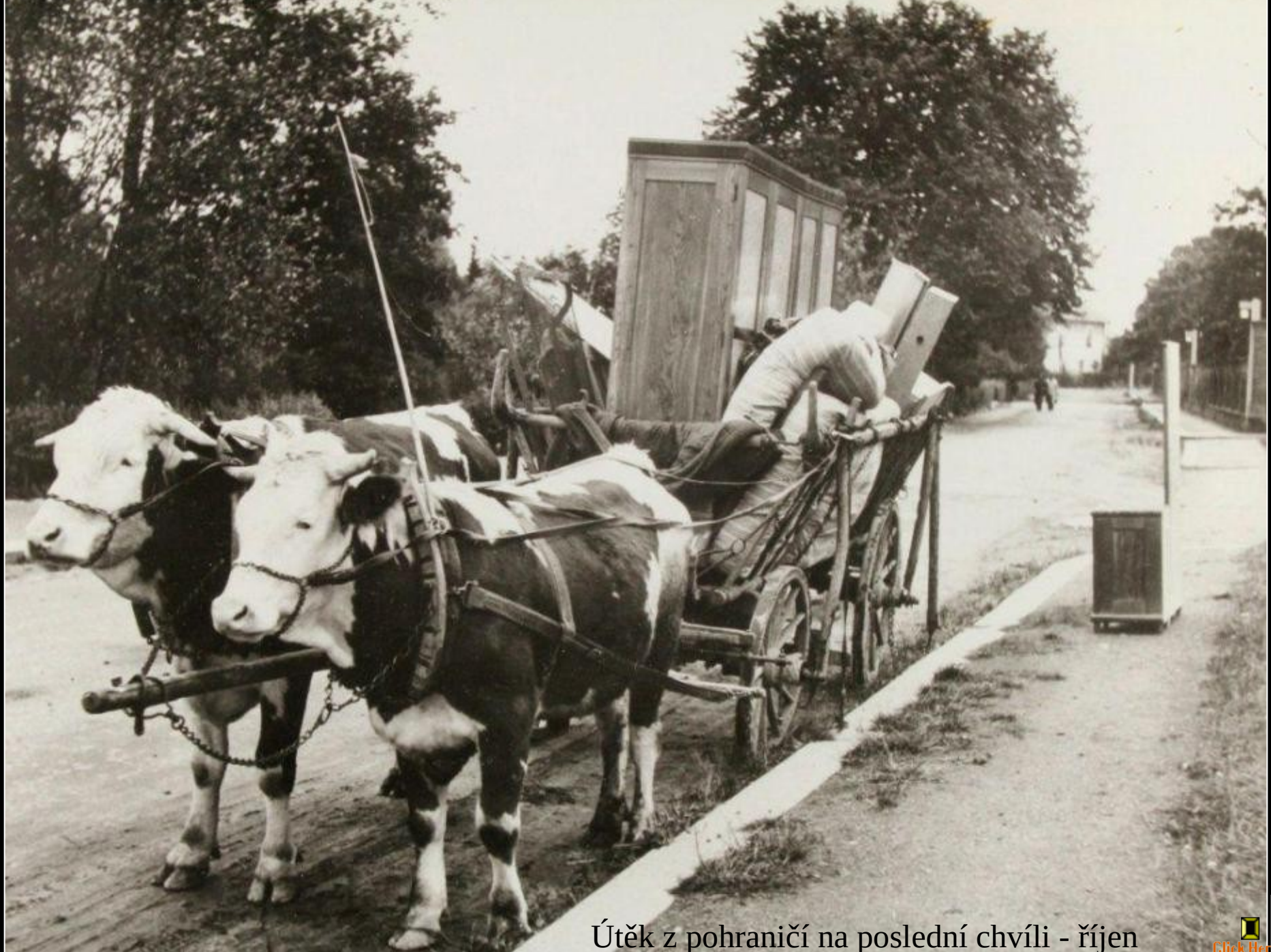
Útěk z pohraničí na poslední chvíli - říjen