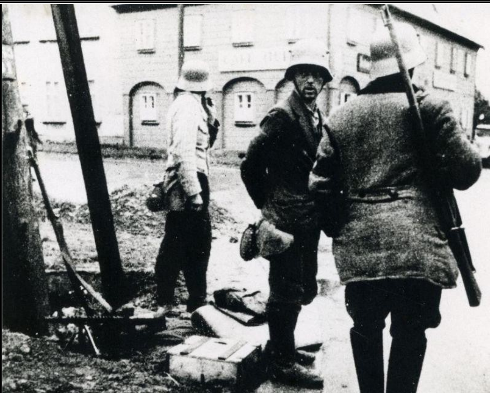
Hlídka ordnerů ve Varnsdorfu. V tomto severočeském městě došlo k přepadení pobočky Čs. národní banky a uloupení 18 milionů Kčs.