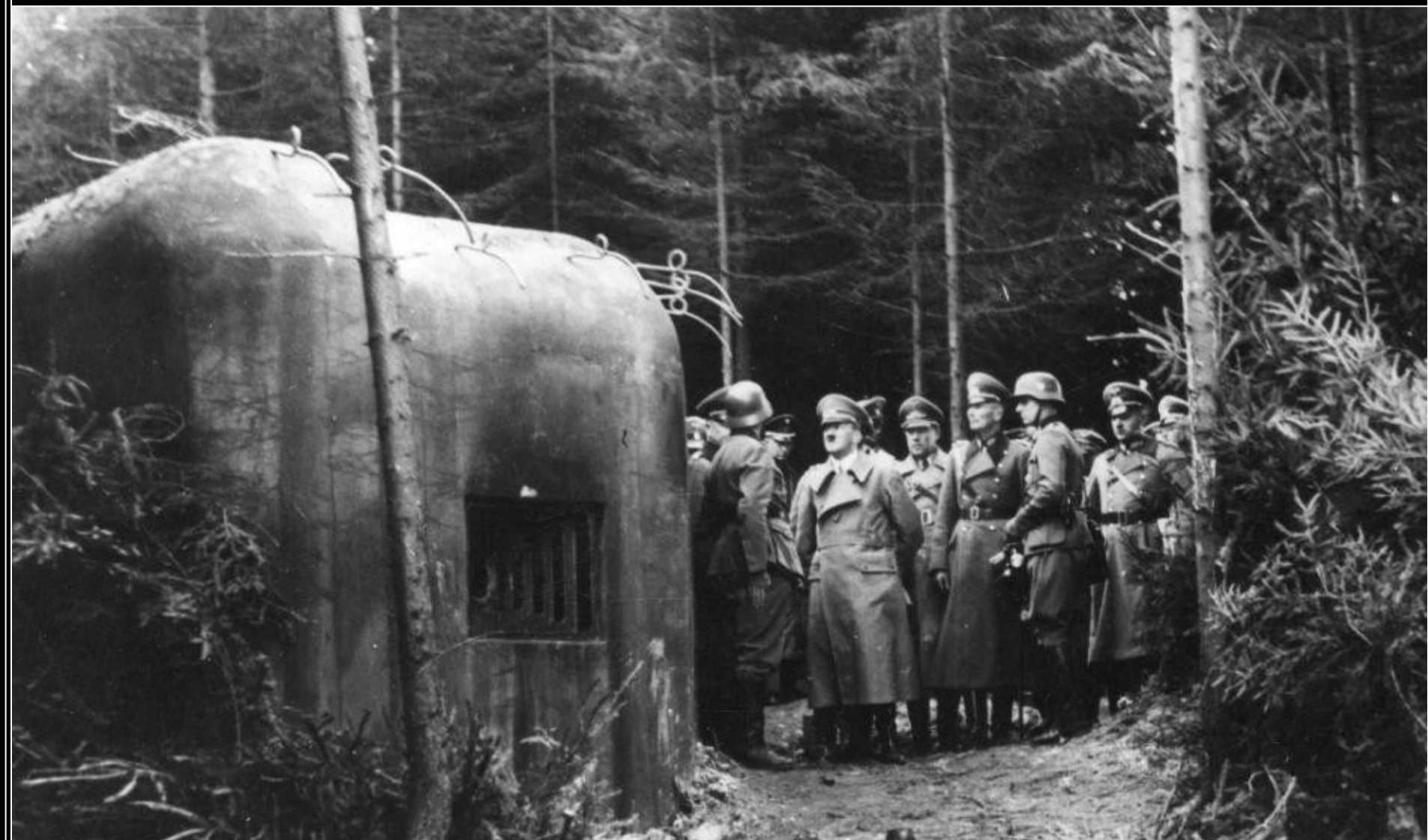
Vůdce nacistického Německa Adolf Hitler se s doprovodem seznamuje s obrannými objekty "československé Maginotovy linie". Zde je zachycen při prohlídce bunkru č. 30/N1/-180Z. 7. října 1938.