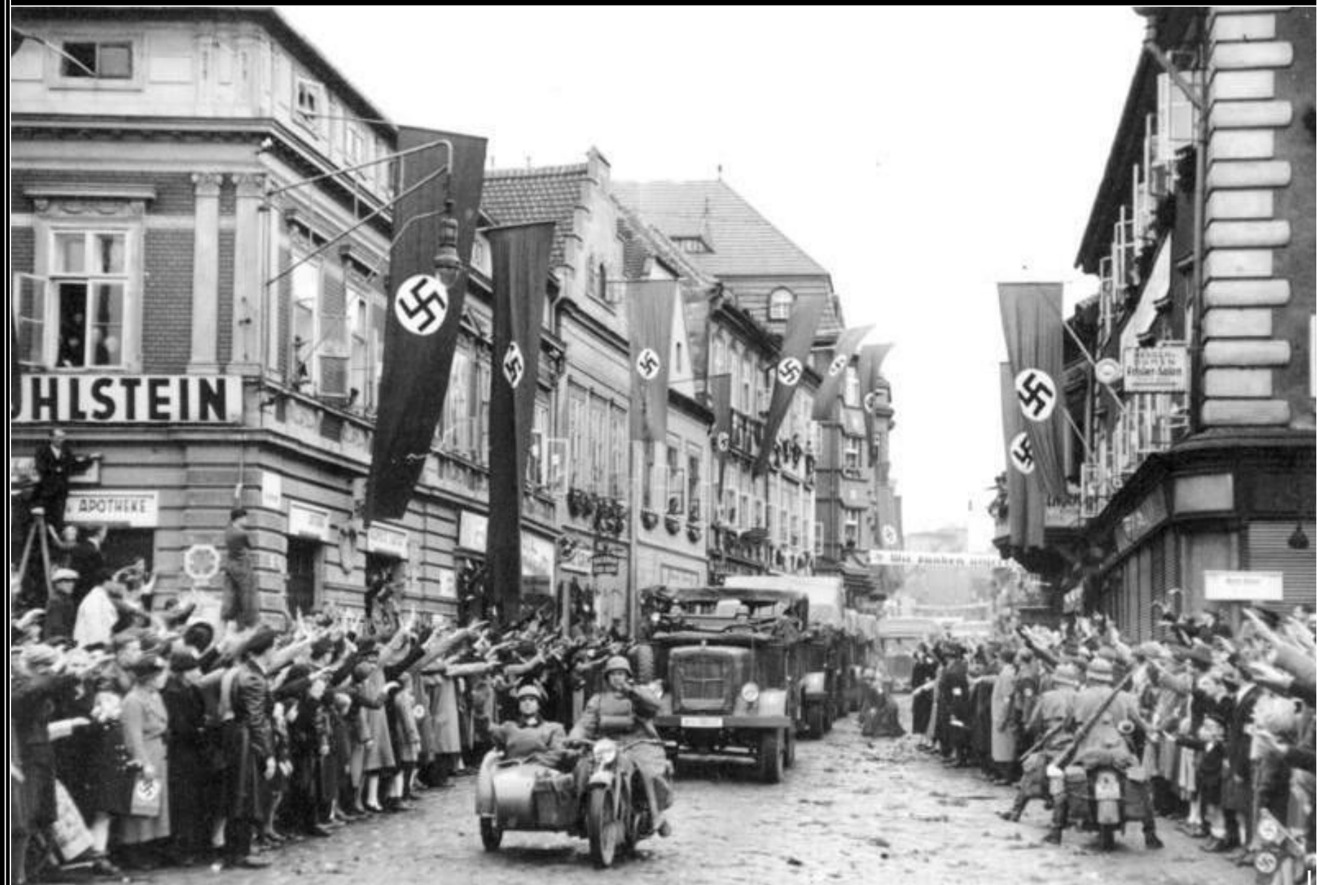
Wehrmacht při průjezdu Žatcem - 9. října