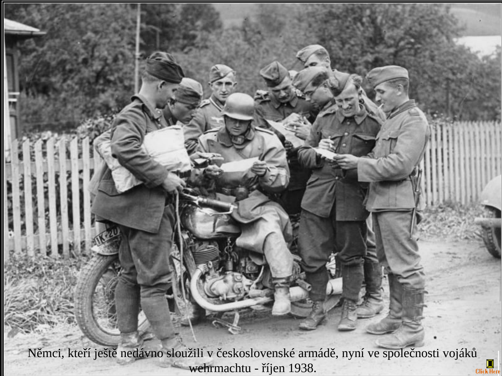
Němci, kteří ještě nedávno sloužili v československé armádě, nyní ve společnosti vojáků wehrmachtu - říjen 1938.