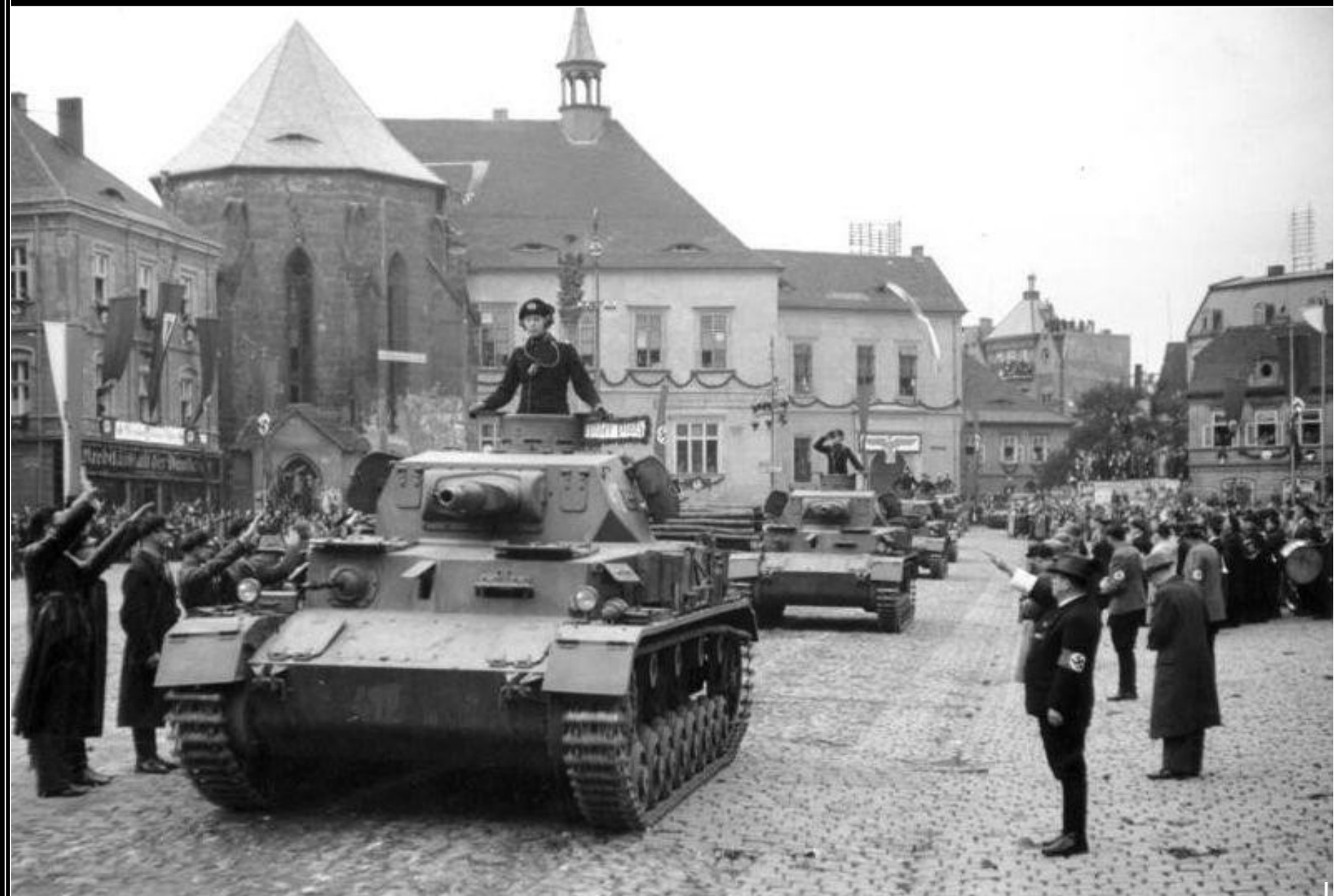
Těžké tanky wehrmachtu v Chomutově - říjen 1938.