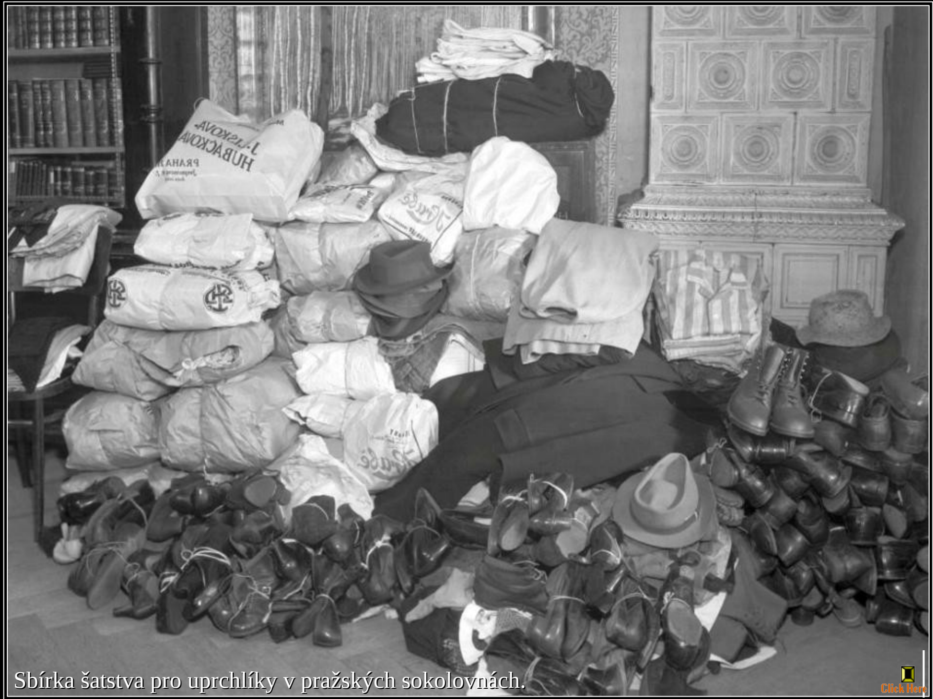
Sbírka šatstva pro uprchlíky v pražských sokolovnách.