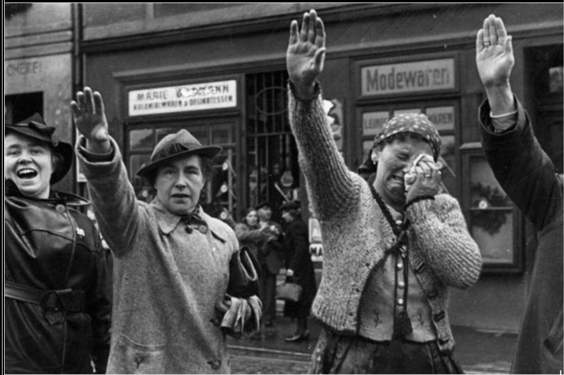
Sudetské Němky vítají v Chebu hajlováním Adolfa Hitlera.