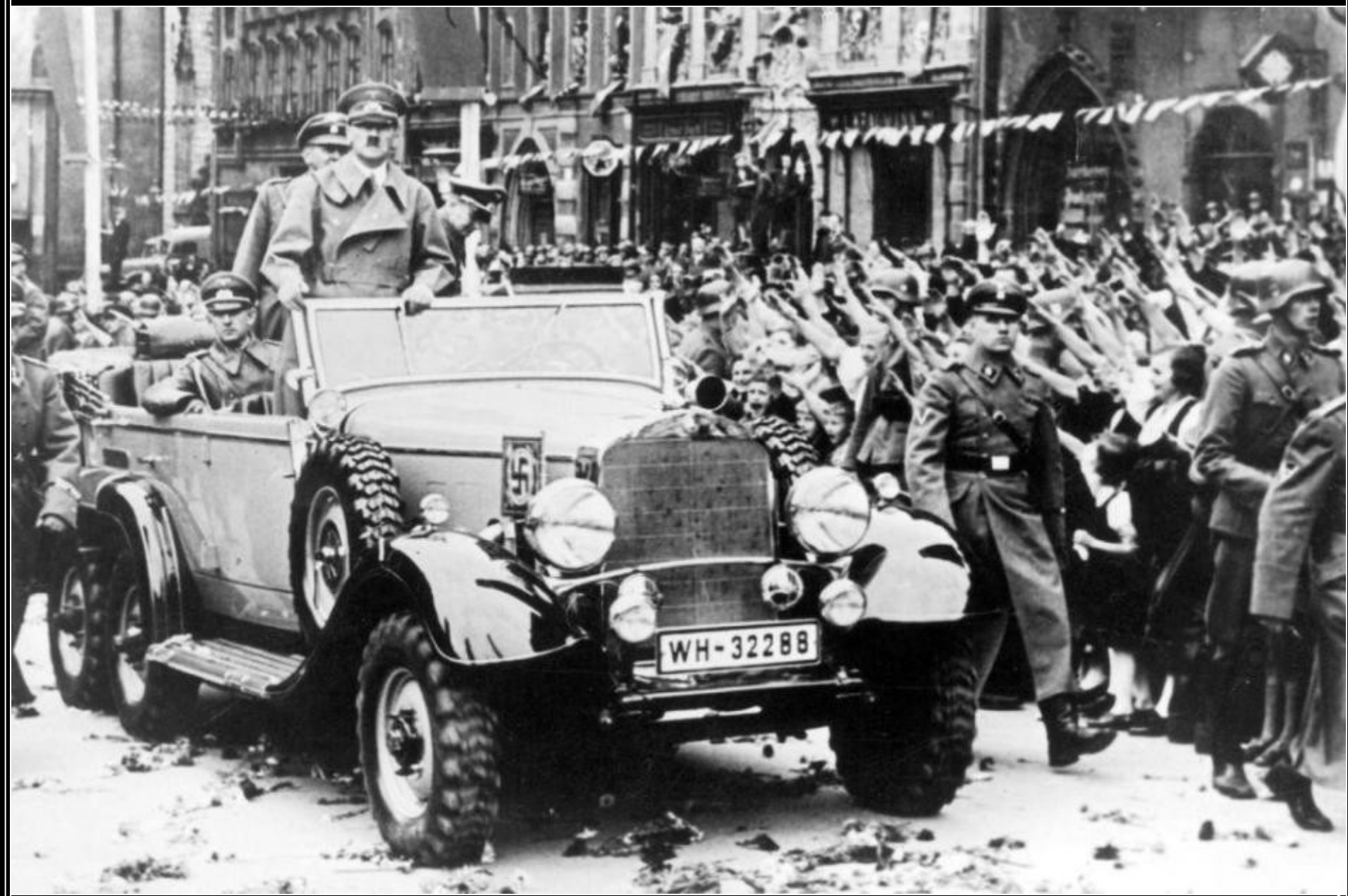
Triumfální přivítání Adolfa Hitlera v Chebu.