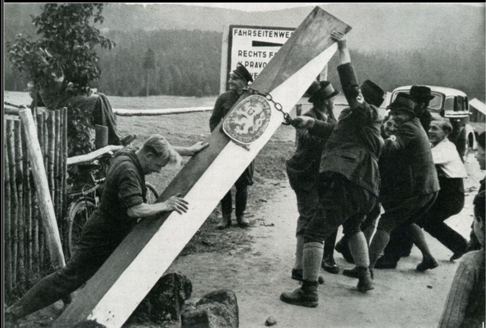
Henleinovci porážejí železný hraniční sloup na čs. státní hranici s Německem.