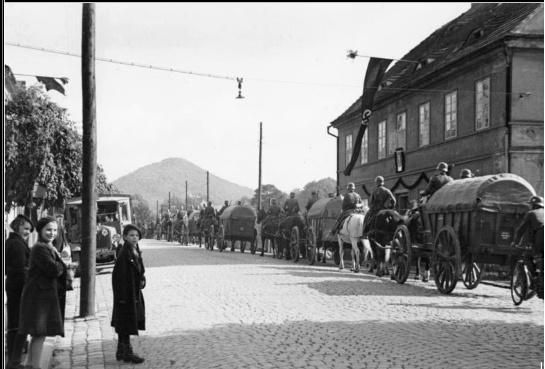
Vojenská kolona německé armády v České Kamenici - 7. října 1938.