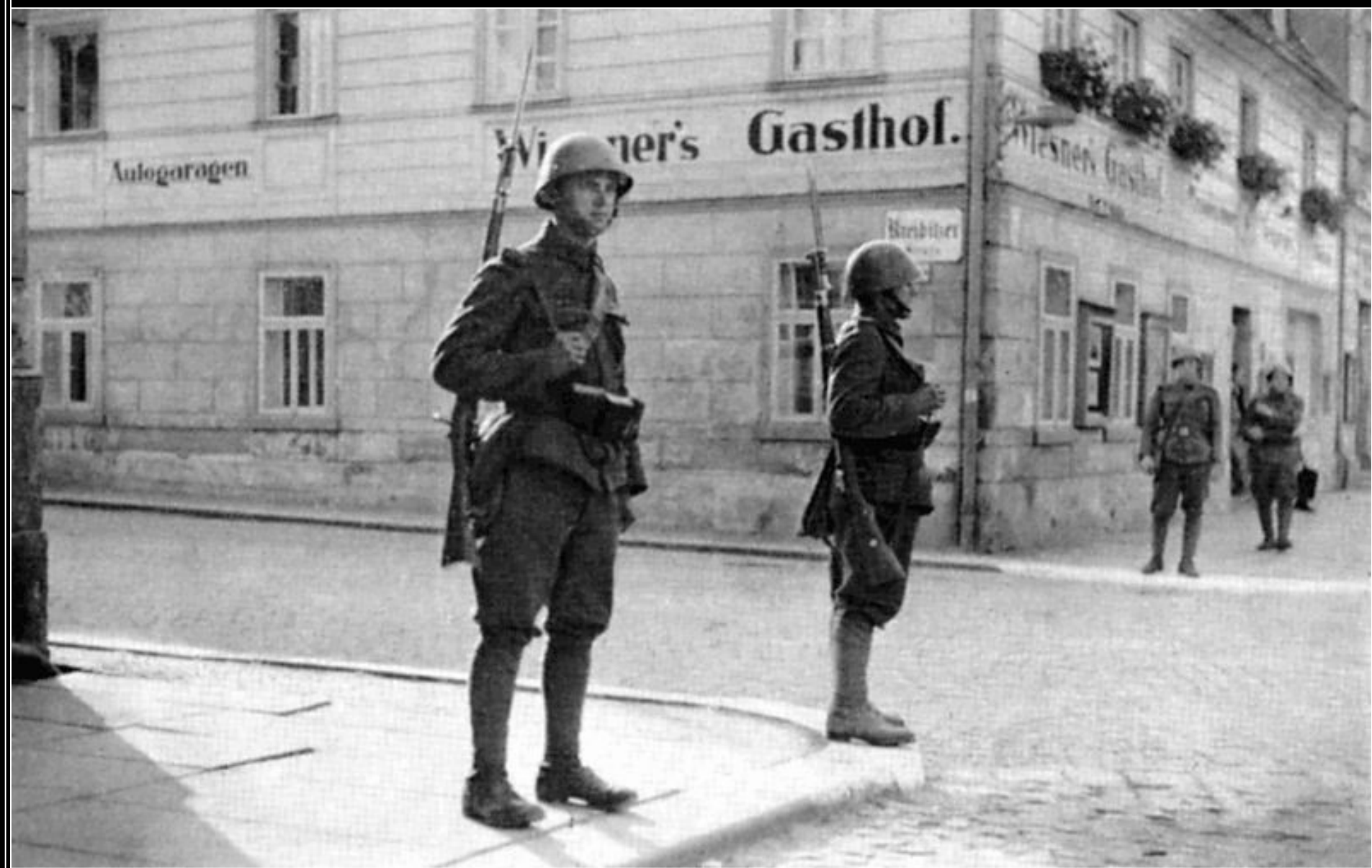
Českoslovenští vojáci hlídkující v Krásné Lípě počátkem října 1938.