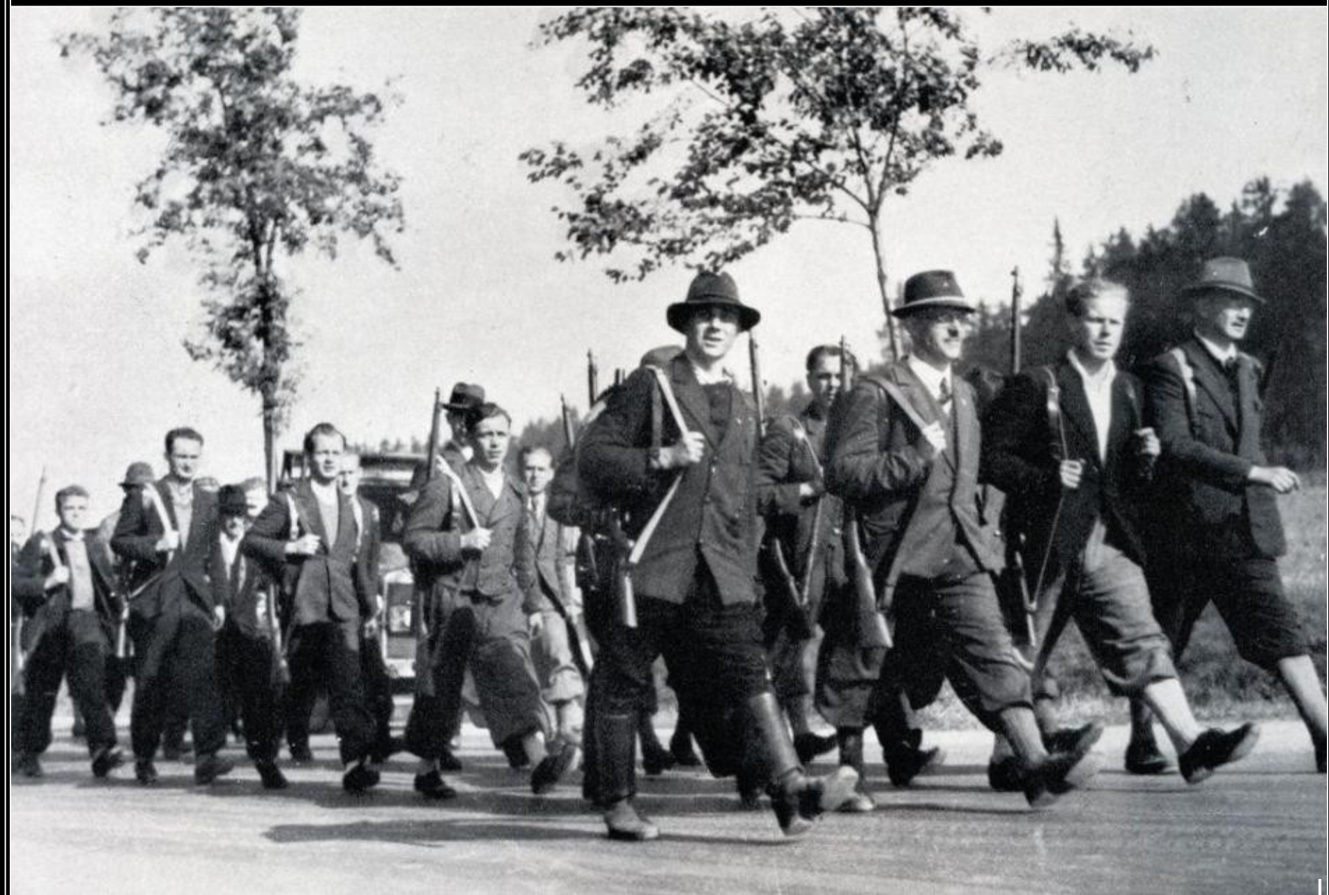
Pochod paramilitantních bojůvek Freikorpsu.