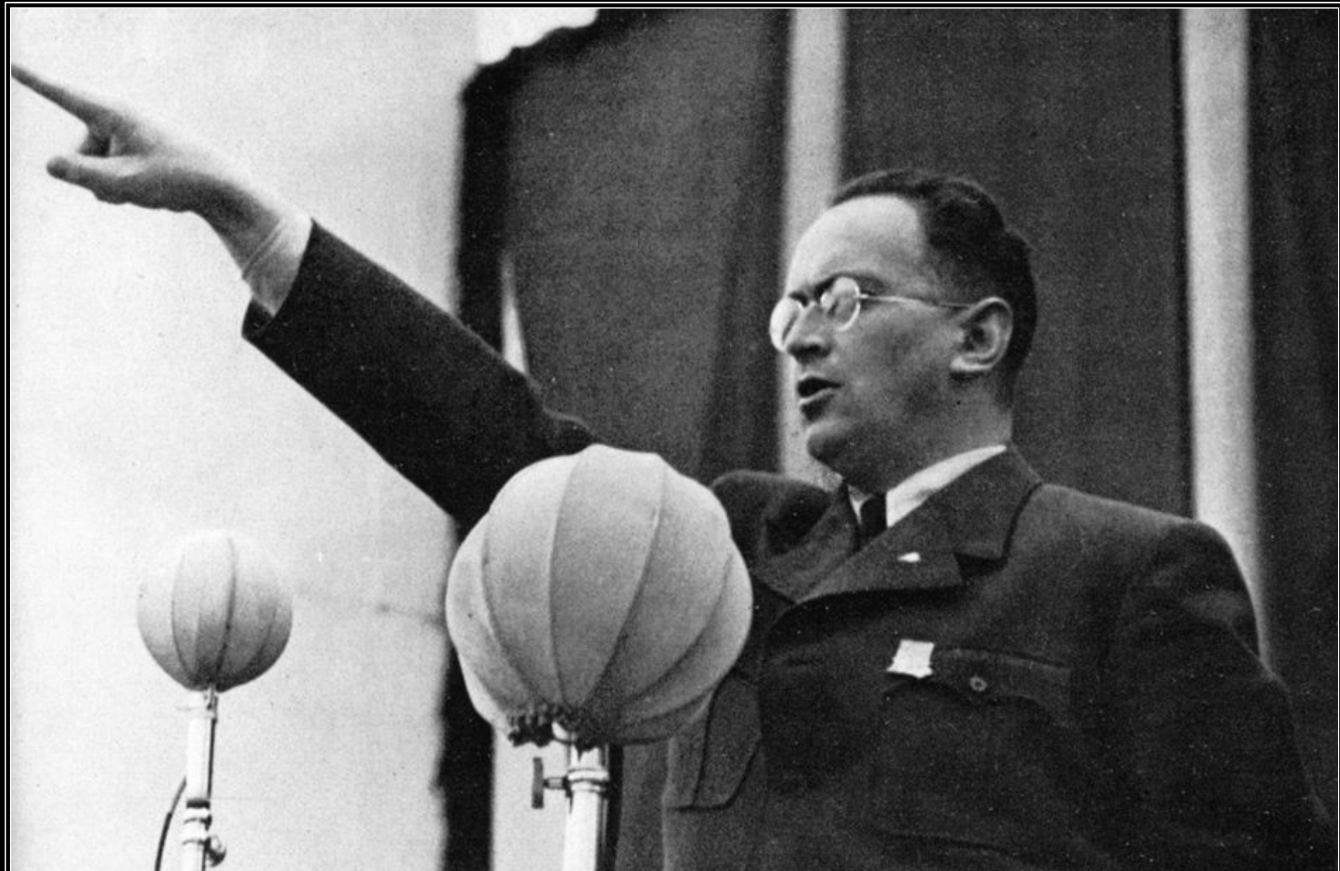
Hlavní strůjce "páté kolony" v Československu Konrad Henlein (1898-1945). Zakladatel a čelný představitel politického hnutí Sudetendeutsche Heimatfront, které se v roce 1935 přeměnilo na Sudetendeutsche Partei (SdP).