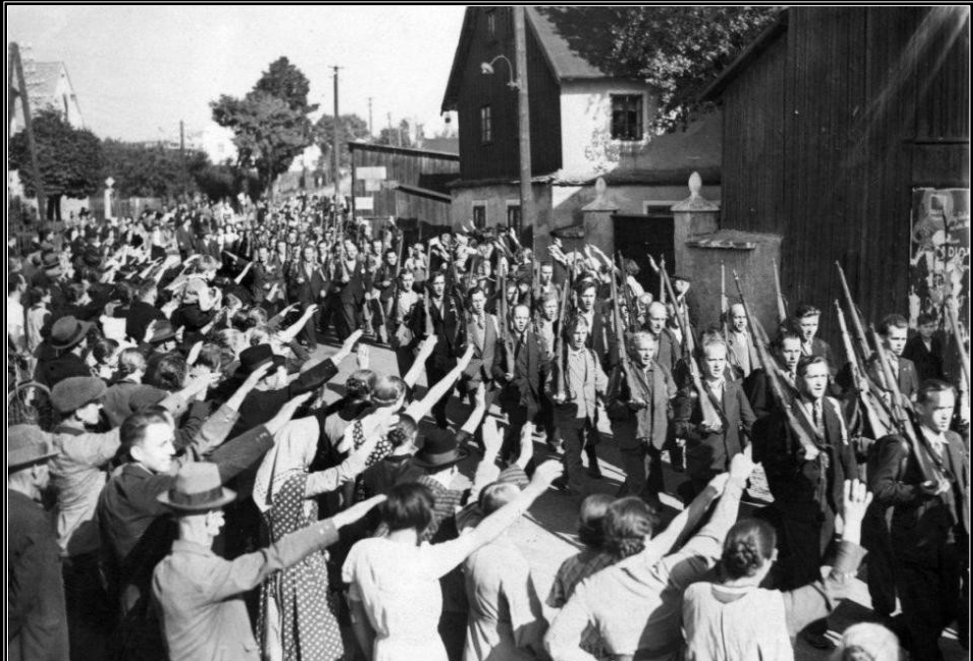
22. září 1938: Až frenetické nadšení českých Němců z pochodujícího Freikorpsu. Druhý den vyhlásila československá vláda všeobecnou mobilizaci armády.