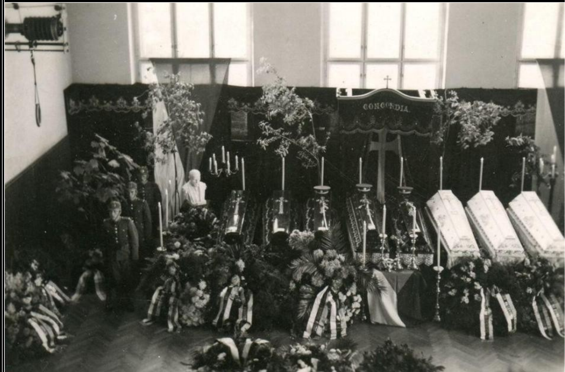
Čestná stráž u katafalku osmi zavražděných četníků, kteří zahynuli při přepadu ordnerů stanice ve Falknově (dnes Sokolov) v září 1938.