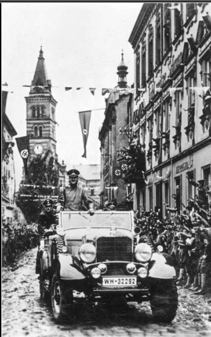
Adolf Hitler v Kraslicích na Sokolovsku - 4. října 1938.