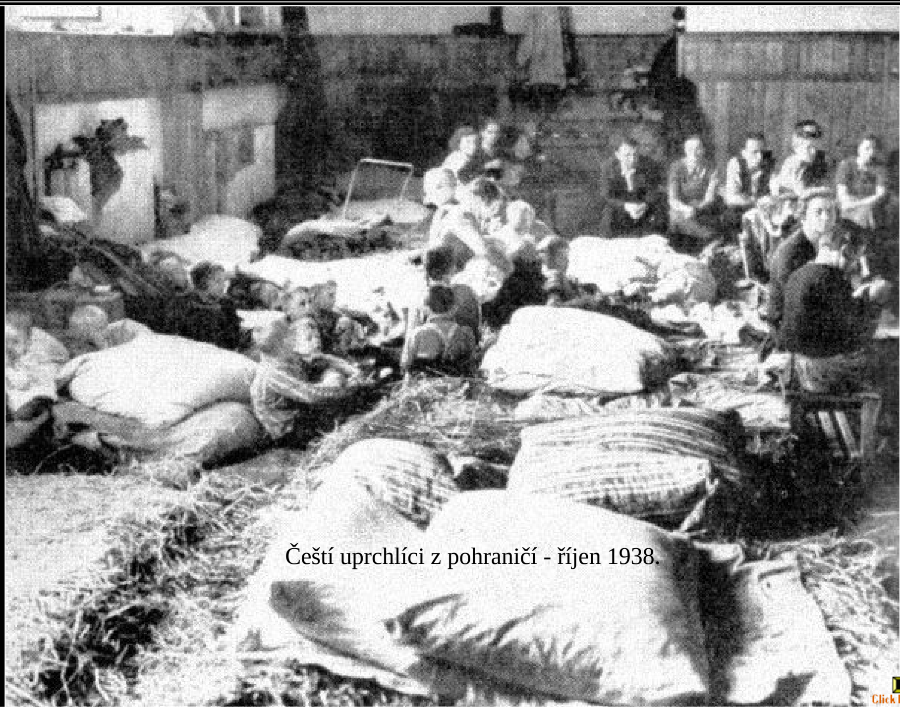
Čeští uprchlíci z pohraničí - říjen 1938.