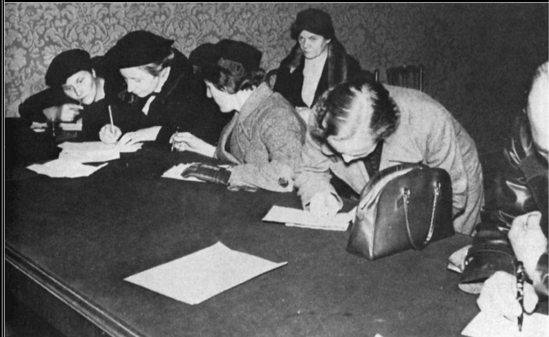
Odsunutí Češi při vyplňování registračních formulářů kvůli nouzovému ubytování. Praha, 13. října 1938.