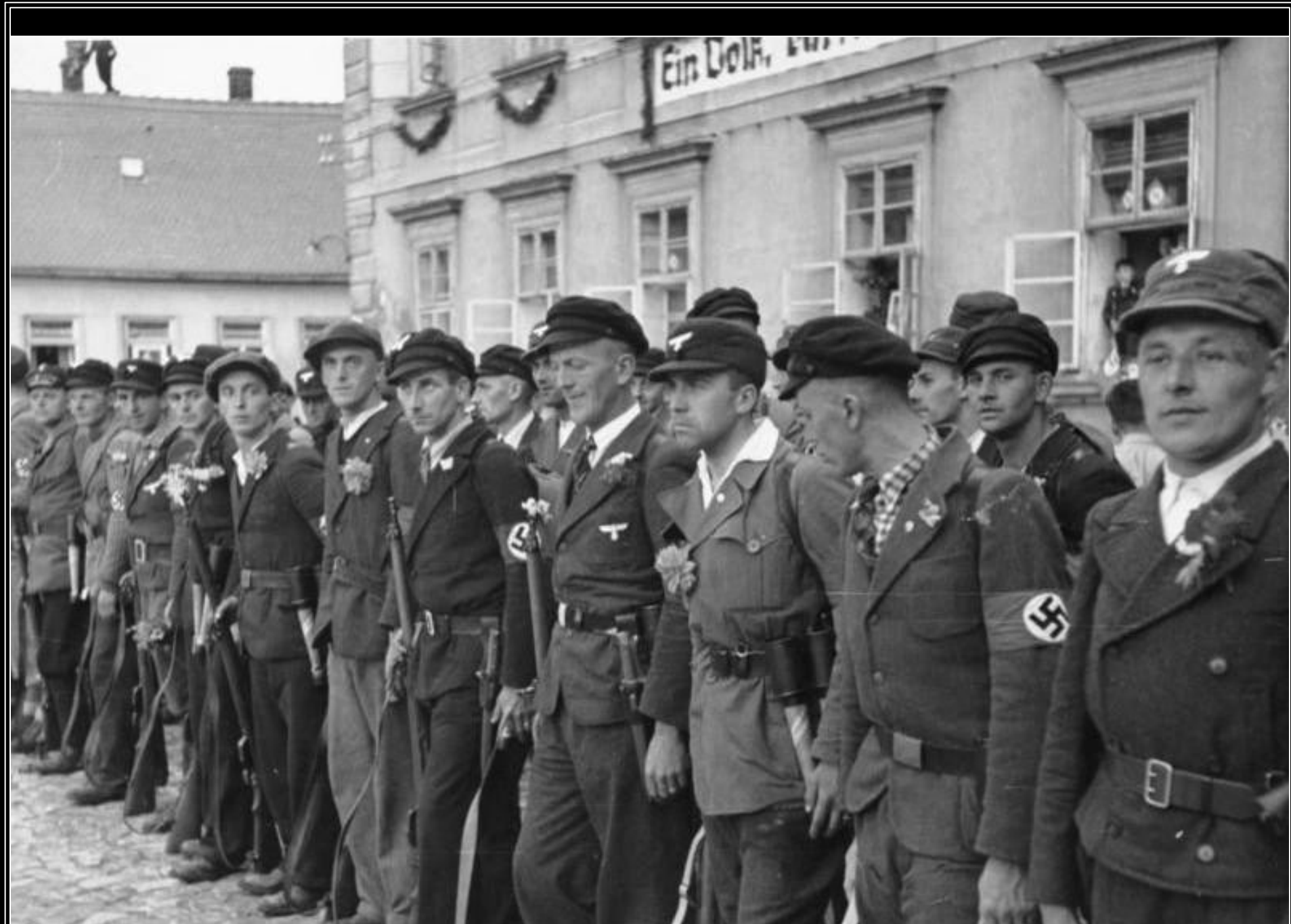
Členové Freikorpsu čekají na příjezd Adolfa Hitlera v Mimonie na Českolipsku - 10. října 1938.