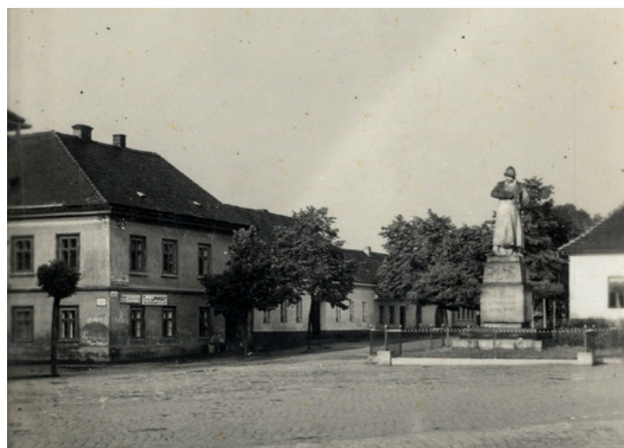
Socha Jana Žižky z Trocnova v původním umístění na předměstí Vodňan.