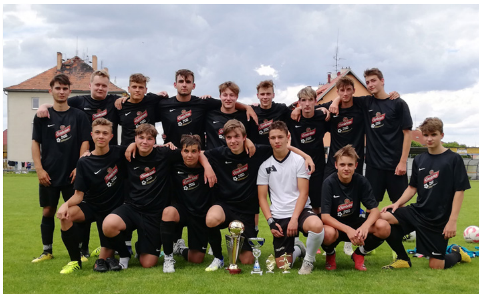
Vítězné mužstvo SK Čtyři Dvory.