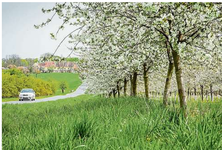
Takhle krásně to může vypadat, když rozkvetou ovocné stromy. Velké sady jsou na Lhenicku i Chelčicku v Jihočeském kraji.