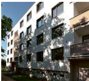
Bytový dům, Brno-Chrlice