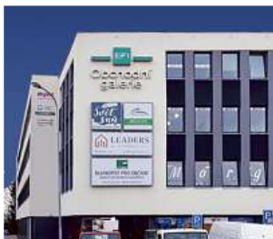
Obchodní galerie, Jihlava