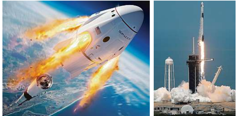
Vpravo start rakety Falcon 9 s pilotovanou lodí Crew Dragon z floridského Mysu Canaveral. Kvůli počasí byl úspěšný až napodruhé.

Zájem o soukromé lety je teď obrovský. Na orbitu by mohli v brzké době zamířit v Muskových raketách nejen bohatí turisté, s nimiž vizionář počítá už v prosin-