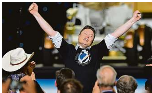
Vlevo Elon Musk slaví grandiózní úspěch svého projektu. Vpravo posádka lodí Crew Dragon vstoupila na palubu Mezinárodní vesmírné stanice na orbitě Země.

Do dnešních dnů vypustilo lidstvo na oběžnou dráhu asi devět tisíc družic, z toho osm z Česka a bývalého Československa. Dva tisíce jsou stále funkční – mapují počasí, vzdálené planety nebo třeba fungují na poli telekomunikace. Plánované desítky tisíc Starlinků ale