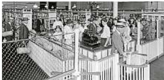
Původní samoobsluha Piggly Wiggly Store v americkém Memphisu.

Samoobslužný prodej, který se v Evropě začal lavinovitě šířit až po druhé světové válce, se zrodil v USA. První obchody vyrostly v roce 1912 v Kalifornii, novinkou byly i všudypřítomné ceny u zboží nebo možnost reklamace a vrácení výrobků. První řetězec vznikl o čtyři roky později ve městě Memphis. Jmenoval se Piggly Wiggly a jeho za-