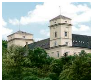
Zámek Račice, přestavba