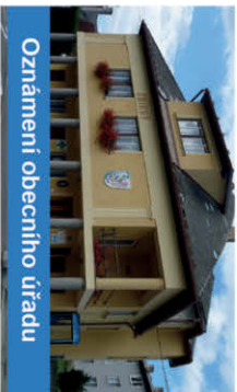
Oznámení obecního úřadu