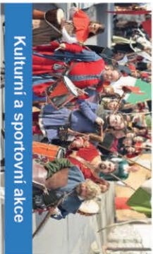
Kulturní a sportovní akce

Přihlášením k odběru hlášení dává registrovaný občan souhlas se zpracováním poskytnutých osobních údajů za účelem zaslání aktuálních informací z obce. Více informací o rozsahu a účelu zpracování a odvolání souhlasu najdete na adrese www.zdikov.hlasenirozhlasu.cz nebo osobně na obecním úřadě.