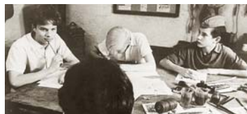
10.20 Záhada hlavolamu