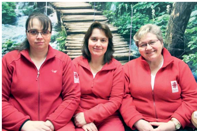
Tým pečujících zdravotních sester ze Zábřeha.