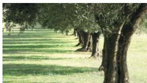
17.15 Úvod do liturgie...