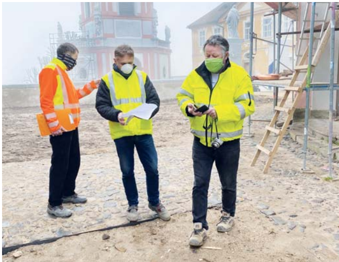
I v současné době mimořádných opatření pokračují práce na rekonstrukci mariánského poutního místa v Horní Polici.