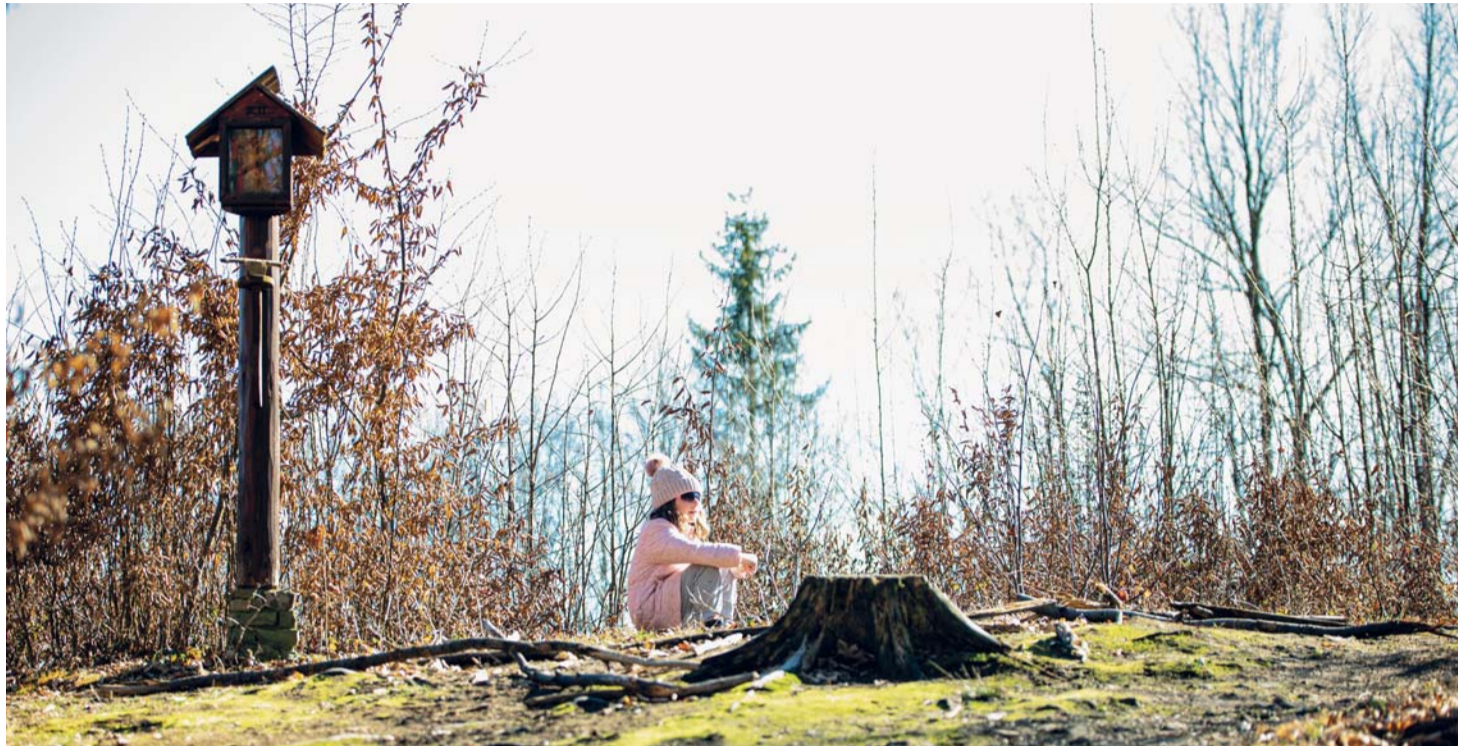
Jarní příroda přirozeně ukazuje sílu celého Božího stvoření.

Jak ale podpořit naděje u těch, kdo ji nemohou v prvé řadě hledat v Bohu, nepočítají se mezi věřící? „To je velice těžké. Třeba jsou ale schop-