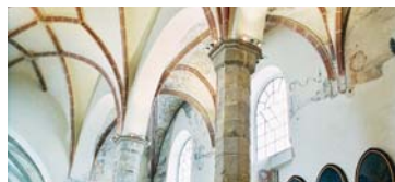
18.00 Mše svatá...