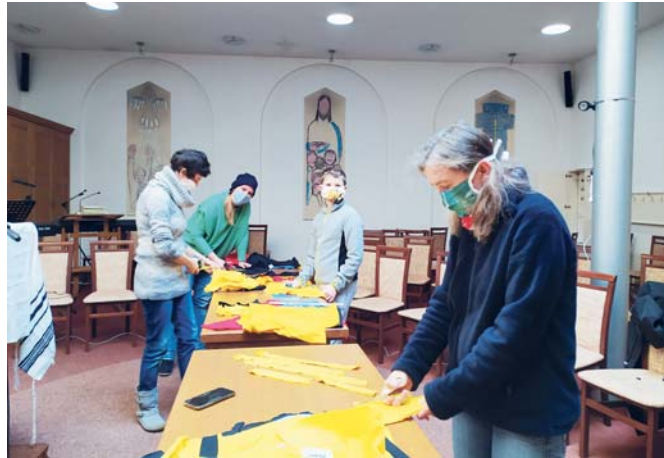
Farní sál v Chebu se proměnil v šicí dílnu na výrobu roušek, zapojují se lidé všeho věku.