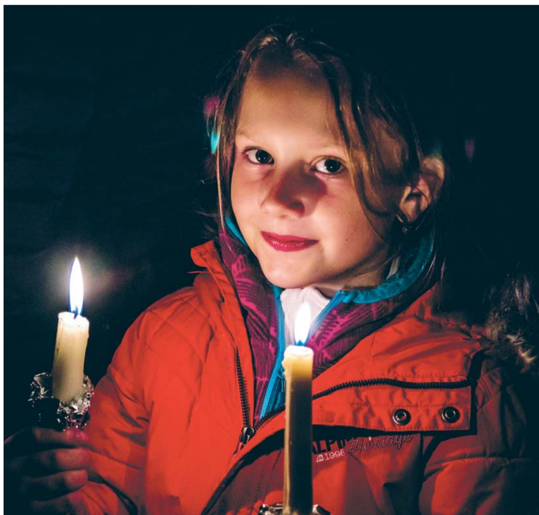
Velikonoční světlo rozežene temnotu noci.

Dvoustranu připravil P. RADEK TICHÝ se spolupracovníky z rodin i kněžských řad