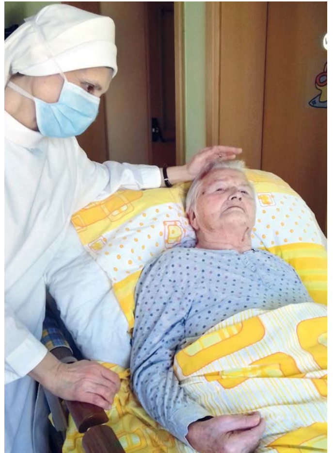
Sestry boromejky se modlí s pacienty v Domově Matky Vojtěchy v Prachaticích.

Sobotní program Diecézního setkání mládeže můžete sledovat od 9.00 na Youtube kanálu Diecézní centrum mládeže ČB, kde také zůstanou videa uložená. (rag)