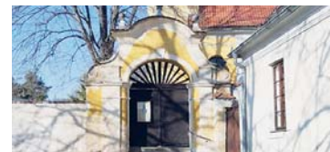
17.30 Večerní bohoslužba...