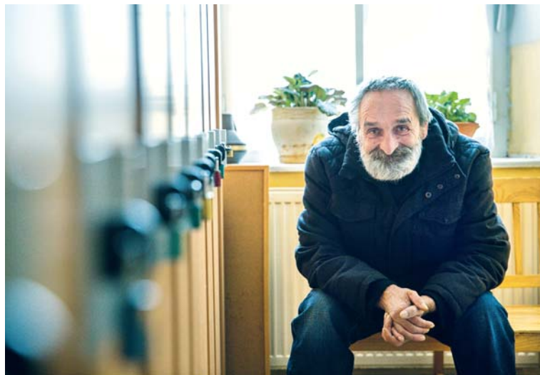
Dům se zvláštním režimem sídlí v opravené budově bývalého chudobince, vystavěného roku 1871.

mřížemi si odseděl devět let. Před pár týdny ho pustili na podmínku a teď se snaží sekát dobrotu. „Musím – a chci – tady být půl roku hodnej. Je mi třicet šest a potřetí začínám od nuly,“ přiznává. Během měsíce si musí najít práci a začít splácet dluhy, a když to vyjde, jednou se postaví na vlastní nohy. Podobně je na tom Tomáš, který bral drogy, ale co ho pustili jak z psychiat-