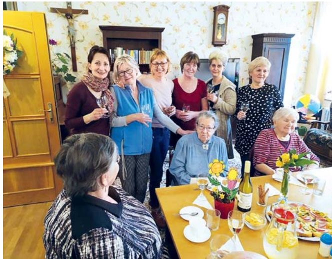
Oslava 90. narozenin klientky domova (uprostřed).

Čtvrtina klientů je upoutána na lůžko, jiní ujdou krátkou vzdálenost jen s podporou pe-