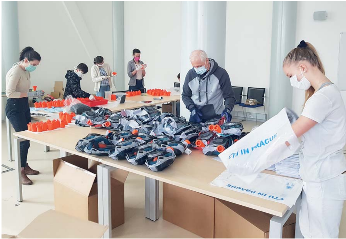
Bubenečská farnost sestavuje ochranné masky s filtrem pro zdravotníky.