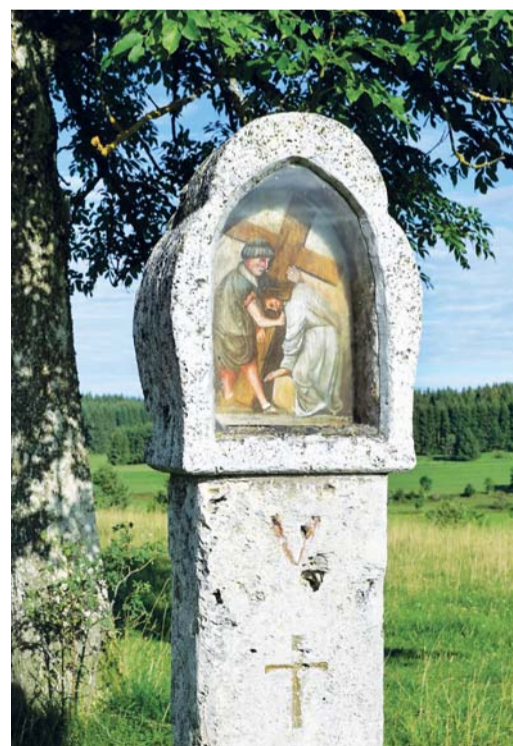
V postní době můžeme spojit výlet do přírody třeba s modlitbou křížové cesty.

Chtěl bych nám všem připomenout několik skutečností. Jednak je doba postní více než jakékoli jiné období v roce vnímána jako doba pokání, obrácení. Domníváme se, že to je právě to, co se od nás Ježíšových učedníků očekává. Bible mluví o obrácení a pokání jako o návratu k živému Bohu. Jde o návrat našeho