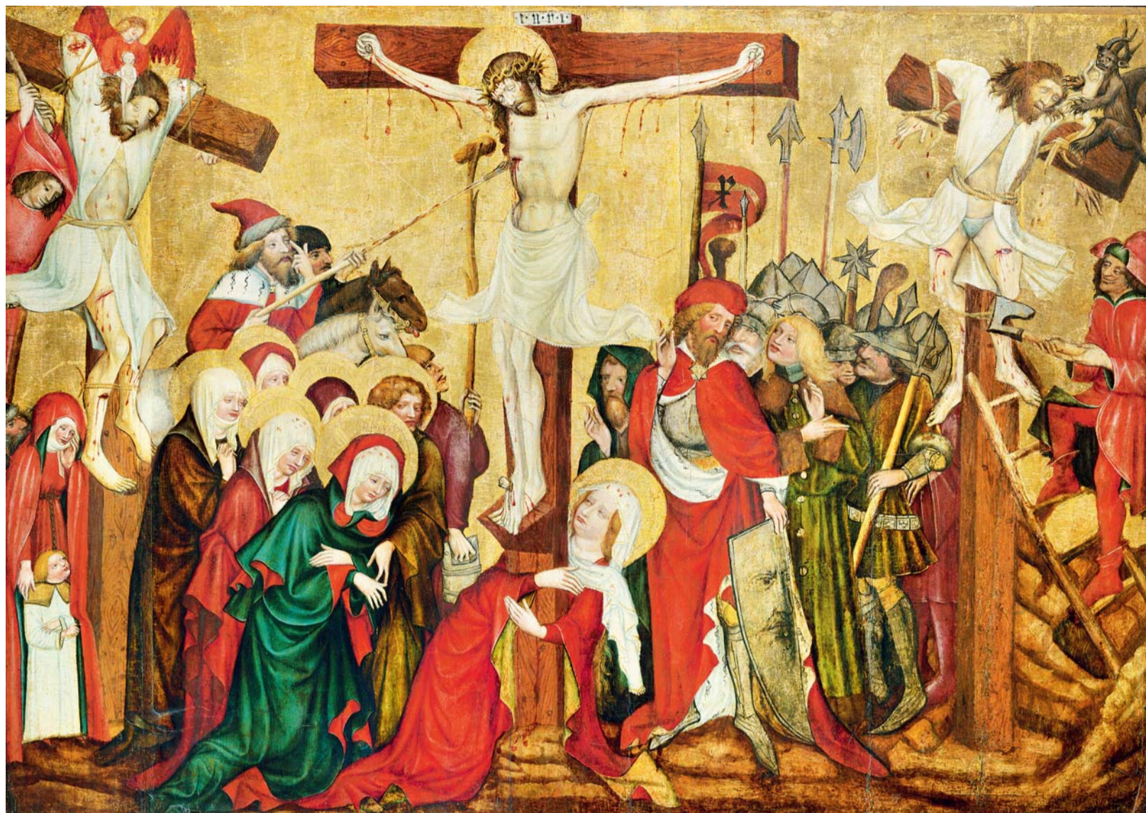
Tzv. Rajhradské Ukřižování (kolem roku 1440) je jedním z mistrovských děl v držení Národní galerie Praha, které nyní lze obdivovat na internetu.

Speciální online prohlídku připravilo pro obdivovatele historie a kultur světa Britské muzeum v Londýně na stránkách britishmuseum.withgoogle.com . Interaktivní putování po časové ose od pravěku k dnešku lze filtrovat podle tematických okruhů, jedním z nich je „Religion and Belief“ (Náboženství a víra). Tyto klíče odemknou k prohlídce třeba díla a památky starého Egypta, starověké Číny, dáv-