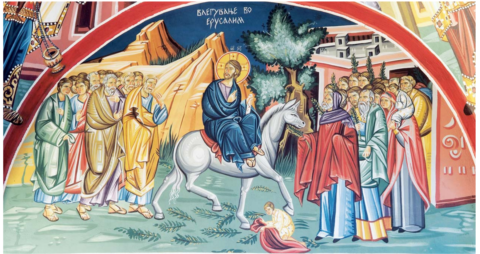
Ježíš nevstupuje do Svatého města, aby přijal počty vyhrazené pozemským králům, těm, kdo mají moc. Přichází, aby byl bičován, inzultován a vysmíván.

Bdí ten, kdo se probudil, to dá rozum. Jenže nemluvíme zde jen o fyzickém stavu člověka, který procitl k plnému vědomí a jeho organismus je v pohotovosti natolik, že je schopen přiměřeně reagovat na vnější podněty. Ježíš nás imperativem „bděte!“ vyzývá především k připravenosti nitra a vnímavosti srdce. Podobně jako Samuela, kterého opakovaně volá jménem, vyvádí Hospodin každého z nás z našeho neplodného snění do pl-