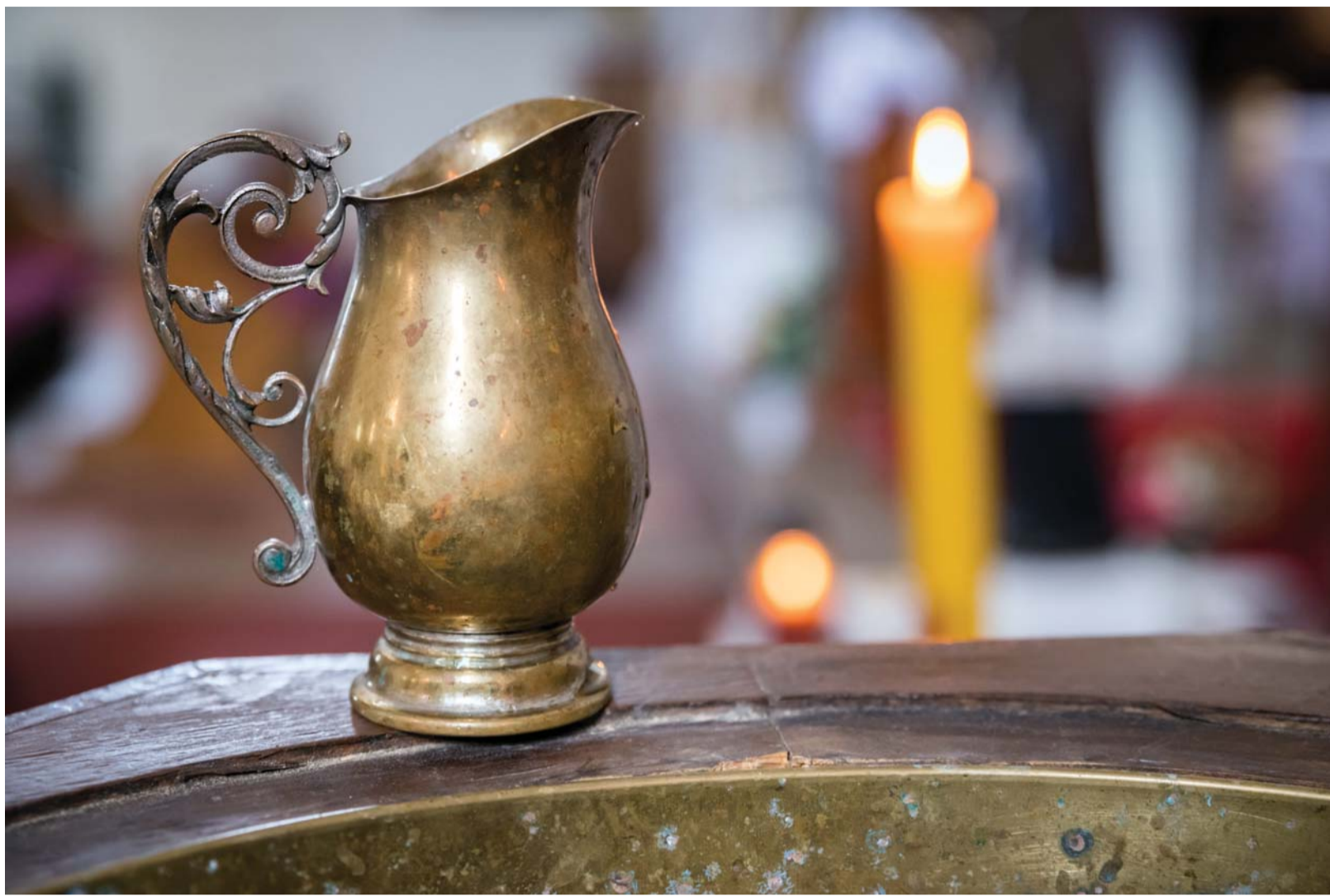
Během slavení vigilie si můžeme připomenout také vlastní křest.

Moment rozsvícení světla a chvály je možné prodloužit modlitbou díky vlastními slovy nebo třeba společně přečteným Žalmem 118.