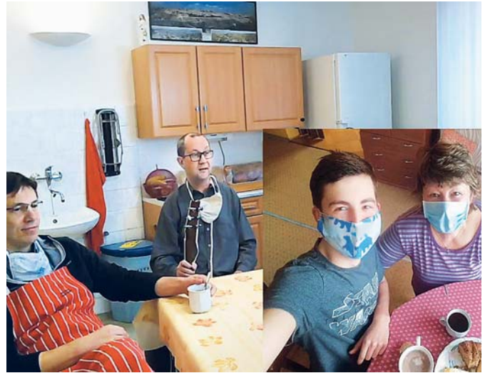
Virtuální farní kavárnu uspořádali po přenosu nedělní mše svaté salesiáni v Brně-Žabovřeskách. Promítali v ní fotografie lidí z jejich „domácích kaváren“. Celkem přišlo 165 snímků z celého Česka.

■ Kostel sv. Václava v 10.00 na www.youtube.com .