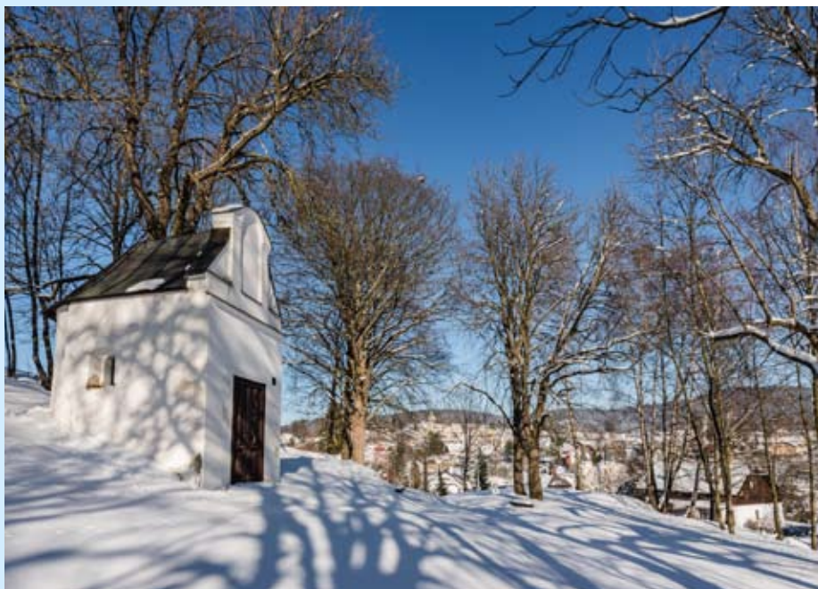
(Kaple Hoří Olivetské ve svahu nad starou cestou na Rejštejn)

Připomeňte si krásu kaplí a kapliček v Kašperských Horách