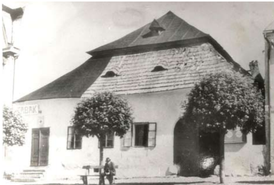
REŠENÍ: Tento dům se nacházel na náměstí mezi hotelem Kašperk a pivovarem.