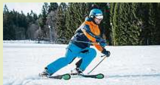
Skiareály zachraňuje umělý sníh.

ale stávající nasycenost půdy, vodních toků nebo naplněnost nádrží není pro vodní bilanci letošního léta žádným pozitivním „bianco šekem“.