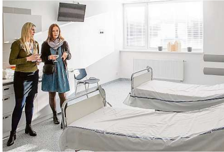
V upravených prostorách prachatické nemocnice přibyla interní ambulance, infuzní stacionář či dětská ambulance.

Timto malým urgentním příjmem, který je postavený na míru okresní nemocnice, projdou denně desítky nemocných. Interní ambulance je určena pro pacienty s chronickými nemocemi, jako