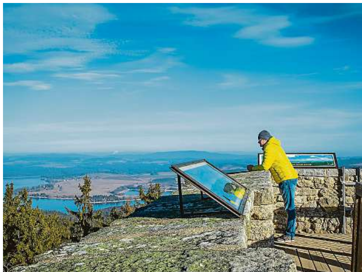
Nejvýše položený hrad v České republice je otevřený celoročně. Je z něj krásný pohled na Lipensko.