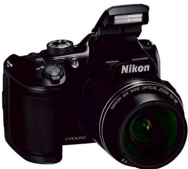
Fotoaparát Nikon Coolpix B500

16Mpx snímač CMOS • 40× optický ultrazoom • optická redukce vibrací • režim makro • 3" výklopný displej • napájení AA baterie • Full HD video • Wi-Fi • Bluetooth