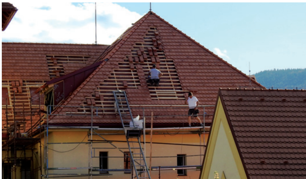
ZŠ Vodňanská rekonstruuje půdní prostory pro nové odborné učebny výpočetní techniky, cizích jazyků a přírodních věd.