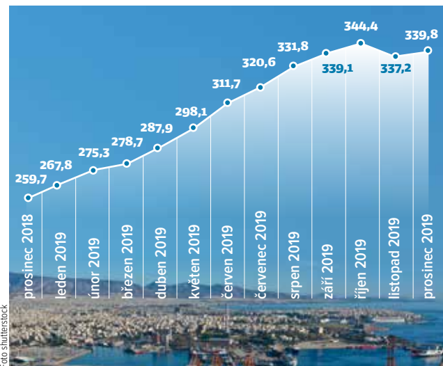
Vývoj indexu cen řeckých bondů Bloomberg a Barclays během posledního roku (v bodech)