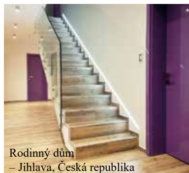
Rodinný dům – Jihlava, Česká republika