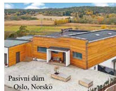
Pasivní dům – Oslo, Norsko

Díky automatizaci objektu došlo k významným úsporám energie. Progresivní myšlení majitelů vedlo k tomu, že již v projektové dokumentaci domu zohlednili i případné budoucí požadavky na doplnění