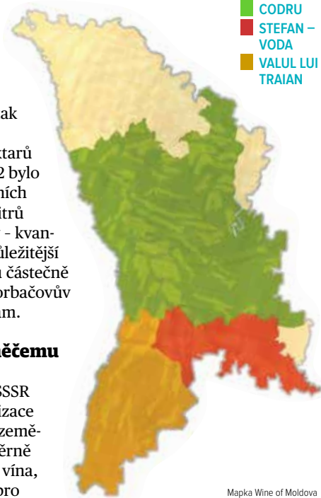
Mapka Wine of Moldova