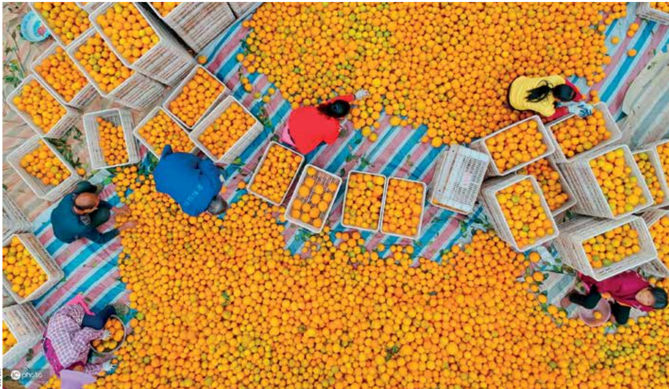
SKLIZEŇ. Farmáři třídí bohatou úrodu pomerančů, kterou sklídili u města Kan-čou ve východočínské provincii Ťiang-si.