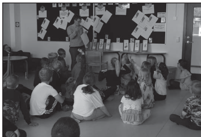
Škola v Dánsku