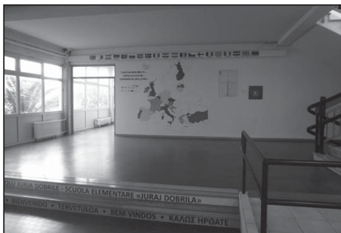
Škola v Chorvatsku