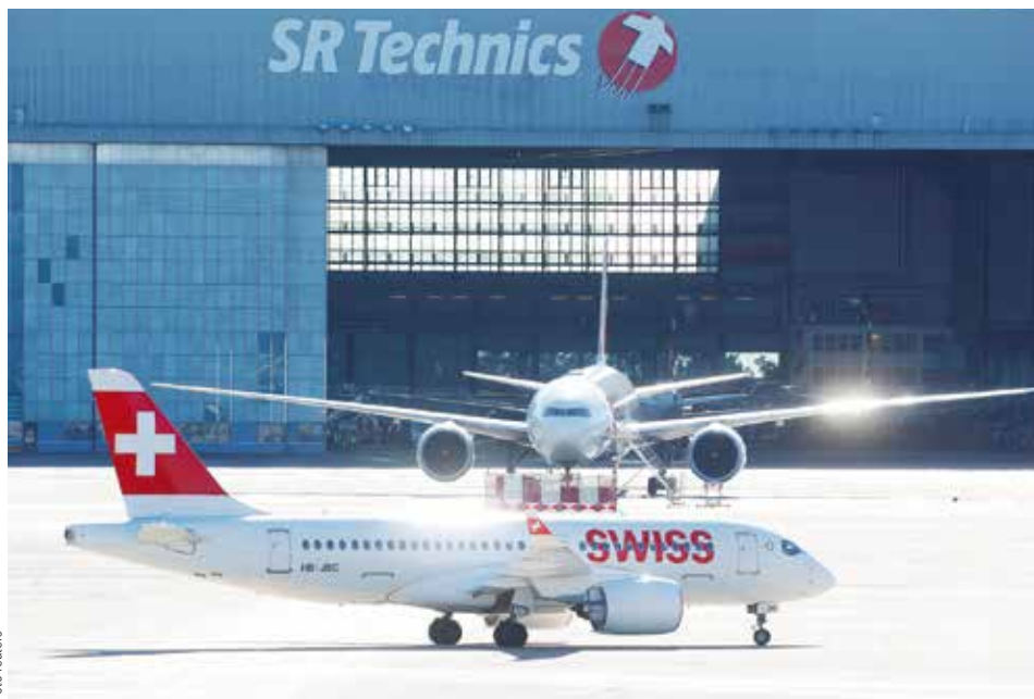
VÝMĚNA. Airbus A220 míří do odstavného hangáru, kde bude do detailu prozkoumán technický stav jeho motorů.

Letos v červenci musel letoun A220 aerolinek Swiss nouzově přistát po selhání turbíny jednoho z motorů. Stejný problém musela řešit posádka dalšího letounu v září, přičemž francouzský