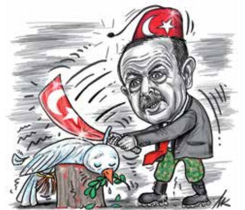
Kresba Milan Kounovský INZERCE

Výpadkem je ostatně i daň z církevních náhrad, kterou Ústavní soud smetl. S tím vláda sice do značné míry počítala, nicméně i tak zaujmou některé reakce. Třeba když premiér včera neústupně a principiálně prohlásil, že „příjmy se mají danit“. Jak že to bylo tehdy s těmi koronovými dluhopisy?