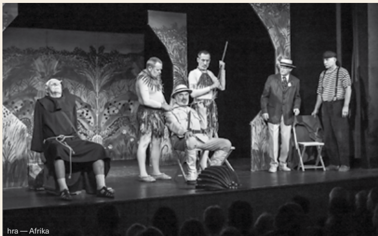
hra — Afrika

Téměř osmimiliardový kontrakt v Polsku má jistý plzeňská Škoda Transportation. Byla potvrzena jako vítěz tendru na dodávku až 45 šestivozových souprav metra pro Varšavu. První bude předána zákazníkovi do dvou let od podpisu kupní smlouvy. Podnik dodá vozy v konsorciu s dceřinou firmou Škoda Vagonka. /čtk/