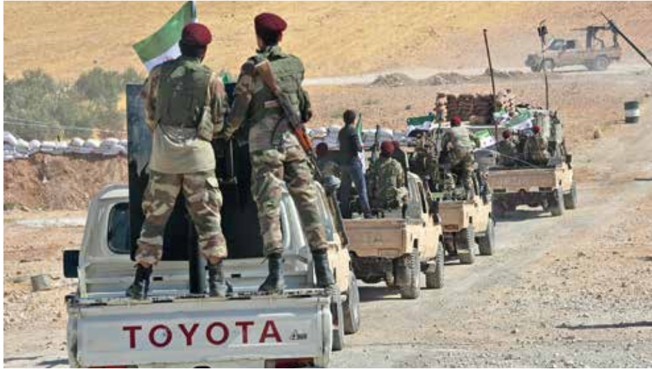
POSILY. Bojovníci syrské opozice, kterou Turecko od počátku syrské války podporuje, míří ze západu ke kurdským městům Tall Abjad a Rás al-Ajn, aby se připojili do protikurdské ofenzivy.

Turecko za útok na YPG, které v minulosti pomohly porazit IS, sklízí kritiku po celém světě. Připojili se k ní čerstvě i představitelé českých politických stran, kteří hovoří o zradě a o porušení mezinárodního práva, řada zemí Evropy akci označuje jako invazi. Na to reagoval turecký prezident Recep