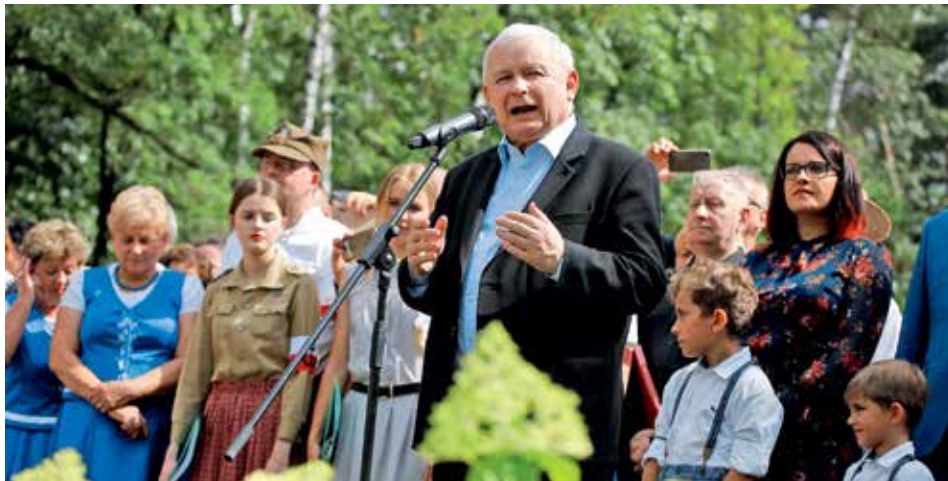
LÍDR PiS Jaroslaw Kaczyński během předvolební kampaně v průmyslovém městě Stalowa Wola.

Třetí patrně skončí sdružení levicových stran, kterému šetření předvídají zisk kolem třinácti procent. Polská koalice v čele s lidovci může získat asi šest procent hlasů. Otazník se vznáší nad nacionalistickou Konfederací, jež se aktuálně