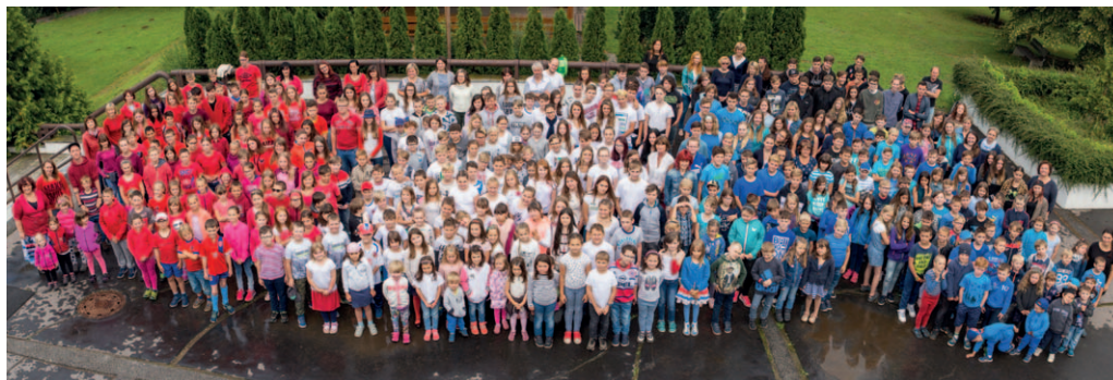
Interiér ZŠ Národní osvěžila i takhle obrovská fotografie žáků a učitelů pořízená ze střechy školy.