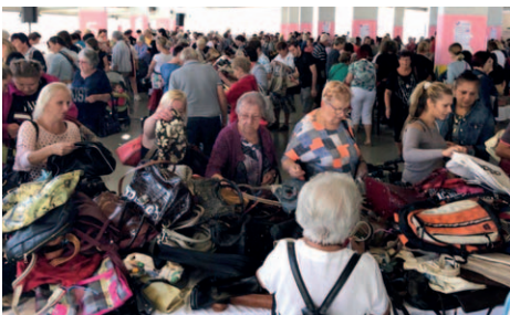
Kabelkový veletrh v českobudějovickém IGY 4. 9. 2019