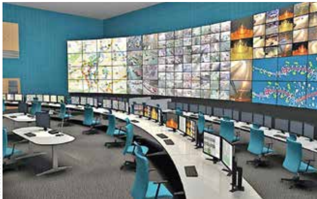
CENTRÁLA. Vizualizace multifunkčního operačního střediska Malovanka, ze kterého bude řízena doprava v celé metropoli.

Radnice minulý týden vyzvala firmy k účasti v soutěži na stavbaře, který chátrající železobetonový skelet na Břevnově dokončí za předpokládaných 601 mi-