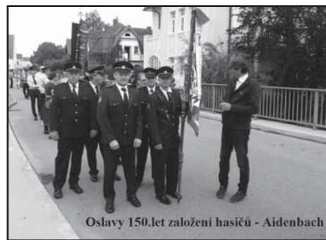
Oslavy 150.let založení hasičů - Aidenbach