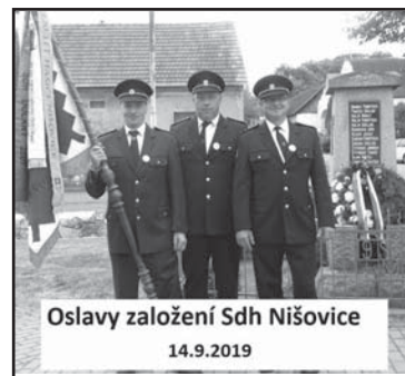
Oslavy založení Sdh Nišovice 14.9.2019