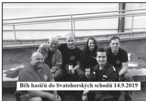
Běh hasičů do Svatohorských schodů 14.9.2019