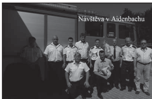
Návštěva v Aidenbachu