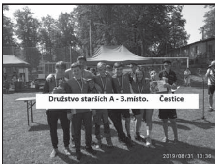
Družstvo starších A - 3.místo. Čestice

6.září - proběhlo taktické cvičení na dálkovou dopravu vody v obci Nišovice, tohoto cvičení se zúčastnili všechny sbory okrsku Volyně.