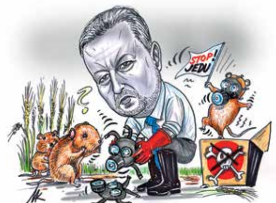
Kresba: Milan Kounovský

titul docenta (v oboru didaktiky společenských věd, dodejme) a jako primátor řídil Olomouc, kterou hlava státu považuje za kulturní město. Michal Šmarda naproti tomu nemá vysokoškolské vzdělání a léta úspěšně řídí jenom jakési Nové Město na Moravě na prezidentově milované Vysočině. Až jednou vyjde sborník nejlepších politických argumentů, tak tento hradní výplod v něm rozhodně nebude. Ale co naplat. Když Zeman nemá v této své monumentální mocenské hře žádného zaznamenaníhodného soupeře, nic ho nenutí se nějak zvlášť snažit.