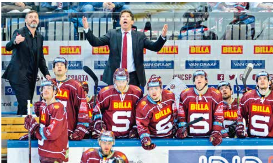
ÚMĚRA. Se zhoršujícími se sportovními výsledky hokejové Sparty poklesl i hospodářský výkon klubu, jehož zisk se meziročně smrskl z devíti milionů na jeden milion korun.

Od propadu do ztráty klub zachránila smlouva s generálním partnerem, kterým je obchodní řetězec Billa. „Zisk jsme udrželi, protože jsme se mohli opírat o partnerství s Billou,“ píše se ve výroční zprávě podepsané tehdejší