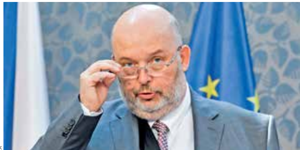
REAKCE NA ODBORNÍKY. Ministerstvo zemědělství vyslyšelo varování ekologů či ornitologů.

Úřad k rozhodnutí přistoupil po diskuzi a vlně kritiky, v níž ministerstvo životního prostředí a ekologické organizace upozornily na to, že