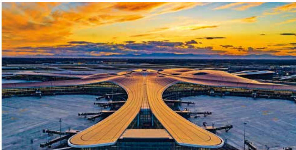
PREMIÉRA. Letiště Ta-sing u Pekingu navržené Zahou Hadid přivítá první mezinárodní lety v září.

Největší asijská letiště už nemají být pouhým přestupným bodem, nevyhnutelným zlem, kterým musí cestující projít. Naopak. Mají se stát jakýmsi samostatným městem, které bude přitahovat ekonomický potenciál plynoucí z peněženek jak cestujících, tak i místních obyvatel. Příkladem takového letiště má být nový vzdušný přístav Ta-sing v Pekingu s roční kapacitou sto milionů odbavených pasažérů.