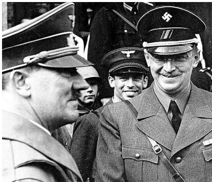
Konrada Henleina (vpravo) si vysoce cenil nejen Adolf Hitler (vlevo), ale i liberečtí zastupitelé.