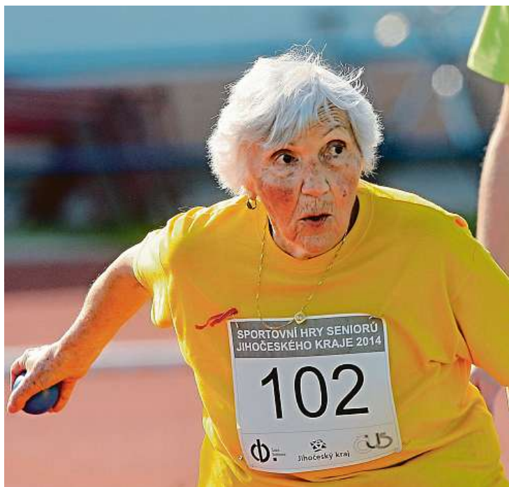
Začít se hýbat může člověk v každém věku. A je důležité sportovat bez výrazných extrémů.

Není pozdě začít v žádném věku. Vyplatí se to v mládí, ve středním věku i ve stáří. Přitom u starších lidí s nadváhou není ani tak důležité redukovat váhu, pokud nejsou moc obézní, ale spíš se snažit o pohybovou aktivitu. Ve starším věku přirozeně ubývá svalové hmoty, a pokud by senior začal s přísnou dietou, automaticky mu začne ubývat svalů. A to může ohrozit jeho soběstačnost.