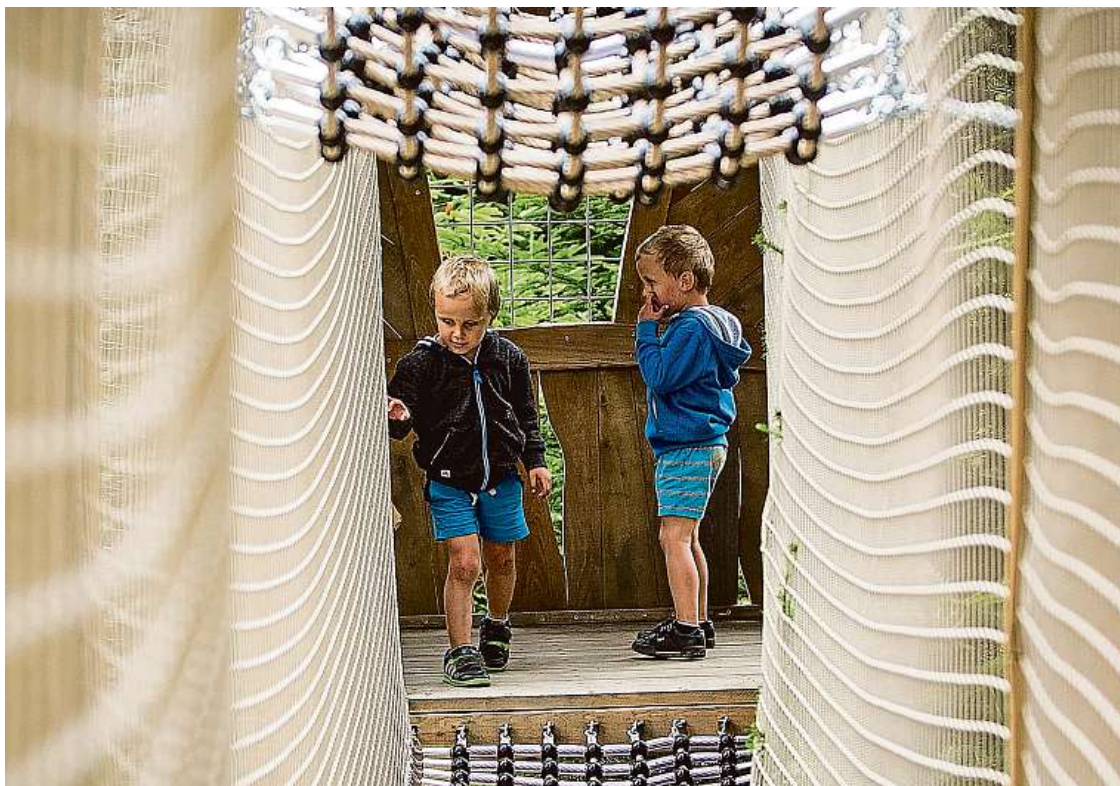
Království lesa láká hlavně rodiny s dětmi, které si vyzkouší překážky v korunách stromů.