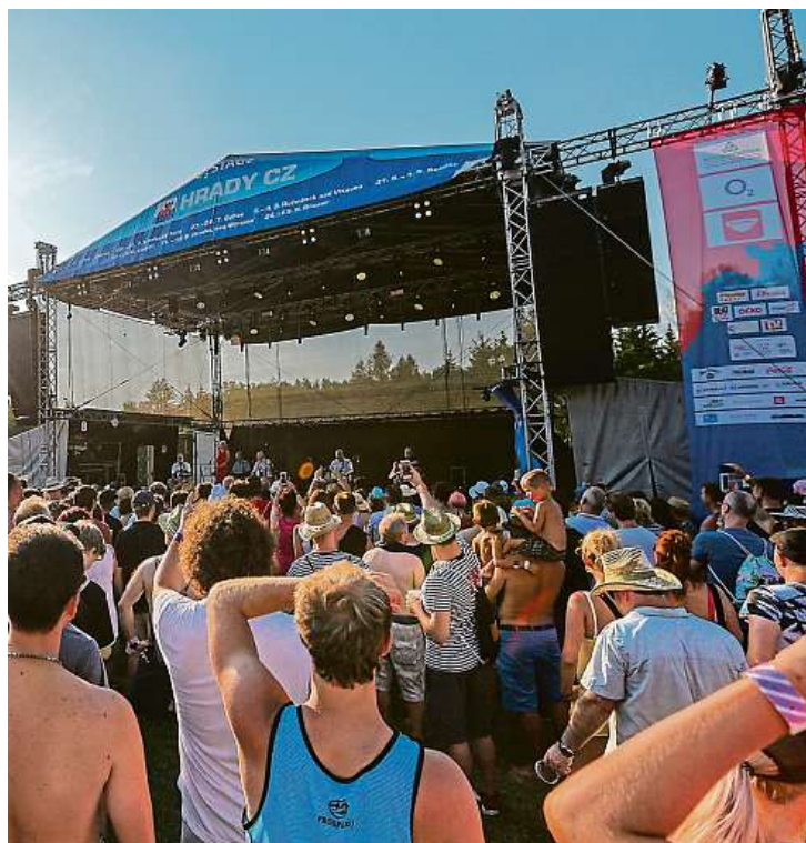
Atmosféra je na festivalu Hradý CZ v Rožmberku nad Vltavou vždycky skvělá. I letos pořadatelé upozorňují, aby návštěvníci přijeli včas.

Hradý CZ tam letos zavítají v pátek a v sobotu 2. a 3. srpna. „Určitě se vypla-