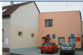
Domov pro seniory Máj České Budějovice je příspěvkovou organizací zřízenou statutárním městem České Budějovice. Naše činnost je finančně podporována statutárním městem České Budějovice a Jihočeským krajem.