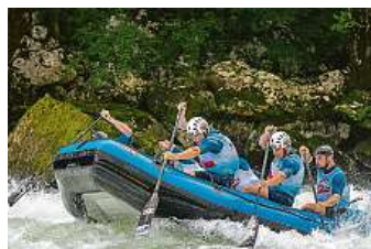
Posádce Hanace rafters se na mistrovství Evropy dařilo.

Českobudějovičtí Hanace rafters excelovali na mistrovství Evropy na divoké vodě, kde brali celkové první místo. Na řece Vrbas uspěli už před několika lety.