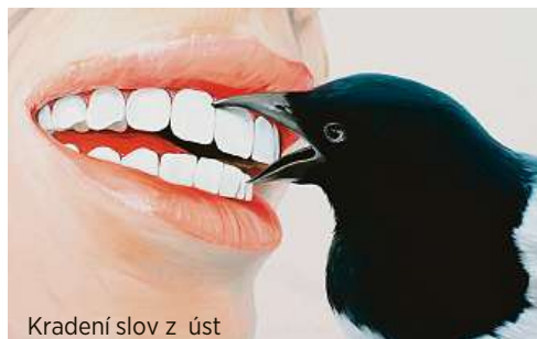
Kradení slov z úst