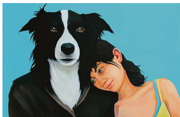
Nejlepší přítel českého člověka