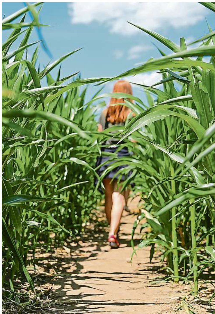
V Roseči na Jindřichohradecku budete hledat správné cesty v kukuřičném poli.

Netradiční výstup můžete zažít na šumavském Zadově, který se v zimě proměňuje v lyžařské centrum. I v létě si však můžete návštěvu užít. A možná se u ní zapotit. K bývalému skokanskému můstku můžete vyjet ještě lanovkou. Pokud si však chcete užít výhled z útrob nájezdové věže, musíte zdolat 158 schodů na vrchol. Ten je ve výšce 1 109 metrů nad mořem. Na straně věže se nachází horolezecká stěna, kterou je možné zdolat. Pokud by to někomu stále nestačilo,