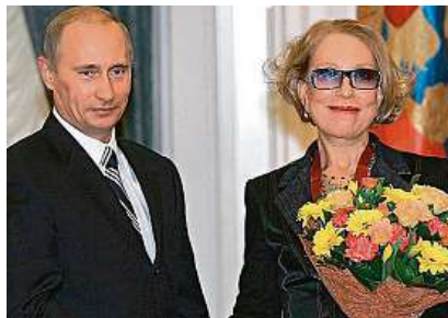
Herečka Inna Čurikovová s prezidentem Vladimírem Putinem a vpravo coby šeredná a zlá Marfuša v kultovní pohádce Mrazík.

Herečka Inna Čurikovová, kterou mají čeští diváci navždy zapsanou v mysli jako Marfušu z Mrazíka, kdysi přiznala, že si ve vizáži hloupé sestry ni-