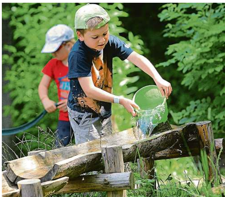
Zeměráj nabízí pro rodiče i děti poznat, jak žili lidé ve středověku. Jeho součástí je i stezka naboso nebo krytá herna.