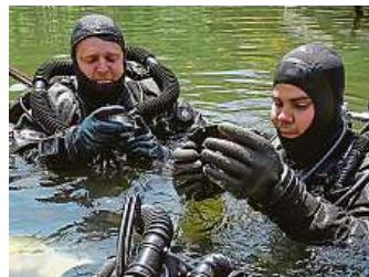
Potápěči strávili týden ve slověnickém lomu.

Oba muži zahájili vynoření už předchozí den v půl jedenácté. Během něj kroužili ve spirálách a zbavovali se dusíku z kos-