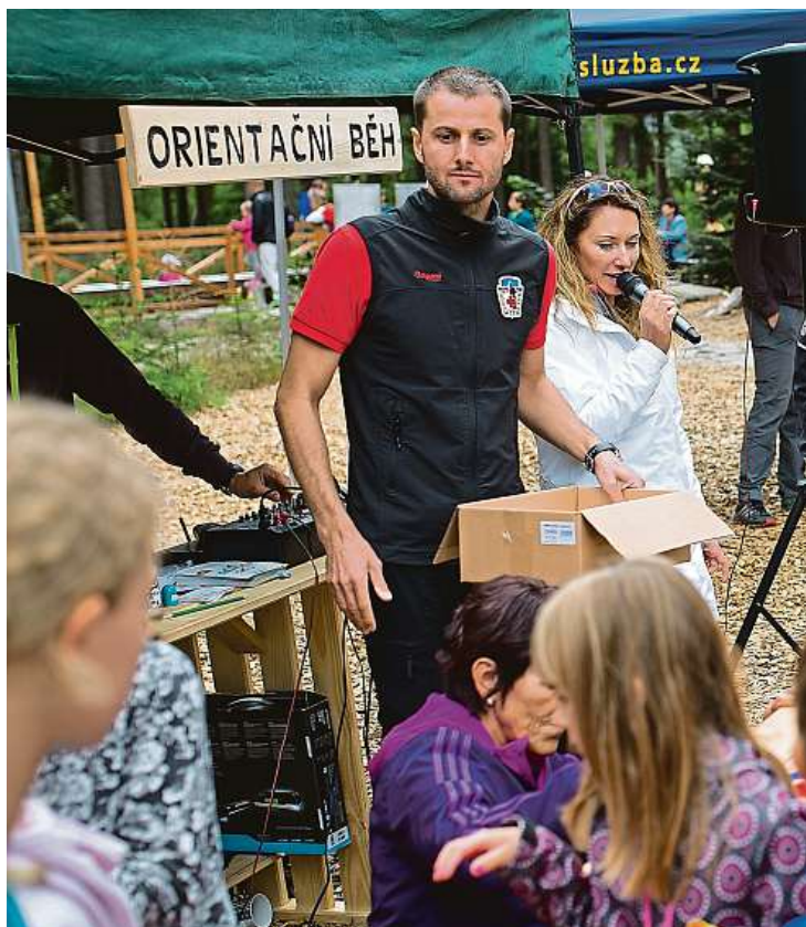
Na Lipno Sport Fest jezdí i řada známých osobností. V minulosti už tam byla třeba i Jarmila Kratochvílová.