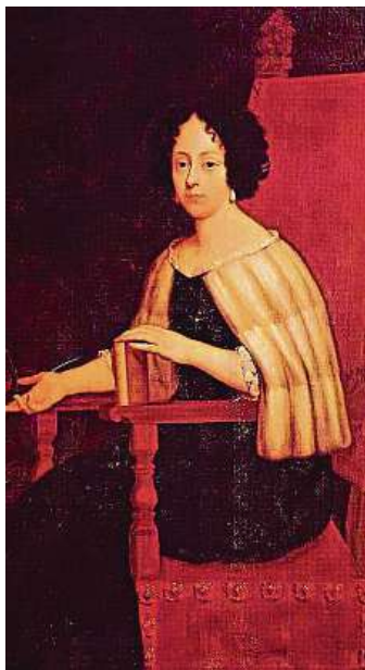
Elena Lucrezia Cornaro Piscopia