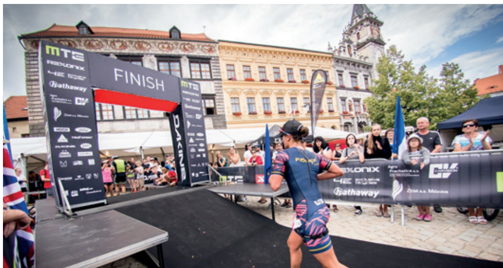
Do cíle budou závodníci dobíhat v historických kulisách města.