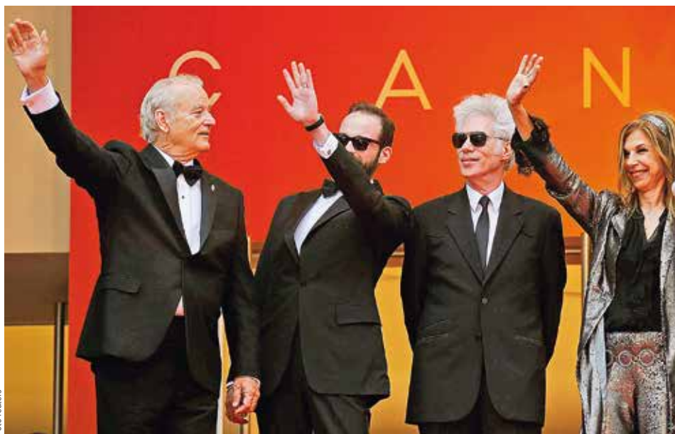
SLAVNOSTNÍ OTEVŘENÍ. Tradiční zahajovací ceremonii filmového festivalu v Cannes letos mimo jiné obstaral režisér Jim Jarmusch (druhý zprava) či Bill Murray (zcela vlevo).

Řada novinek uvedených s pompou v Cannes už je koupena do českých kin včetně očekávané vzpomínky Quentina Tarantina na vraždu Sharon Tateové Tenkrát v Hollywoodu. Dalšího kandidáta na Palmu, návrat Pedra Almódovara Bolest a sláva , uvidíme v Česku ještě v květnu, stejně jako nesou-