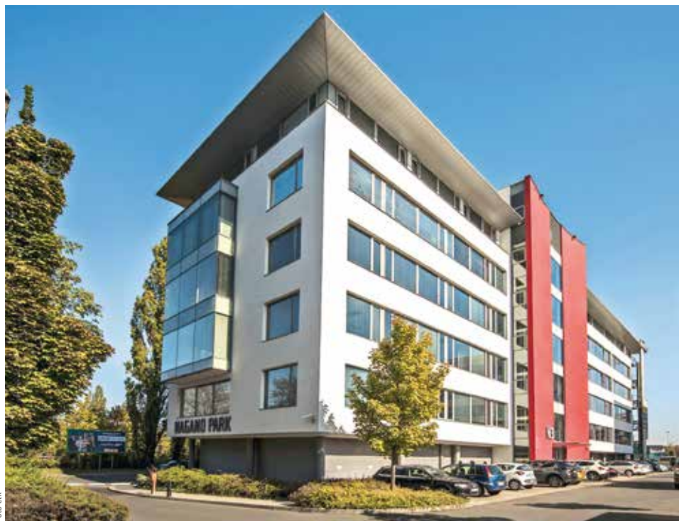
NAGANO TÁHNE. Dvacet let staré kancelářské centrum Nagano Park v Praze 3 je podle nového majitele pro nájemce stále atraktivní.