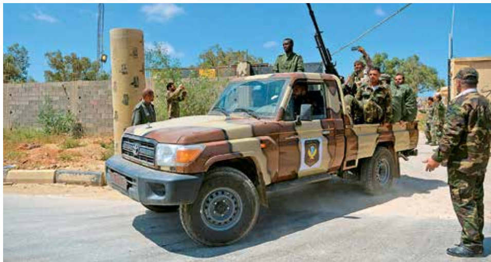
HAFTAROVI MUŽI. Členové samozvané Libyjské národní armády míří na Tripolis.

Nejméně 25 mrtvých a 80 zraněných si od neděle vyžádaly boje na jihu Tripolisu. S odvoláním na libyjské ministerstvo zdravotnictví o tom informovala agentura Reuters. Oddíl samozvané Libyjské národní armády, která je spřízněna s odpadlickou vládou na východě země a které velí polní maršál Chalífa Haftar, dorazily v neděli na předměstí libyjské metropole a střetly se s jednotkami mezinárodně uznávané vlády.