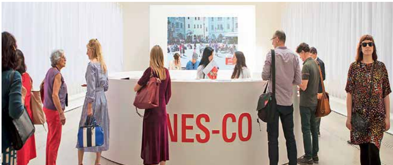
ČESKOSLOVENSKÝ PAVILON. V Benátkách proběhlo bienále architektury: půl roku bylo sídlem fiktivní firmy UNES-CO. Připravila ho umělkyně Katerina Šedá.