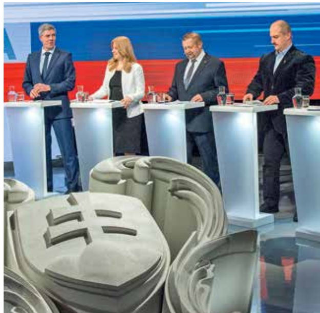
TVRDÝ BOJ. Kampaň před letošními volbami byla poměrně útočná, zapojily se dezinformační weby i církev.

Odborníkům přijde matoucí zejména to, že Čaputová v šetřeních vylétla nahoru až nedávno a velmi rychle. Což jako překvapení připouští i ona sama. Celkově je pak letošní kampaň hodnocena jako poměrně agresivní a emotivní, nechyběly v ní osobní útoky. Neziskové organizace upozornily zejména na negativní příspěvky Harabina, kterého označily za nejoblíbenějšího uchazeče dezinformačních webů. Do boje se zapojila i vlivná katolická církev. „Postavit se v televizi