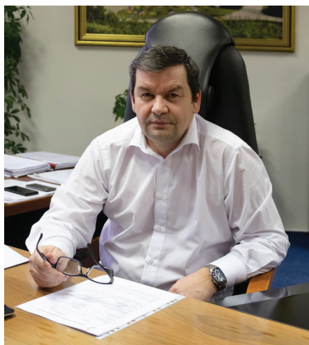
pro Soukromníky. A městský úřad? Poslední dva roky po sobě vítězství v soutěži „Přívětivý

Jako starosta města jsem se musel vymanit z bubliny podnikání a začít hledět na město velmi širokým pohledem. Zkušenosti z podnikání se hodily a dokázaly přesvědčit voliče, že my Soukromníci se umíme postarat nejen o sebe, své rodiny, své zaměstnance, ale když dostaneme důvěru, tak i o občany města. V komunálních volbách v roce 2014 jsme dostali od voličů 9 procent, u nás v Klášterci nad Ohří, kde máme v zastupitelstvu 21 zastupitelů, to znamenalo zisk dvou mandátů. Když jsem však v uplynulém volebním období dostal možnost předvést, jak umíme hospodařit my Soukromníci, ukázali jsme to. Pro práci jsme dokázali přesvědčit i mnoho aktivních zaměstnanců městského úřadu. A volební výsledek na podzim roku 2018? Téměř 32 procent a zisk sedmi mandátů, volební vítězství, čtyři radní, což je většina v sedmičlenné radě města, v absolutním počtu hlasů prvních šest míst