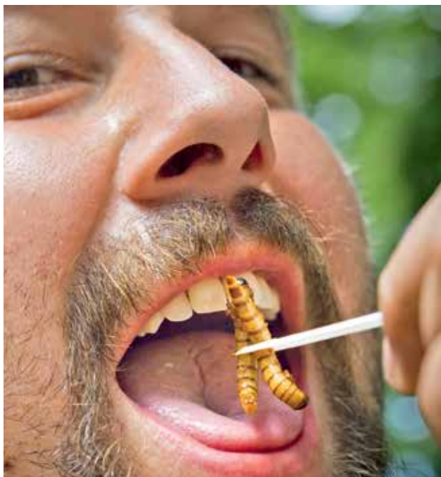
SLIBNÁ POTRAVINA. Za výtečný zdroj bílkovin v hmyzí říši bývá považován potměnkou. Nejsnazší úpravou je smažení.

Hlavním argumentem ve prospěch chovu hmyzu a jeho následné konzumace je ochrana životního prostředí. Bere se jako fakt, že ve srovnání s hospodářskými zvířaty vyrábí hmyz živočišné bílkoviny a tuky podstatně efektivněji. Například cvrček dokáže za ideálních podmínek vyrobit jeden gram svých tkání z 1,6 gramu vysoce kvalitní potravy. Za méně příhodných pod-