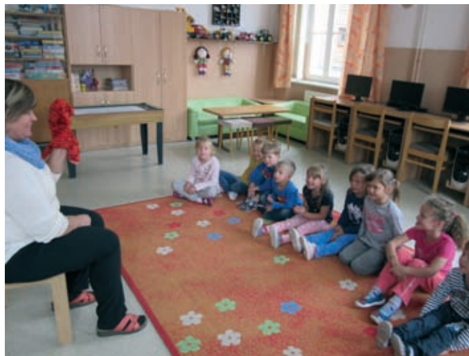
↑ Angličtina s předškoláky