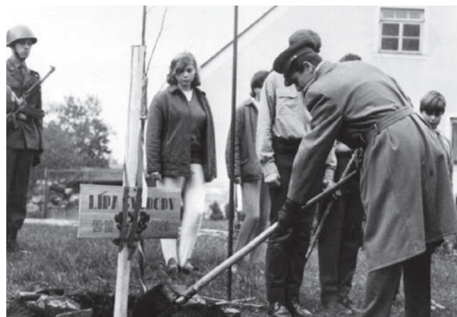
Sázení Lípy svobody na náměstí v Kašperských Horách 28. října 1968