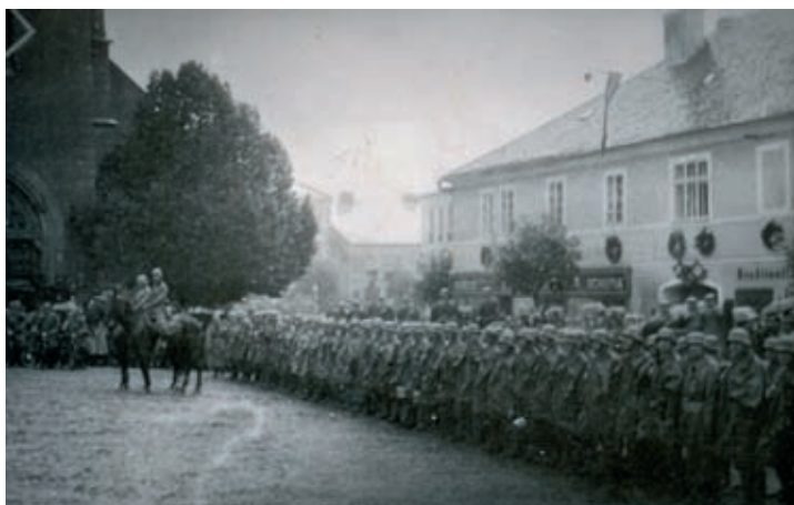
Jednotky německé wehrmacht nastoupené na náměstí v Kašperských Horách 10. října 1938