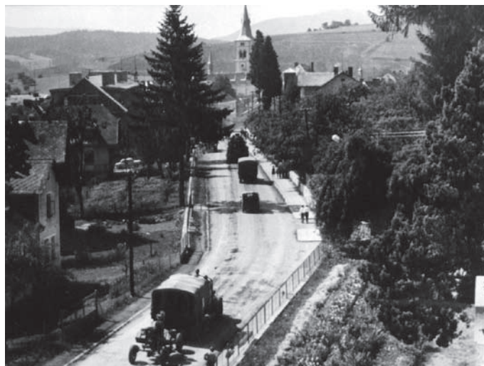
Průjezd sovětských okupačních jednotek Kašperskými Horami v srpnu 1968