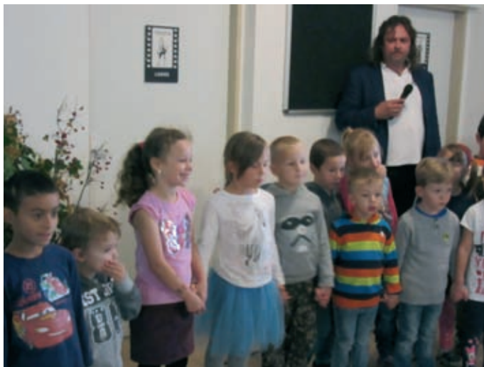
↑ Vystoupení na Den seniorů