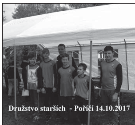
Družstvo starších - Poříčí 14.10.2017