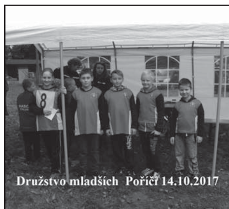
Družstvo mladších Poříčí 14.10.2017

Dne 14.10.2017 se naše 2 družstva mladých hasičů zúčastnila závodu ZPV v obci Poříčí. Družstvo mladších se umístilo na 6. místě a družstvo starších na 4. místě. Další informace a další fotografie naleznete na www.hasicivolyne.estranky.cz nebo na facebooku.