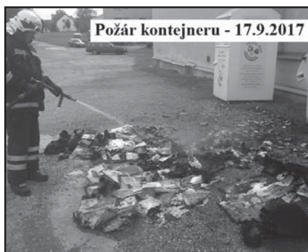
Požár kontejneru - 17.9.2017