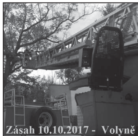
Zásah 10.10.2017 - Volyně