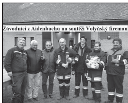
Závodníci z Aidenbachu na soutěži Volyňský fireman