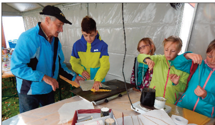
Během oslav si děti zkusily výrobu svíček z vosku