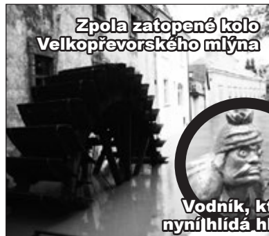
Zpola zatopené kolo Velkopřevorského mlýna