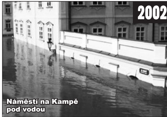
Náměstí na Kampě pod vodou