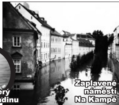
Zaplavené náměstí Na Kampě