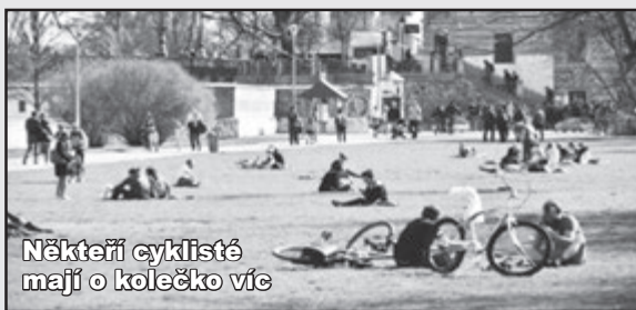
Někteří cyklisté mají o kolečko víc

Tak si říkám, jak by asi vypadal silniční provoz, kdyby se zrušilo udělování pokut. Už to vidím, dopravní uklidňujícím hlasem promlouvají do řidičovy duše: „ Pane řidiči, v obci se jezdí 50 km v hodině a vy jste