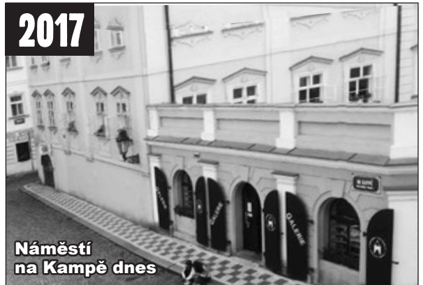
Náměstí na Kampě dnes