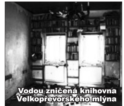
Vodou zničená knihovna Velkopřevorského mlýna