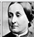
Karolina Světlá SPISOVATELKA