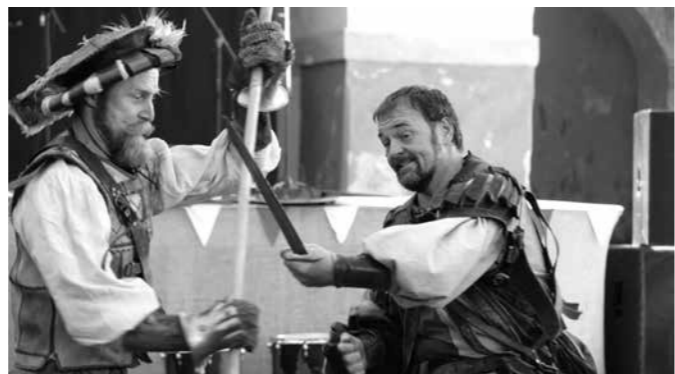
Meče řinčely při městské slavnosti na vimperském zámku.

V případě nedodržení podmínek, stanovených pro odběr pneu, bude strážní službou zájemce z odběru vyloučen.