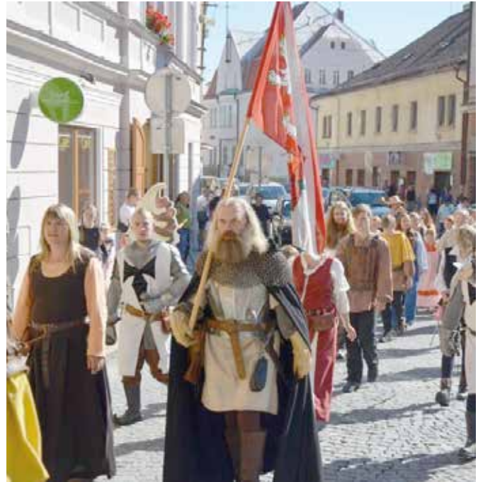
V sobotu 27. 8. se ve Vimperku konala Městská zámecká slavnost. Více fotografií na poslední straně.