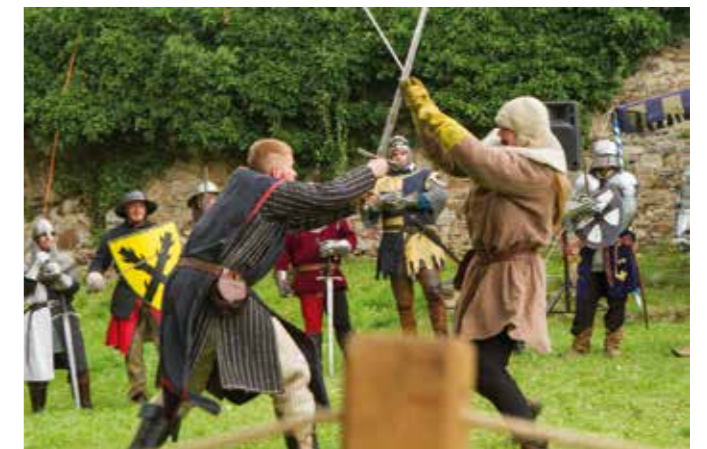
První srpnová sobota byla ve znamení bitvy na Winterbergu