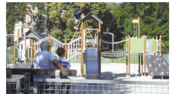
Nové herní sestavy na dětském hřišti u Volyňky