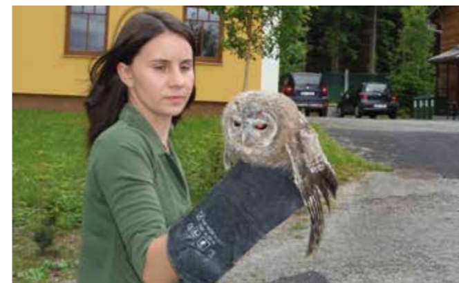
Zachráněný a zotavený puštík před návratem do přírody – více na str. 9