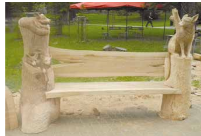
V červenci se do Vimperka tradičně sjeli dřevosochaři