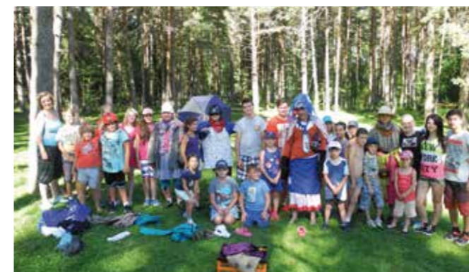
Krásné letní počasí si užily vybrané děti ze sociálně znevýhodněných rodin na letním táboře v Nové Peci