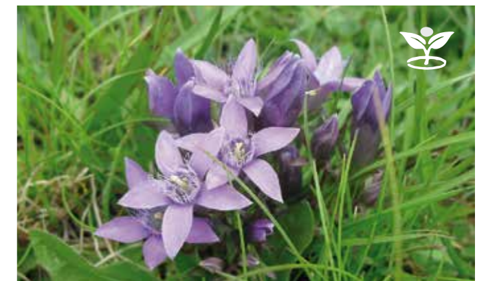
Hořeček mnohotvarý český – více na str. 17.