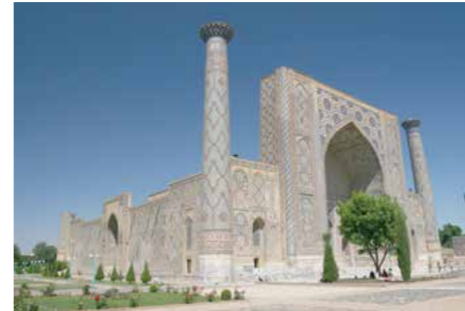
30. 9. se můžete vypravit do kavárny Ve skále na besedu o střední Asii