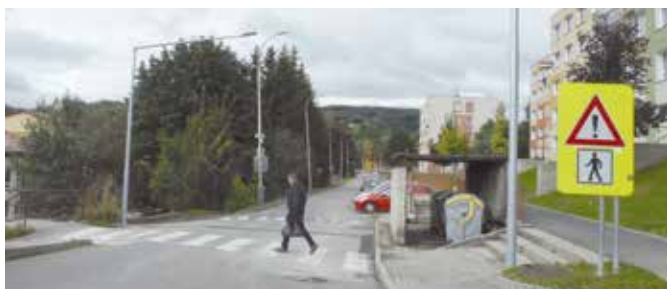
V Mírové ulici je nově osvětlený přechod.